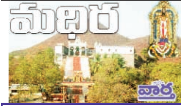
మధిర, బోనకల్, చింతకాని, ఎర్రపాలెం, ముదిగొండ