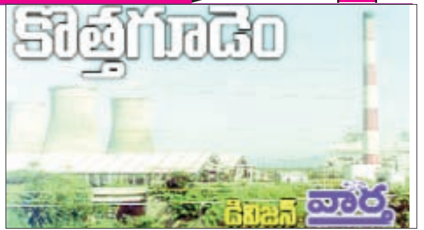
చుంచుపల్లి, జూలూరుపాడు, సుజాతనగర్