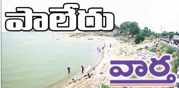
నేలకొండపల్లి, ఖమ్మం రూరల్, కూసుమంచి, తిరుమలాయపాలెం

ఆయా పాఠశాలలలో ఆయన ఎంకావోతో కలిసి విద్యార్థుల ప్రగతిని, నోట్ పుస్తకాలను, అభ్యాస పుస్తకములను తనిఖీ చేశారు. విద్యార్థుల కోసం సిద్ధం చేసిన మధ్యాహ్న భోజనంను పరిశీలించి సంతృప్తి వ్యక్తం చేశారు. ఈ కార్యక్రమంలో ఆయా పాఠశాలల ప్రధానోపాధ్యాయులు, ఉపాధ్యాయులు పాల్గొన్నారు.