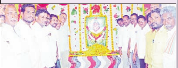
తల్లాడ, అక్టోబర్ 21, ప్రభాతవార్త