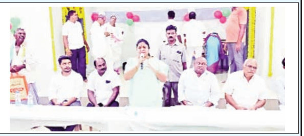
తల్లాడ, అక్టోబర్ 21, ప్రభాతవార్త