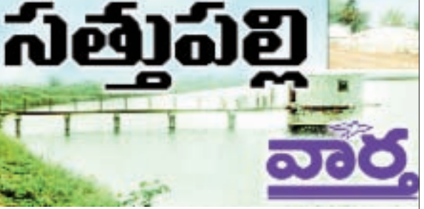
సత్తుపల్లి, పెనుబల్లి, కల్లూరు, తల్లాడ, వేంసూర్