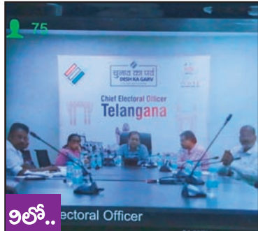
9లో.. Electoral Officer