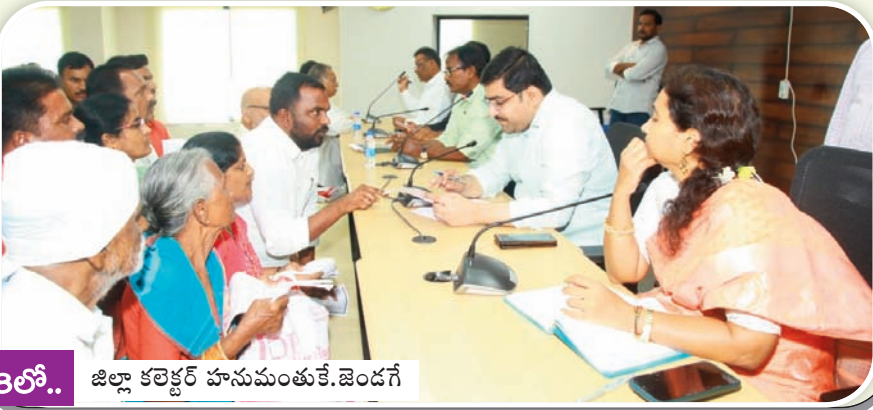
8లో.. జిల్లా కలెక్టర్ హనుమంతుకే.జెండగే