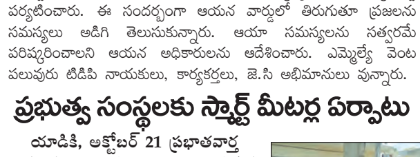
యాడికి, అక్టోబర్ 21 ప్రభాతవార్డు