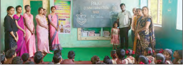
నివాకులు అర్చిస్తున్న విద్యార్థులు, ఉపాధ్యాయులు