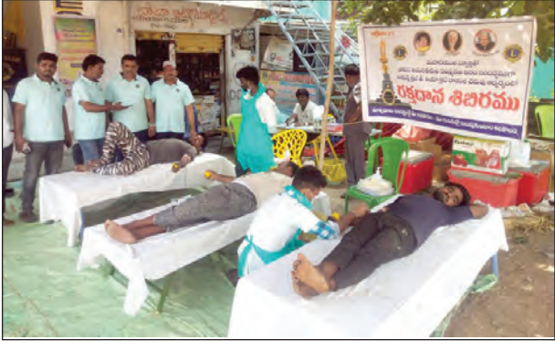
రక్తదానం చేస్తున్న దృశ్యం