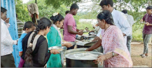
భోజనం వడ్డిస్తున్న దృశ్యం