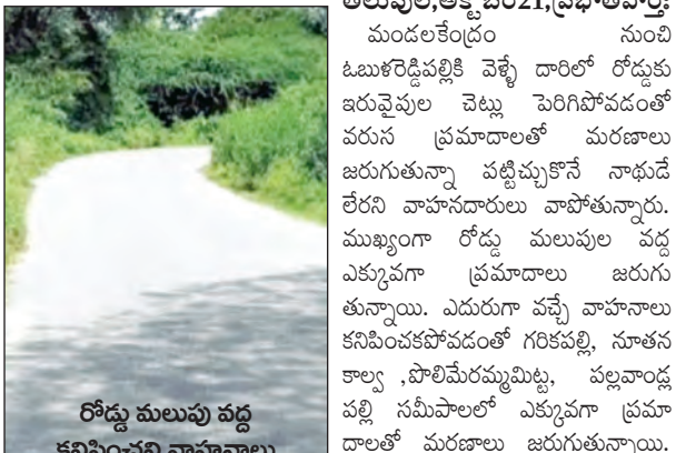
తలుపుల, అక్టోబర్ 21, ప్రభాతవార్డు

మండల కేంద్రం సుంపి ఓబుళిరెడ్డిపల్లికి వెళ్ళే దారిలో రోడ్డుకు ఇరువైపుల చెట్లు పెరిగిపోవడంతో వరుస ప్రమాదాలతో మరణాలు జరుగుతున్నా వట్టిముక్కనే నాశుడే లేదని వాహనదారులు వాపోతున్నారు. ముఖ్యంగా రోడ్డు మలుపుల వద్ద ఎక్కువగా ప్రమాదాలు జరుగుతున్నాయి. ఎదురుగా వచ్చే వాహనాలు కనిపించకపోవడంతో గరికపల్లి, నూతన కాల్య, పొలిమేరపల్లిపల్లి, పల్లవూరు వల్ల సమీపాలలో ఎక్కువగా ప్రమాదాలతో మరణాలు జరుగుతున్నాయి. నెల రోజుల్లోని ముగ్గురి ప్రాణాలు గాల్లో కలిసిపోయాయి. ఇప్పటికైనా సంబంధిత అధికారులు చర్యలు తీసుకోవాలని పలువురు వాహనదారులు కోరుతున్నారు.