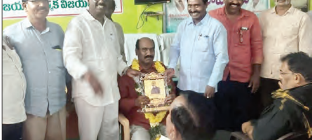
గాండ్లపేంట, అక్టోబర్ 21 ప్రభాతవార్డు

ఆంధ్రప్రదేశ్ రాష్ట్ర ప్రభుత్వం వారి ఆదేశాల మేరకు గాండ్లపేంట మండలంలోని వివిధ గ్రామాలలో భూముల శి సర్వే చేయమన్నట్లు తహశీల్దార్లు ఒక ప్రకటనలో తెలిపారు. ఇందుకగాను రైతులు పట్టణాలకు వెళ్ళుతున్నారని, 1వీ నకలు (మీ భూమి నంబరు), పట్టణాలకు వెళ్ళుతున్నారని, 2వీ నకలు (మీ భూమి నంబరు), పట్టణాలకు వెళ్ళుతున్నారని, 3వీ నకలు (మీ భూమి నంబరు) వెళ్ళుతున్నారని సర్పంచిగారు ఉపయోగించారు. ఈ నెల 23న కామచేసులైలు గ్రామం, 24న మదుగులవారిగోవిందు, 25న జీసీపలకుండు, 26న కురుమూడి, 27న తుమ్మలైలులో నిర్వహించడం జరుగుతుందన్నారు.