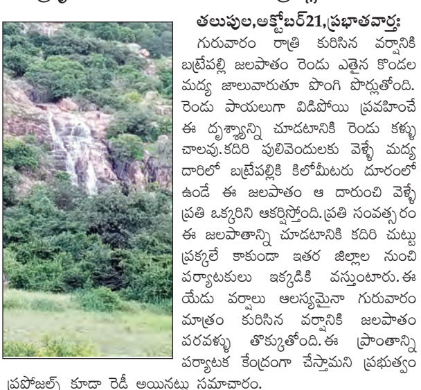
తలుపుల, అక్టోబర్ 21, ప్రభాతవార్డు

గురువారం రాత్రి కురిసిన వర్షానికి బట్టేపల్లి జలపాతం రెండు అవైసల కొండల మధ్య జాలువారుతూ పొంగి పొర్లుతోంది. రెండు పావులుగా విడిపోయిన ప్రవహించే ఈ దృశ్యాన్ని చూడడానికి రెండు కళ్ళు చాలవు. కదిరి పులివెందుల వేళ్ళే మధ్య దారిలో బట్టేపల్లికి కిలోమీటరు దూరంలో ఉండే ఈ జలపాతం ఆ దారుణి వేళ్ళే ప్రతి ఒక్కరిని ఆకర్షిస్తోంది. ప్రతి సంవత్సరం ఈ జలపాతాన్ని చూడడానికి కదిరి మట్టు ప్రత్యేక కాకుండా ఇతర జిల్లాల నుంచి వర్షాతులు ఇక్కడికి వస్తుంటారు. ఈ యేడు వర్షాలు అసన్మునా గురువారం మాత్రం కురిసిన వర్షానికి జలపాతం వరకన్న తోకుతోంది. ఈ ప్రాంతాన్ని వర్షాతుల కేంద్రంగా చేస్తామని ప్రభుత్వం ప్రకటించి కూడా రేడి ఆయనపట్ల సమాచారం.