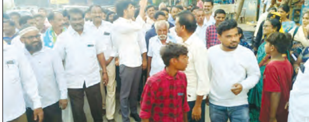
వార్డులో పర్యటిస్తున్న ఎమ్మెల్యే జె.సి అశ్వతరెడ్డి

తాడిపత్రి టౌన్, అక్టోబర్ 21 ప్రభాతవార్డు పట్టణంలోని పాతకోటలో సోమవారం ఎమ్మెల్యే జె.సి అశ్వతరెడ్డి పర్యటించారు. ఈ సందర్భంగా ఆయన వార్డులో తిరుగుతూ ప్రజలను సమన్వయ అడిగి తెలుసుకున్నారు. ఆయా సమస్యలను సత్వరమే పరిష్కరించాలని ఆయన అధికారులను ఆదేశించారు. ఎమ్మెల్యే వెంట పలువురు టిడిపి నాయకులు, కార్యకర్తలు, జె.సి అభిమానులు వున్నారు.