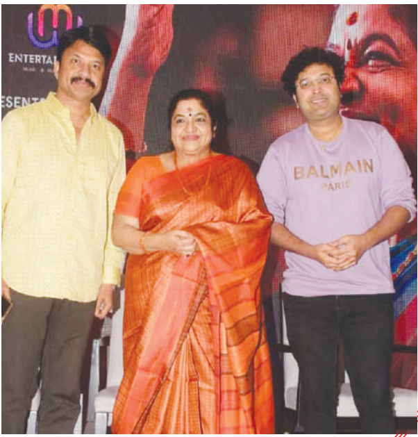
నివాళులతో నిండిన రాత్రిని ఆహ్వానిస్తోంది. ఈ వేడుకను నిర్వహించిన ఎన్ ఛాంట్ మీడియా, ఎమ్3 ఎంటర్టైన్ మెంట్ వారు చిత్రకి