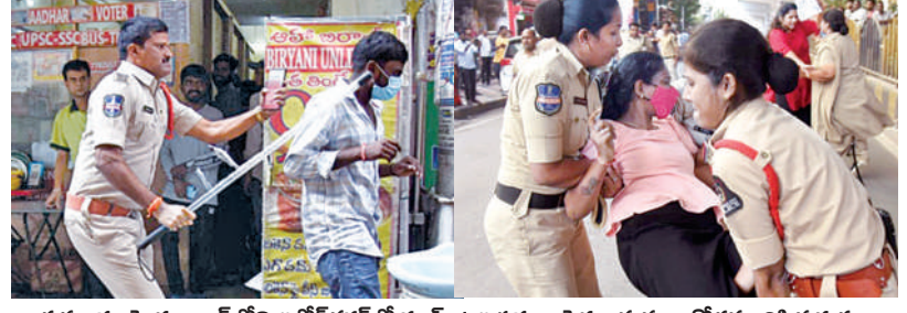
శుక్రవారం హైదరాబాద్ లోని అపోకింగర్ లో గ్రూప్-1 అభ్యర్థులు పెద్ద ఎత్తున అండ్ కోజి జరిపిన ధృక్పథం

సింగిల్ బెంచి తీర్పునకు సమర్థన అభ్యర్థులకు బయోమెట్రిక్ హాజరు తీసుకోవాలని ఆదేశం