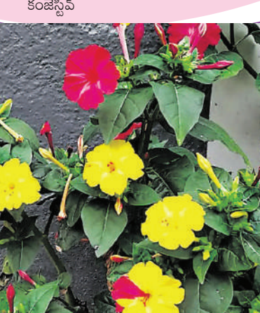
డ్రెలాగానూ వినియోగిస్తారు. □

రంగులు మార్చే రుద్రాక్ష పూలు పూజల్లో వాడతాయి. అయితే, ఈ మొక్క పుట్టింది మాత్రం పెరూ దేశంలోనే. ఆహార రంగుల తయారీలో ఈ పూలను వినియోగిస్తారు. వీటికి ఔషధ గుణాలు ఎక్కువ. ముఖ్యంగా ఆయుర్వేద వైద్యంలో మూత్ర సమస్యలు, వాపులు తగ్గించుట, గాయాలకు చికిత్సగానూ వాడతారు. వీటి వేర్లకు విరేచనాలను తగ్గించే శక్తి ఉండటం, ముఖ్యంగా ఇందులోనికొన్ని రకాల వికసననాలను కాన్యాటిక్