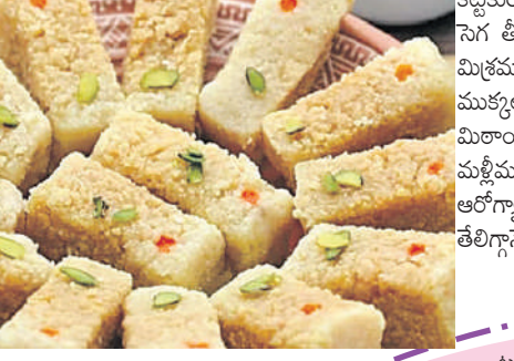
కట్టుకుంటూ కలియ తిప్పుతుంది. దగ్గరగా అయ్యారక సెగ తీసుకోవాలి. ఒక పల్లెంలో నెయ్యి రాసి. ఈ మిశ్రమాన్ని సమంగా నర్చి, నచ్చిన ఆకృతిలో ముక్కలుగా కోసి, పిన్న పలుకులు చల్లితే సరి. బియ్యం మిరాయి సిద్ధం పిల్లలు ఒకసారి రుచి చూశారంటే మళ్ళీమళ్ళికావాలంటుంది ఇంకానే బేస్ట్ గా ఉంటుంది. ఆలోచనానికే మంచిగా మారు చేసే చూడండి, తేలిగ్గానే అయిపోతుంది. □