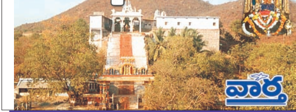
మధిర, బోనకల్, చింతకాని, ఎర్రపాలెం, ముదిగొండ