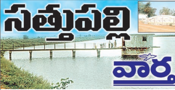
సత్తుపల్లి, పెనుబల్లి, కల్లూరు, తల్లాడ, వేంసూర్