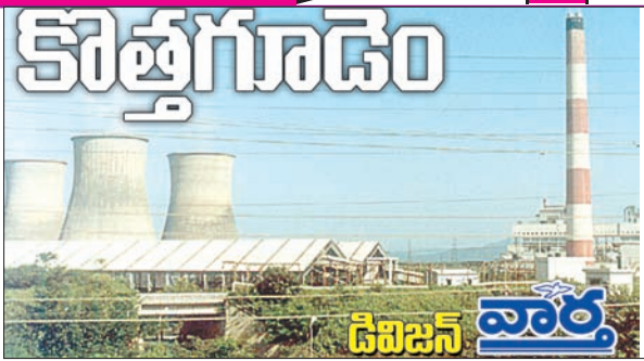
చుంచుపల్లి, జూలూరుపాడు, సుజాతనగర్