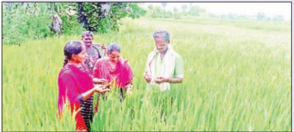
కూసుమంచి, అక్టోబర్ 18 (ప్రభాతవార్త) :