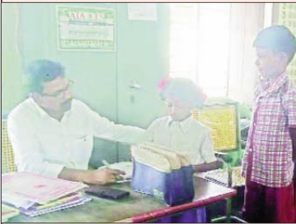
పినపాక, అక్టోబర్ 18, ప్రభాతవార్త

మండల పరిధిలోని పలు గ్రామాల్లో గల ప్రభుత్వ పాఠశాలలను శుక్రవారం ఎంజిఐ నాయక పరిశీలించారు. పాఠశాలలకు సంబంధించి పలు రికార్డులను పరిశీలించారు. ఉప్పాక పాఠశాలను ఉదయం 9 గంటలకు సందర్శించి పాఠశాల ఆసెంబ్లీలో పాల్గొని ఉపాధ్యాయుల బోధన పనితీరును పరిశీలించారు. ఎంపిపిఎస్ పెంటన్నగూడెంలో గల ఎంపిపిఎస్ పాఠశాలను, మడతన కుంట ఎంపిపిఎస్ పాఠశాలను, బంధగిరి నగరంలో గల జిపిఎస్ పాఠశాలను, భూపాలపట్నంలో గల ఎంపిపిఎస్, బెన్నగూడెం ఎంపిపిఎస్ పాఠశాల, జగ్గంపల్లి గల ఎంపి యుపిఎస్ పాఠశాలలను సందర్శించారు. విద్యార్థులకు సజ్జెక్టులపై గల సామర్థ్యాలను పరిశీలించారు. అదేవిధంగా పాఠశాలలో విద్యార్థుల రోజువారీ హాజరు శాతాన్ని పరిశీలించారు. అనంతరం ఆయా తరగతులు వెళ్లి విద్యార్థుల పాఠ్యాంశాలు పదివించారు. పాఠ్యాంశాలను ఎప్పటికప్పుడు చదవడం, రాయడం వల్ల విద్యార్థులు పరీక్షల్లో మంచి ఫలితాలు సాధించవచ్చని సూచించారు. విద్యార్థులు క్రమశిక్షణతో ఉపాధ్యాయులు చెప్పిన విధంగా చదువుకుని మంచి ఫలితాలు సాధించి పాఠశాలకు, తల్లిదండ్రులకు మంచిపేరు తీసుకు రావాలని సూచించారు. ఈ కార్యక్రమంలో పాఠశాల ఉపాధ్యాయులు, సిఆర్పిలు పాల్గొన్నారు.