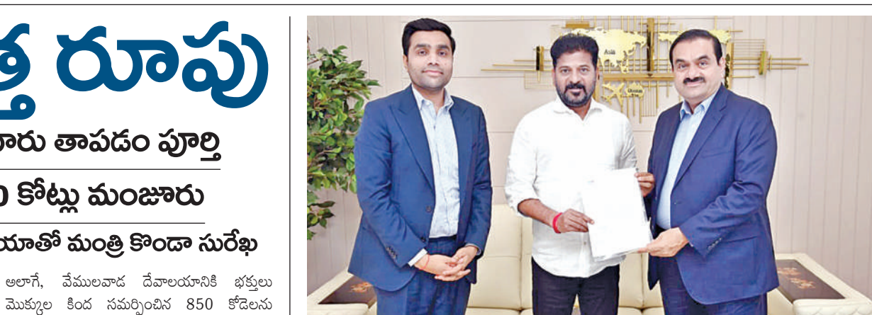
శుక్రవారం హైదరాబాద్ లోని సిఎం రెవెన్యూ డివిజన్ అయిన గౌతమ్ అదాని