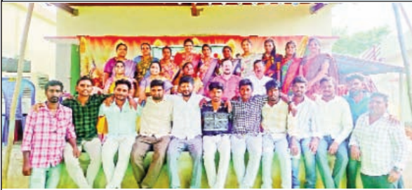
రుద్రంపూర్, అక్టోబర్ 18 - ప్రభాతవార్త: