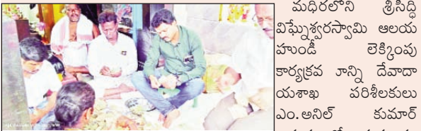
మధిరరూరల్, అక్టోబర్ 18, ప్రభాతవార్త: