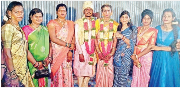
మారింది. దీంతో వారు ఒకరిని విడిచి ఒకరు ఉండలేనంతగా కలిసిపోయారు. ఇక ప్రేమలో

గొల్లపల్లి, ప్రభాతవార్త : ఆ ట్రాన్స్ జెండర్ పై అతనికి ప్రేమ పుట్టింది. రెండు సంవత్సరాలుగా వీరు ప్రేమించుకుంటున్నారు. చివరకు ఆ ప్రేమ పెళ్ళిగా మారి వారి ఇరువురి జీవితాల్లో ఆనందాన్ని నింపింది. వివరాలకు వెళితే జగిత్యాల జిల్లా గొల్లపల్లి మండలం లక్ష్మీపూర్ గ్రామానికి చెందిన యువకుడు, మల్యాల మండలంలోని మ్యూడంపల్లి గ్రామానికి చెందిన హిజ్రాతో రెండేళ్ల క్రితం పరిచయం ఏర్పడింది. ఆ పరిచయం కాస్త ప్రేమగా