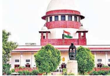
న్యూఢిల్లీ, అక్టోబరు 17: పౌరసత్వ చట్టం 1953లోని సెక్షన్ 6ఎ రాజ్యాంగం ధర్మాసనం నుండి కోర్టు రాజ్యాంగం ధర్మాసనం నేడు సమర్థించింది. సిఐఐ డివై చంద్రమౌళి, జస్టిస్ సూర్యకాంత్, జస్టిస్ ఎంఎం నందరే, జస్టిస్ జై పార్టీ వాలా, జస్టిస్ మనోజ్ మోహన్ కామిన్ ధర్మాసనం నేడు 4:1 మెజార్టీతో తీర్పును వెలువరించింది. న్యాయమూర్తుల్లో జస్టిస్ పార్టీ వాలా మాత్రమే ఇది రాజ్యాంగం విరుద్ధమంటూ భిన్నాభిప్రాయం వ్యక్తం చేశారు. ఈ సందర్భంగా చంద్రమౌళి మాట్లాడుతూ అక్రమ వలసలకు అస్సాం అలాగే 6 రాజకీయ పరిష్కారం. అదే సమయంలో సెక్షన్ 6ఎ అనేది చట్టబద్ధమైన

మాధ్యం. ఈ నిబంధనల రూపొందించడంలో పాటు స్థానికుల ప్రయోజనాలను కాపాడే సమతౌల్యత ఈ సెక్షన్ కు ఉంది. ఇక దీనిలోని కలామ్ డేట్ గా నిర్ణయించిన 1971 మార్చి 25 అనేది సరైనది. ఎందుకంటే అప్పటికే బంగ్లాదేశ్ యుద్ధం ముగియడం, బంగ్లాదేశ్ యుద్ధం నేపథ్యంలోనే ఈ సెక్షన్ తీసుకోవాలని విషయాన్ని ఇది చెబుతోంది. ఈ సెక్షన్లు అంత ఎక్కువగా జనాభాను కలుపుకోలేదు. మరీ తక్కువగాను విలీనం చేసుకోలేదు అని పేర్కొన్నారు. పౌరసత్వ చట్టం 1953 సెక్షన్ 6ఎ ప్రకారం 1966 జనవరి నుంచి 1971 మార్చి 25 వరకు అస్సాంకు వచ్చిన వలసదారులు పౌరసత్వం కోరవచ్చు. ఈ నిబంధనను 1985లో అస్సాం అలాగే తర్వాత తీసుకోవచ్చు. అస్సాంలోని బంగ్లాదేశ్ వలసలపై ఉద్దేశించిన వారితో కేంద్ర ప్రభుత్వం చేసుకొన్న ఒప్పందమే ఇది. దీనిపట్ల బద్ధతపై అస్సాంలోని కొన్ని స్థానిక ప్రాధాన్యత వ్యక్తం చేశారు. ఈ సందర్భంగా చంద్రమౌళి మాట్లాడుతూ అక్రమ వలసలకు అస్సాం అలాగే 6 రాజకీయ పరిష్కారం. అదే సమయంలో సెక్షన్ 6ఎ అనేది చట్టబద్ధమైన