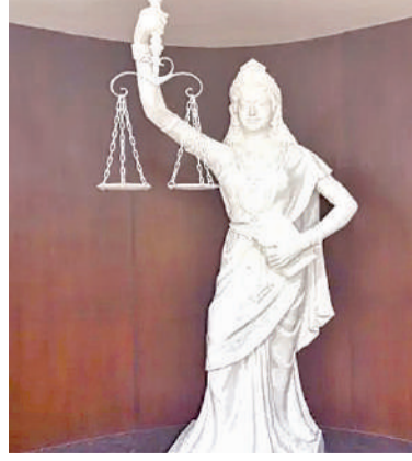
న్యూఢిల్లీ, అక్టోబరు 17: సుప్రీంకోర్టులో కొన్ని మార్పులతో కొత్త న్యాయదేవత (లేడీ ఆఫ్ జస్టిస్) విగ్రహం దర్శనమిచ్చింది. చట్టం గుడ్డిది

కాదన్న సందేశాన్నిచ్చేలా న్యాయదేవత కళ్లకు కట్టి ఉండే నల్ల రిబ్బన్ ను తొలగించడంతో పాటు అన్యాయాన్ని శిక్షించడంలో ప్రతీకగా నిలిచే చేతిలోని ఖడ్గం స్థానంలో రాజ్యాంగాన్ని కొత్త విగ్రహంలోకి తెచ్చారు. న్యాయదేవత మరో చేతిలో కనిపించే త్రాసును అలాగే ఉంచారు. సుప్రీంకోర్టులో న్యాయమూర్తుల గ్రంథాలయంలో కొత్త విగ్రహం కనిపించింది. ప్రధాన న్యాయమూర్తి జస్టిస్ చంద్రమౌళి ఆదేశాల మేరకు న్యాయదేవత విగ్రహంలో మార్పులు చేసినట్లు సమాచారం. ట్రిబియల్ వలసపాద చట్టాలకు స్పృహ పలుకుతూ కొత్త చట్టాలను అమల్లోకి తెచ్చిన నేపథ్యంలో న్యాయదేవత విగ్రహంలోనూ మార్పులు చేయాలని గతంలోనే జస్టిస్ చంద్రమౌళి సూచించారు. న్యాయదేవత కళ్లకు గంతులు అవసరం లేదు. చట్టం ఎప్పుడు గుడ్డిది కాదు. అది అందరినీ సమానంగా చూస్తుంది.