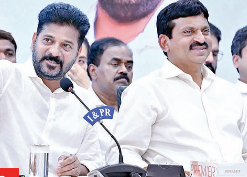
గురువారం హైదరాబాద్ లో మీడియాతో సీఎం రేవంత్. చిత్రంలో మంత్రి పొంగులేటి తదితరులు

ప్రభాతవార్త ప్రధాన ప్రతినిధి, హైదరాబాద్, అక్టోబరు 17: రాష్ట్ర భవిష్యత్తును నిర్దేశించే ప్రాజెక్టును కాంగ్రెస్ సర్కార్ చేపట్టింది, తాము చేపడుతున్నది మూసీ సుందరీకరణ కాదని, మూసీ నది పునరుజ్జీవనమని ముఖ్యమంత్రి రేవంత్ రెడ్డి స్పష్టం చేశారు. నగరం మధ్య గుండా నది వెళ్తున్న తెలంగాణ రాజధాని హైదరాబాద్ తరహాలో దేశంలో మరొకటి లేదు.. అలాంటి మూసీ నదిని గత పాలకులు మురికి కూపంలోకి నెట్టారని బిఆర్ఎస్ పై ధ్వజమెత్తారు. మూసీ