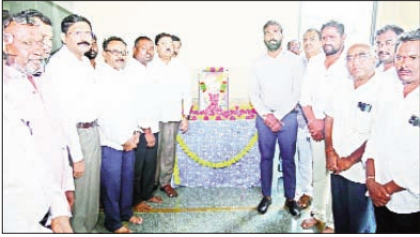
మహర్షి వాల్మీకి తన కవితవ్యం ద్వారా