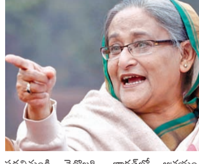
షేక్ హసీనాపై అరెస్టు వారంట్ జారీ చేసింది.