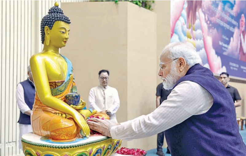
అభిషేకం దివస్ సంధర్పంగా గురువారం న్యూఢిల్లీలో బుద్ధుడికి పుష్పాలను సమర్పించి ప్రధాని మోడీ