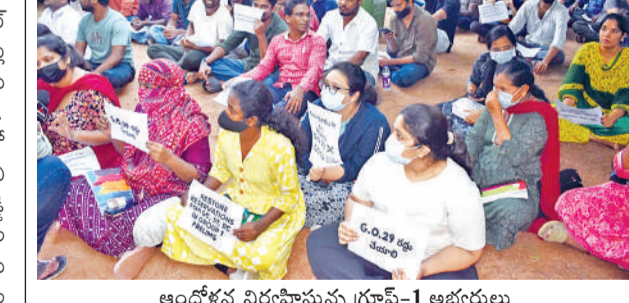
అందోళ్లను నిర్వహిస్తున్న గ్రూప్-1 అభ్యర్థులు