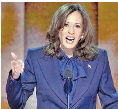
వాషింగ్టన్, అక్టోబరు 17: అమెరికాలో అధ్యక్ష ఎన్నికలు సమీపిస్తున్న తరుణంలో అధ్యక్షులు పోటీలలో ప్రవహించే ప్రవచనాలు చేస్తున్నారు. ఈ క్రమంలో అమెరికాలోని వలసల వ్యవస్థపై ఉపాధ్యక్షులు రివల్యూషన్ అధ్యక్ష కమిటీ హోల్ లోని కలక వ్యాఖ్యలు చేశారు. అధ్యక్షురాలిగా ఎన్నికైతే వలసల వ్యవస్థను సవరించే బిల్లుపై తొలి సంతకం చేస్తానని పేర్కొన్నారు. ఈ మేరకు ఓ వార్తా సంస్థకు ఇచ్చిన ఇంటర్వ్యూలో వ్యాఖ్యా