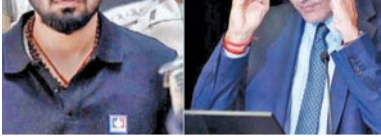
న్యూఢిల్లీ, అక్టోబరు 17: వ్యవస్థీకృత నేరగాళ్లకు భారత్ ఆశ్రయం కల్పిస్తోందని భారత్ విదేశాంగ శాఖ ఆరోపించింది. రణధీర్ జైన్ సారథిగా ఉన్న కెనడా ఇప్పటికీ తాము కోరిన వ్యక్తులను అప్పగించేందుకు ఎలాంటి స్పందన చూపించడం లేదని ఆరోపించారు. లారెన్స్ బిష్టోయ్ గ్యాంగ్ ప్రముఖ మాఫియా డాన్ గ్యాంగ్ అని వారం దరగా కెనడానుంచే నేరాలకు పాల్పడుతున్నట్లు తెలిపారు. ఇప్పటికే కెనడా ప్రభుత్వం పద్ద తాము పంపిన 26 దరఖాస్తులు పెండింగ్ లో

ఉన్నాయని, వదలకుంటూ పెండింగ్ లో ఉంచిన ఆరోపించారు. ఇప్పటికే వలస వ్యవస్థలు విజృంభిస్తున్న కెనడా పెడవెవిన పెట్టిందన్నారు. 2023 సెప్టెంబరునుంచి కూడా భారత్ కెనడాపర్యట్ దౌత్యబంధాలు బెదిరిపోతాయి. ఖలిస్తానీ ఉగ్రవాద గ్రూప్ సభ్యుడు హరీద్ సింగ్ నిజ్జర్ కెనడాలోనే హత్యకు గురయినట్లు సంది ఈ విషయం మరింత ముదిరింది. ఇప్పటికీ కూడా కెనడా నిజ్జర్ హత్యలో భారత్ ఏజెంట్ల పాత్ర ఉందని వెల్లడించారు. అంతేకాక డెన్వర్ లోని అమెరికన్ కనడా దర్యాప్తు సంస్థలు తేల్చారు కెనడా ప్రధాని జస్టిన్ ట్రూడో వెల్లడించారు. ఇదిలా ఉండగా అమెరికా జస్టిస్ డిపార్ట్ మెంట్ (డి.ఐ.) పరిశోధన విశ్లేషణ విభాగం (ఓ) మాజీ