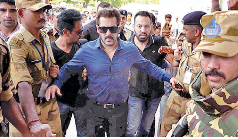
న్యూఢిల్లీ, అక్టోబరు 17: బాలీవుడ్ నటుడు సల్మాన్ ఖాన్ ను హత్యచేసేందుకు 25 లక్షల సుమార్ కాంట్రాక్టు తీసుకున్నారని నవీముంబాయి పోలీసులు తమ ఛార్జీషీట్ లో చెప్పారు. మహారాష్ట్రలోని వన్స్ లో ఉన్న ఫామ్ హౌస్ లోనే సల్మాన్ ను కాల్చినట్లు దుండగులు చెప్పారు. ఇందులో ఇరుగు పక్క ఉన్నాయి. 25 లక్షల క్యాష్ తోపాటు పాక్ నుంచి రప్పించిన ఎరె

బాలీవుడ్ నటుడు సల్మాన్ ను హత్యచేసేందుకు లారెన్స్ బిష్టోయ్ పథకం