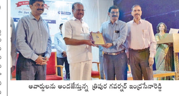
అవార్డులు అందజేస్తున్న త్రిపుర గవర్నర్ ఇంద్రసేనారెడ్డి

సీనియర్ అధికారులతో పర్యవేక్షించనున్నట్లు తెలిపారు. జిల్లా కలెక్టర్లు నేరుగా పరీక్షల నిర్వహణను పర్యవేక్షిస్తారు.. సంబంధిత పోలీస్ కమిషన్లకు కూడా తగు బంధంబును ఏర్పాటు చేస్తున్నట్లు తెలిపారు. అన్ని శాఖల అధికారులు ఏమిమైనా స్వల్ప సంఘటనలు జరగకుండా అత్యంత అప్రమత్తంగా పరీక్షలను నిర్వహించాలని సీనియర్ అధికారులను ఆదేశించారు. డి.జి.ఎస్.ఎస్. ఛైర్మన్ డాక్టర్ ఎం మహేందర్ రెడ్డి మాట్లాడుతూ 2011 తరువాత గ్రూప్-1 మొయస్ పరీక్షలు ఇప్పటి జరుగుతున్నాయని తెలిపారు. కొన్ని సంవత్సరాల అనంతరం జరిగే ఈ పరీక్షల నిర్వహణలో ప్రతీ అంశంనూ అత్యంత జాగ్రత్తగా విధులు నిర్వహించాలని అధికారులకి సూచించారు. అధునిక సాంకేతికత, సోఫ్ట్ మీడియా యాక్టివ్ ఉన్న ప్రస్తుత పరిస్థితుల్లో పరీక్షల నిర్వహణ సవాలుతో కూడుకున్నదని తెలిపారు.