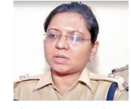
పోలీసులను మహారాష్ట్ర హోంశాఖ ఆదేశించింది. మరోవైపు 2020లో ఈ కుంభకోణం కేసును సిఐడీకి బదిలీ చేశారు. దీంతో 12 ఖ్యాంతులను మోసం చేసినందుకు ధిల్లీకి చెందిన కంపెనీ డైరెక్టర్లపై అవినీతి, మోసం కేసు నమోదైంది. అలాగే ఈ స్కామ్ పై దర్యాప్తులో ఫోర్టర్, తప్పుడు పత్రాలు సృష్టించడం వంటి నేరపూరిత కుట్రకు పాల్పడినట్లు ఆరోపణలపై బిపిఎస్ అధికారిణిపై కేసు నమోదు చేసినట్లు సిబిఐ గురువారం ప్రకటించింది. భారత్ శిక్షాస్థలిలోని 120-బి, 466, 474, 201 సెక్షన్లకు సంబంధించి ఆమెపై అభియోగాలు మోపినట్లు పేర్కొంది.

ముంబై, అక్టోబరు 17: భారీ కుంభకోణం కేసు దర్యాప్తులో ఫోర్టర్, నేరపూరిత కుట్రకు పాల్పడినట్లు బిపిఎస్ అధికారిణిపై ఆరోపణలు వచ్చాయి. సిఐడీ దర్యాప్తులో అదీ వెలుగు చూసింది. ఈ నేపథ్యంలో సెంట్రల్ బ్యూరో ఆఫ్ ఇన్వెస్టిగేషన్ (సిబిఐ) ఆమెపై కేసు నమోదు చేసింది. మహారాష్ట్రలోని జిల్లాలో ఉన్న టైపర్ ఓఫీస్ లోని రెస్టోరింగ్ కేసులో పాల్గొన్నారని. 1,200 కోట్ల కుంభకోణం వెలుగు చూసింది. ఫిక్స్ డిపాజిట్ పై అధికార పేరుతో వందలాది వ్యక్తులను ఆ సంస్థ మోసం చేసినట్లు ఆరోపణలు వచ్చాయి. కాగా, 2020 నుంచి 2022 వరకు అధిక నేరభాగం డిపాజిట్ ఉన్న బిపిఎస్ అధికారిణిపై కేసు నమోదు చేసింది. ఫిక్స్ డిపాజిట్ పై అధికార పేరుతో వందలాది వ్యక్తులను ఆ సంస్థ మోసం చేసినట్లు ఆరోపణలు వచ్చాయి. కాగా, 2020 నుంచి 2022 వరకు అధిక నేరభాగం డిపాజిట్ ఉన్న బిపిఎస్ అధికారిణిపై కేసు నమోదు చేసింది.