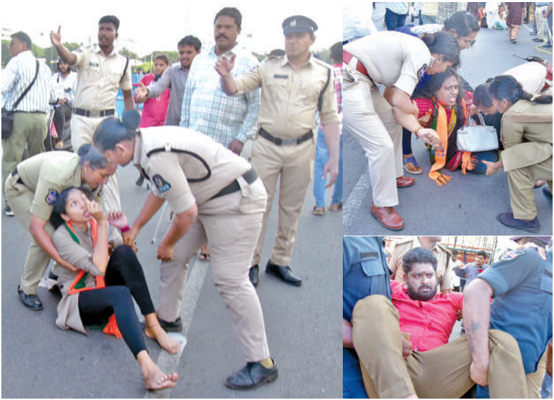
శనివారం హైదరాబాద్లో ఆందోళన చేస్తున్న విద్యార్థులను ఆరెస్టుచేసి తరలిస్తున్న పోలీసులు