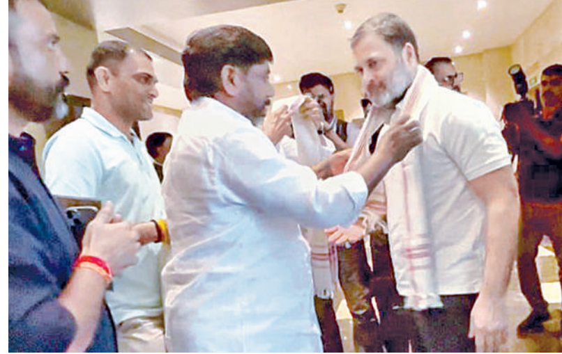
శనివారం రాంబిల్ కాంగ్రెస్ అగ్రనేత రామోజీ కండువా వేస్తున్న డి.సిఎం భట్టి