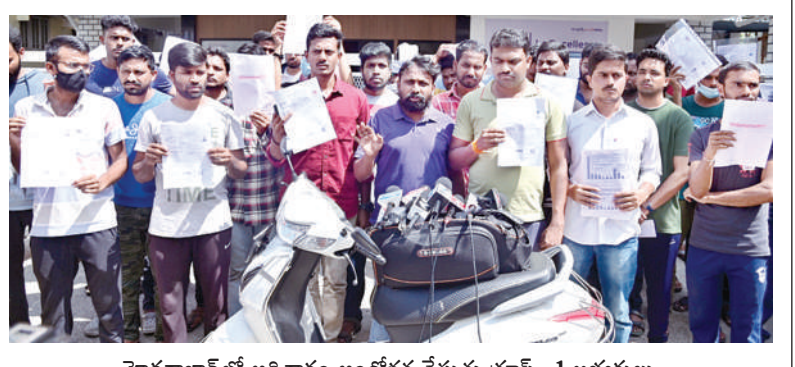
హైదరాబాద్ లో ఆదివారం ఆందోళన చేస్తున్న గ్రూప్ -1 అభ్యర్థులు

విద్యార్థులు ఇతర ప్రదేశాలకు వెళ్లినప్పుడు అక్కడే ఇన్వెస్ట్మెంట్, వ్యాపారవేత్తలు, ప్రజలతో తెలంగాణ, హైదరాబాద్ అభివృద్ధిపై చర్చించాలన్నారు. ఐఎన్ఐబిలో కలిసి పనిచేసేందుకు రాష్ట్ర ప్రభుత్వం చూస్తుందని, పెద్దమొత్తంలో వేతనాలు ఇవ్వలేకపోయినా, ఉత్తమ అవకాశాలను కల్పిస్తామని అన్నారు. తెలంగాణ దేశానికి అదర్బంగా నిలుపడమే తన లక్ష్యమని, తెలంగాణ ప్రజాకారులు ఒంటిపక్కలో గోల్డ్ మెడల్స్ సాధించడమే తన ధ్యేయమన్నారు.