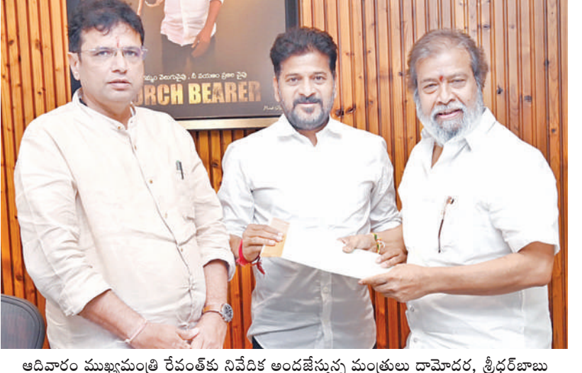
ఆదివారం ముఖ్యమంత్రి రేవంత్ కు నివేదిక అందజేస్తున్న మంత్రులు దామోదర, శ్రీధర్ బాబు