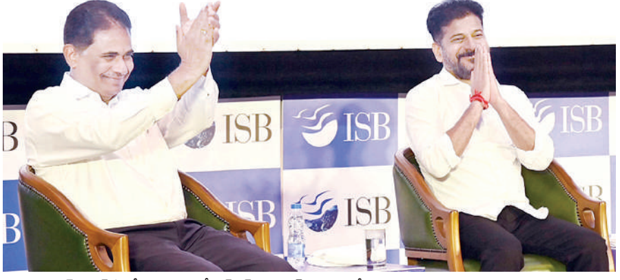
హైదరాబాద్ ఐఎన్ఐలో ఆదివారం లీడర్షిప్ సమ్మిట్-2024లో అభివారం చేస్తున్న ముఖ్యమంత్రి రేవంత్

హైదరాబాద్ (గల్ఫ్ బాలో), అక్టోబరు 20 ప్రభాతవార్త: తెలంగాణ రాష్ట్రాన్ని త్రిలియన్ డాలర్ ఎకానమిగా నిలుపడమే రాష్ట్ర ప్రభుత్వ లక్ష్యమని, ఈ లక్ష్యం సాధించాలంటే కీలకమైన హైదరాబాద్ నగరాన్ని 600బిలియన్ సిటీగా అభివృద్ధి చేయాల్సిన అవసరం ఉందని తెలంగాణ రాష్ట్ర ముఖ్యమంత్రి రేవంత్ రెడ్డి అన్నారు. జీవితంలో ఉన్నత లక్ష్యాలను చేరుకోవాలంటే కొంత రిస్క్ తీసుకోక తప్పదని, రిస్క్ తీసుకోకుండా లక్ష్యాలను చేరుకోలేమని అన్నారు. గల్ఫ్ బాలో లోని ఇండియన్ స్కూల్ ఆఫ్ బిజినెస్(ఐఎన్ఐబి)లో ఆదివారం నిర్వహించిన లీడర్షిప్ సమ్మిట్-2024లో ముఖ్యమంత్రి రేవంత్ రెడ్డి పాల్గొన్నారు. ఈ సందర్భంగా లీడర్షిప్ ఇన్ న్యూ ఇండియా అండ్ శంషై ముఖ్యమంత్రి ప్రసంగించారు. ఈ సందర్భంగా ఆయన మాట్లాడుతూ ఐఎన్ఐబి విద్యార్థులు తెలంగాణ ప్రాంతం అభివృద్ధిని,