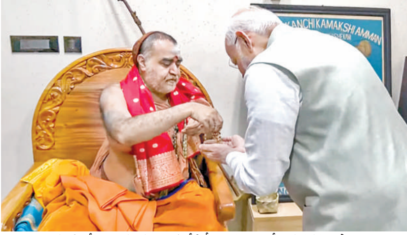
వారణాసిలో ఆదివారం కంచి కామోటి పీఠాధిపతి విజయేంద్ర సరస్వతి స్వామి ఆశీర్వాదం అందుకొంటున్న ప్రధాని మోడీ