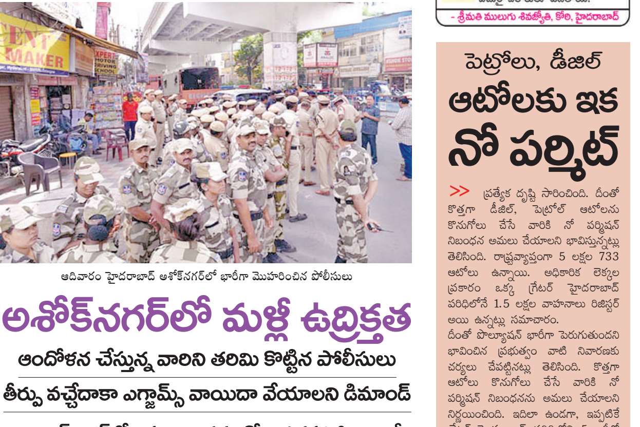
ఆదివారం హైదరాబాద్ అశోకనగర్లో భారీగా మొహరించిన పోలీసులు

అందోళన చేస్తున్న వారిని తలమ కొట్టిన పోలీసులు తీర్పు వచ్చేదాకా ఎగ్జామ్స్ వాయిదా వేయాలని డిమాండ్ లా అండ్ ఆర్గర్లలో విభలం కావడంతో చిక్కడపల్లి సిపి బదలీ