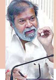
ఉత్తర్వులు జారీ చేసిన వైద్య, ఆరోగ్య శాఖ మంత్రి

హైదరాబాద్, అక్టోబరు 30, ప్రభాతవార్త: ప్రజల ఆరోగ్యానికి ముప్పు తెస్తున్న మయోనైజ్ ను ప్రభుత్వం నిషేధించింది. దీనికి సంబంధించి వైద్య, ఆరోగ్య శాఖ ఉత్తర్వులు జారీ చేసింది. ఈ మేరకు బుధవారం ఆరోగ్య శాఖ కార్యాలయంలో రాష్ట్ర వైద్య, ఆరోగ్యమంత్రి దామోదర రాజనర్సింహు ఫుడ్ సేఫ్టీ అధికారులతో సమావేశం నిర్వహించారు. అనంతరం మయోనైజ్ నిషేధం విధిస్తూ నిర్ణయం తీసుకున్నారు. రెండు రోజుల క్రితం హైదరాబాద్ నందీనగర్లో మోమోస్లో మయోనైజ్ తిని ఓ మహిళ మృతి చెందగా, మరో 20 మంది దాకా ఆసుపత్రుల పాలయ్యారు. అలాగే, నగరంలోని పలు ప్రముఖ రెస్టారెంట్లలో కూడా తరచూ ఇలాంటి ఘటనలు జరగడంతో వీటి తయారీపై ప్రభుత్వం >>2