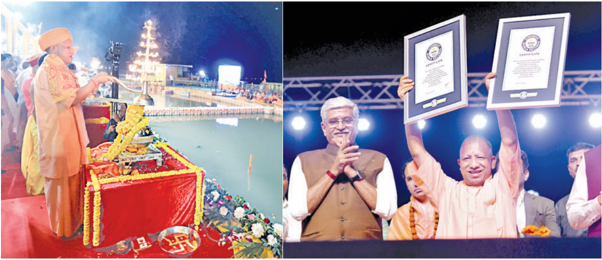
బుధవారం ఆమోద్యలో దీపం వెలిగించి కార్యక్రమాన్ని ప్రారంభిస్తున్న యుపి సిఎం | 28 లక్షల దీపాల గిన్నెస్ రికార్డు వ్రతాలను చూపుతున్న యోగి