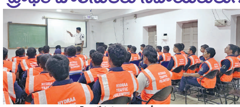
ట్రాఫిక్ విద్యుత్ పాల్గొన్న హైద్రా వలంటీర్లు శిక్షణ

హైదరాబాద్, అక్టోబరు 30. ప్రభాతవార్త: జంతు నగరాలు, శివార్లలో గణపిజిని చర్యలద్దెందుకు జక ముందు ట్రాఫిక్ పోలీసులకు తోడుగా హైద్రా వాలంటీర్లు సహాయం అందించనున్నారు. గ్రేటర్ పరిధిలోని కీలక జంక్షన్లలో