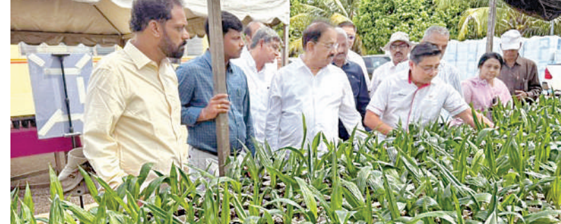
గెలలకు అధిక విలువను సృష్టించడానికి కావాల్సిన చర్యలు వివరాలతో తగిన సహాయ సహకారాలు అందించేందుకు సముఖంగా అందించిన వెల్లడించారు. అంతేకాకుండా మలేసియాలో పామాయిల్ గెలల కోతకు వాడుతున్న ఆధునాత పరికరాలను రాష్ట్రంలో కూడా రైతులకు అందుబాటులో తీసుకోవ్వ, తక్కువ ధరలకు సరఫరా చేయడం జరుగుతుందన్నారు. పామాయిలనే పరిశ్రమలో ఒక ఆరో మెరుగుపర్చడానికి, అత్యాధునిక సాంకేతికత, యంత్రాలను కొనుగోలు చేయడానికి, ఉత్పత్తులకు అదనపు విలువనిచ్చేందుకు యూనిట్లను తెలంగాణలో అయిల్ ఫెడ్ ద్వారా ఏర్పాటు చేయాలని అధికారులు ఆడిశించారు. పామాయిల్ గెలల ధరలు పెరిగిపోతూ కనీసం ఉన్నతం 20 వేల రూపాయలకు పైగా రైతులకు వచ్చేలా చర్యలు తీసుకోవాలని మంత్రి తుమ్మల సూచించారు.

హైదరాబాద్, అక్టోబరు 30. ప్రభాతవార్త: రాష్ట్రంలో వ్యవసాయ రంగానికి అత్యధిక ప్రాధాన్యతతో పాటు, రైతుల సంక్షేమం, అభివృద్ధి కోసం కోట్ల రూపాయల వ్యయంతో వివిధ పథకాలను అమలు చేస్తోంది వ్యవసాయ మంత్రి తుమ్మల నాగేశ్వరరావు చెప్పారు. ఈ నేపథ్యంలోనే రాష్ట్రంలో పామాయిల్ సాగు విస్తరణకు ప్రభుత్వం కృషి చేస్తోందన్నారు. ఇందులో భాగంగా పామాయిల్ ఉత్పత్తిలో స్వయం సమృద్ధి సాధించేందుకు మలేసియా తరహా విధానాలను అవలంబించనున్నట్లు బుధవారం ఒక ప్రస