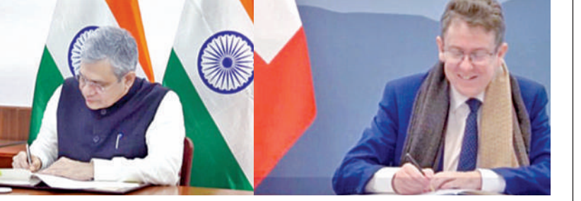
రైల్వే సాంకేతికతపై భారత్-స్విస్ మధ్య కుదిరిన ఒప్పందంపై సంతకాలు చేస్తున్న రైల్వే మంత్రి

గుంతకల రైల్వే, అక్టోబరు 30, ప్రభాతవార్త: ప్రపంచంలో దినదినాభివృద్ధి చెందుతున్న ఆర్థికాధునిక యాంత్రిక, సాంకేతిక పరిష్కారాన్ని భారత్ దేశం, స్విట్జర్లాండ్ దేశాలు పరస్పరం సహకరించుకుంటూ పెంపొందించుకుంటున్న ఒప్పందాన్ని కుదుర్చుకున్నాయి. భారత్ రైల్వే శాఖ మంత్రి అశ్వినీ వైష్ణవ్, స్విట్జర్లాండ్ రవాణా శాఖ మంత్రి లెన్జ్ ఫెడరల్ కౌన్సిలర్ అల్బర్ట్ రోస్టల్ అధ్యక్షతన మధ్య సహకార ఒప్పందం రవాణా రంగాలో జరిగిన సమావేశంలో యాంత్రిక, సాంకేతిక పరిష్కారాన్ని పరస్పరం సహకరించుకుంటూ సూక్ష్మ ప్రాయంగా అంగీకరించి పెంపొందించడానికి జరిగిన అవగాహన ఒప్పందంపై సంతకాలు చేశారు. ఇందులో భాగంగా ఉభయ దేశాల రైల్వే ప్రతినిధుల మధ్య తమ సంపూర్ణ సహకారాలను సులభతరం చేయడానికి జాయింట్ పర్మిట్ గ్రూప్ (జెడబ్ల్యుజీ)ను ఏర్పాటు చేశారు. ఈ సందర్భంగా రైల్వే మంత్రి అశ్వినీ వైష్ణవ్ మాట్లాడుతూ సరకు రవాణా ప్రయోజనాల బోగోలు, రైల్వే విద్యుద్దీకరణ సామాగ్రి, రైల్వే స్టేషన్ లో ఆధునికీకరణ, సారంగాల (ఎన్ఐఎం) టెక్నాలజీ, రైలు మార్గాల >>2