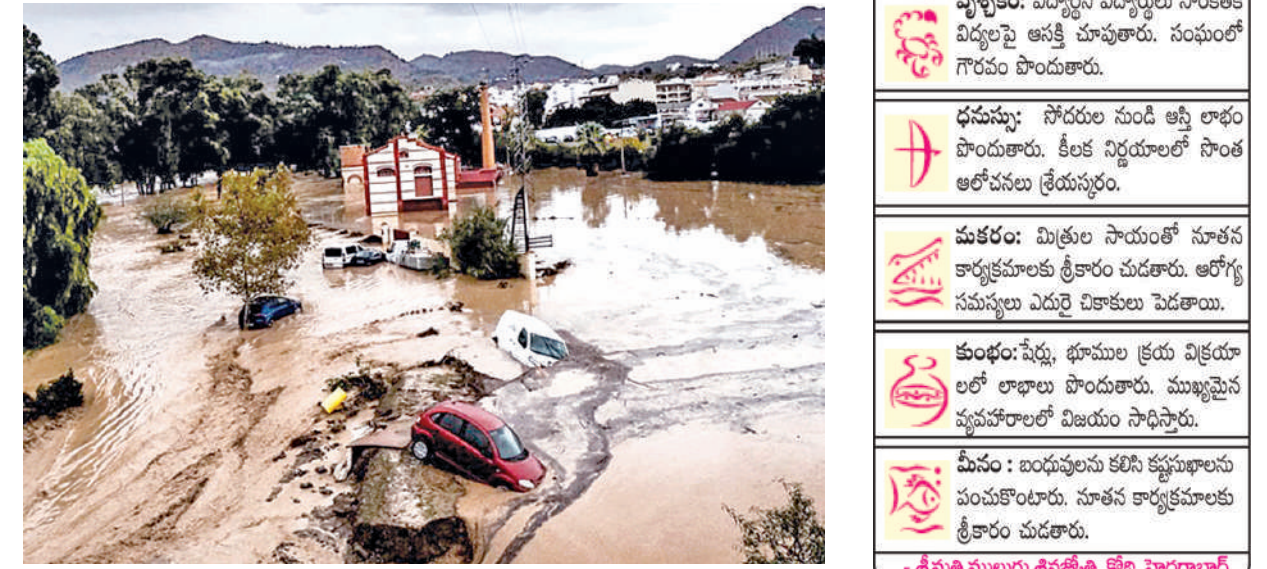
స్పెయిన్ లోని అలోరా, మలగ పట్టణాల్లో భారీ వరదలకు కొట్టుకుపోయిన కార్లు