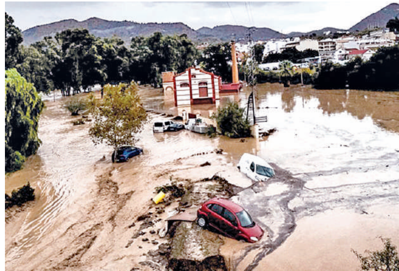
స్కూల్ లోని అలోరా, మలగ పట్టణాల్లో భారీ వరదలకు కొట్టుకుపోయిన కార్లు