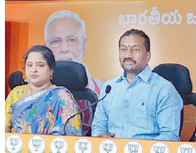
హైదరాబాద్, అక్టోబరు 30 ప్రభాతవార్త: గ్రామపంచాయతీ లను రాష్ట్ర ప్రభుత్వం నిర్వహించేందుకు మండ్రి వందల కోట్ల రుపాయలను కేంద్రం అందజేసింది. గ్రామపంచాయతీల్లో విద్యుత్ బిల్లులు చెల్లించలేని పరిస్థితి ఉందని న్యాయం చేసిన మీడియా సమావేశంలో మాట్లాడారు. కేంద్ర ప్రభుత్వం మహాత్మాగాంధీ గ్రామీణ ఉపాధి హామీ పథకం కింద రూ.1200కోట్ల విడుదల చేస్తే, రాష్ట్ర ప్రభుత్వం కేవలం రూ.200కోట్లు మాత్రమే ఖర్చు చేస్తుందన్నారు. మిగిలిన రూ.1000కోట్ల నిధులను కేవలం రెడ్డి

సర్కారు ఇతర కార్యకలాపాలకు దారి మళ్లించిందని ఆరోపించారు. గ్రామపంచాయతీల్లో విద్యుత్ బిల్లులు చెల్లించలేని పరిస్థితి ఉందని న్యాయం చేసిన మీడియా సమావేశంలో మాట్లాడారు. కేంద్ర ప్రభుత్వం మహాత్మాగాంధీ గ్రామీణ ఉపాధి హామీ పథకం కింద రూ.1200కోట్ల విడుదల చేస్తే, రాష్ట్ర ప్రభుత్వం కేవలం రూ.200కోట్లు మాత్రమే ఖర్చు చేస్తుందన్నారు. మిగిలిన రూ.1000కోట్ల నిధులను కేవలం రెడ్డి