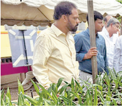
గెలలకు అధిక విలువను సృష్టించడానికి కావాల్సిన చర్యలు వివరాలు తెలిపారు.

హైదరాబాద్, అక్టోబరు 30. ప్రభాతవార్త: రాష్ట్రంలో వ్యవసాయ రంగానికి అత్యధిక ప్రాధాన్యతతో పాటు, రైతుల సంక్షేమం, అభివృద్ధి కోసం కోట్ల రూపాయల వ్యయంతో వివిధ పథకాలను అమలు చేస్తోంది వ్యవసాయ మంత్రి తుమ్మల నాగేశ్వరరావు చెప్పారు. ఈ నేపథ్యంలోనే రాష్ట్రంలో పామాయిల్ సాగు విస్తరణకు ప్రభుత్వం కృషి చేస్తోందన్నారు. ఇందులో భాగంగా పామాయిల్ ఉత్పత్తిలో స్వయం సమృద్ధి సాధించేందుకు మలేసియా తరహా విధానాలను అమలుచేస్తున్నట్లు బుధవారం ఒక ప్రకటనలో వెల్లడించారు. దీనికి సంబంధించి ఇటీవల