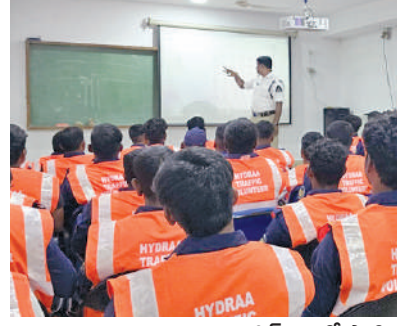
ట్రాఫిక్ విభాగం పాల్గొన్న హైద్రా వలంటీర్లకు శిక్షణ

హైదరాబాద్, అక్టోబరు 30. ప్రభాతవార్త: జంతు నగరాలు, శివార్లలో గతబిజినీ చర్యలద్వారా జన ముందు ట్రాఫిక్ పోలీసులకు తోడుగా హైద్రా వాలంటీర్లు సహాయం అందించుకున్నారు. గ్రేటర్ పరిధిలోని కీలక జంక్షన్లలో హైద్రా వాలంటీర్లు ట్రాఫిక్ విభాగం పాల్గొంటారు. ఇందుకు సంబంధించి మొదటి విడతగా 50 మంది వాలంటీర్లను హైద్రా డిఆర్ఎఫ్ ఎంపిక చేసి శిక్షణ కూడా ఇచ్చింది. వీరింతా శనివారం వసూలు, గ్రేటర్ పరిధిలోని కీలక జంక్షన్లలో హైద్రా వాలంటీర్లు ట్రాఫిక్ విభాగం పాల్గొంటారు. ఇందుకు సంబంధించి మొదటి విడతగా 50 మంది వాలంటీర్లను హైద్రా డిఆర్ఎఫ్ ఎంపిక చేసి శిక్షణ కూడా ఇచ్చింది. వీరింతా శనివారం వసూలు, గ్రేటర్ పరిధిలోని కీలక జంక్షన్లలో హైద్రా వాలంటీర్లు ట్రాఫిక్ విభాగం పాల్గొంటారు.