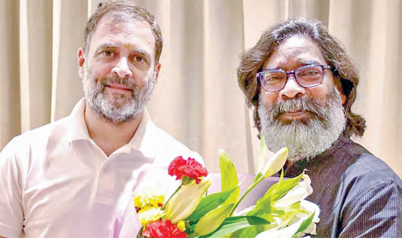
రాం.చి, అక్టోబరు 19: ఇండియా కూటమి పార్టీలు జార్జియా అసెంబ్లీ ఎన్నికల్లో సమష్టిగా పోటీచేసి గెలుపాలని నిర్ణయించాయి. ముఖ్యమంత్రి హేమంత్ సారే ఈ మేరకు కూటమి అధ్యక్షులతో సీట్ల పంపకాలను ఖాయచేసినట్లు తెలిపారు. మొత్తం 81 అసెంబ్లీ స్థానాలకుగానూ జార్జియా ముఖ్యమంత్రి 70 మంది అభ్యర్థులను పోటీకి దింపవలసిందిగా, సీట్ల పంపకాలపై సభ్యాపరంగా ఇప్పటికే ఒప్పందం చేసుకోవాలని, మా కూటమి భాగస్వామి ఇప్పుడు మాతో లేనందున

సారే మళ్లీ సింహ కావాలన్న లక్ష్యంతో వ్యూహాలు మూల్యమే పోటీచేయనున్నట్లు తెలిపింది. జైఎంఆర్ తాను పోటీచేసే స్థానాలను పెంచుకోవాలని బలంగా విశ్వసిస్తున్నారని. మహాకూటమి అయినప్పటికీ ప్రచారంవేస్తే ఓటంబాంతుకు కూడా భారీగా పెరుగుతుందని చెబుతున్నారు. సింహింకా ఎంతో మార్పు ఉన్న కోఆర్డినేషన్ కమిటీ కూడా ఈ సారి జైఎంఆర్ తో చేతులు కలుపుతోంది. కాంగ్రెస్ జైఎంఆర్, సింహింకా ఎంతో కలిసి పోటీకి వస్తున్నాయి. అక్టోబర్ 1 ఏడునాల్గో గత అసెంబ్లీ ఎన్నికల్లో పోటీచేస్తే ఈ సారి కొద్దిస్థానాలకే పరిమితం అవుతుంది. బాగ్దాద్ స్థానాన్ని సింహింకా ఎంతో, నిరాస్న స్థానం ఎంపీలకి ఇచ్చేందుకు అంగీకరించినట్లు సమాచారం. ఒకక్క ఎన్నియే కూటమి ఇప్పటికే సీట్ల సర్దుబాటుచేసుకుంది. బిజెపి 68 స్థానాలు, మిత్రపక్షాలు అజేతూ 10 స్థానాలు, జనతాదళ్ యువైడీపీ రెండు, ఎల్డీఎం ఛాత్రాస్థానంనుంచి పోటీచేయాలని నిర్ణయించారు. అమరునటిరోజే శనివారం జైఎంఆర్ కూటమి సీట్ల పంపకాలను ఒక కొలిక్కి తెచ్చుకోవడం విశేషం. నాలుగుపార్టీలు ఒక్కటిగా వచ్చి పోటీచేయడం జార్జియా చరిత్రలో