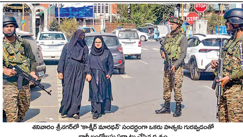
శనివారం శ్రీనగర్లో 'కాశ్మీరీ మారఫాట్' సందర్భంగా ఒకరు హత్యకు గురవుడంతో భారీ బందోబస్తు ఏర్పాటు చేసిన దృశ్యం

సారే మళ్లీ సింహ కావాలన్న లక్ష్యంతో వ్యూహాలు మూల్యమే పోటీచేయనున్నట్లు తెలిపింది. జైఎంఆర్ తాను పోటీచేసే స్థానాలను పెంచుకోవాలని బలంగా విశ్వసిస్తున్నారని. మహాకూటమి అయినప్పటికీ ప్రచారంవేస్తే ఓటంబాంతుకు కూడా భారీగా పెరుగుతుందని చెబుతున్నారు. సింహింకా ఎంతో మార్పు ఉన్న కోఆర్డినేషన్ కమిటీ కూడా ఈ సారి జైఎంఆర్ తో చేతులు కలుపుతోంది. కాంగ్రెస్ జైఎంఆర్, సింహింకా ఎంతో కలిసి పోటీకి వస్తున్నాయి. అక్టోబర్ 1 ఏడునాల్గో గత అసెంబ్లీ ఎన్నికల్లో పోటీచేస్తే ఈ సారి కొద్దిస్థానాలకే పరిమితం అవుతుంది. బాగ్దాద్ స్థానాన్ని సింహింకా ఎంతో, నిరాస్న స్థానం ఎంపీలకి ఇచ్చేందుకు అంగీకరించినట్లు సమాచారం. ఒకక్క ఎన్నియే కూటమి ఇప్పటికే సీట్ల సర్దుబాటుచేసుకుంది. బిజెపి 68 స్థానాలు, మిత్రపక్షాలు అజేతూ 10 స్థానాలు, జనతాదళ్ యువైడీపీ రెండు, ఎల్డీఎం ఛాత్రాస్థానంనుంచి పోటీచేయాలని నిర్ణయించారు. అమరునటిరోజే శనివారం జైఎంఆర్ కూటమి సీట్ల పంపకాలను ఒక కొలిక్కి తెచ్చుకోవడం విశేషం. నాలుగుపార్టీలు ఒక్కటిగా వచ్చి పోటీచేయడం జార్జియా చరిత్రలో