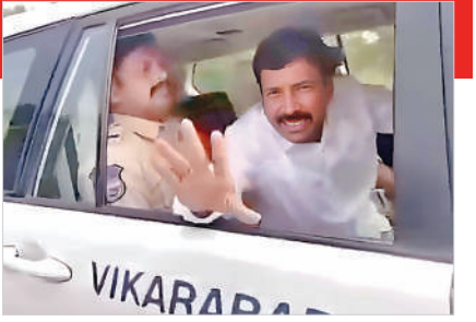
పట్నం నరేందర్ రెడ్డిని తరలిస్తున్న పోలీసులు

కొడంగల్, నవంబర్ 13 ప్రభాతవార్త: వికారాబాద్ జిల్లా కొడంగల్ నియోజకవర్గం దువ్వాల మండలంలోని లగచర్ల గ్రామంలో రెండు రోజుల క్రితం ఘాతానికి గురియైన పట్నం పట్టణం పేరు ప్రఖ్యాతిచెందిన సేకరణకు వెళ్లిన జిల్లా కలెక్టర్ ప్రతీక్ జైన్, అదనపు కలెక్టర్ లింగాయ్య, కనా ప్రత్యేకాధికారి వెంకటేశ్వర్లు తదితర అధికారులపై దాడికి పాల్పడిన సంఘటన తెలిసింది. సీరియస్ సీరియస్ తీసుకున్న ప్రభుత్వం 55 మంది అదుపులోకి తీసుకొని విచారించగా 16 మంది గ్రామస్థులను నిందితులుగా గుర్తించి 39 మందిని వదిలిపెట్టారు. 15 మంది నిందితులను మంగళవారం రాత్రి 12 గంటల ప్రాంతంలో కొడంగల్ కోర్టులో న్యాయ మూర్తి ఎదుట హాజరుపరచగా న్యాయమూర్తి ఆదేశాలతో వారిని పోలీసులు రిమాండ్ కు తరలించారు. సంఘటనలో మిగతావారిని బుధవారం అదుపులోకి తీసుకొని కొడంగల్ కోర్టులో హాజరుపరచారు. అందులో కొడంగల్ మాజీ ఎమ్మెల్యే పట్నం నరేందర్ రెడ్డిని బుధవారం హైదరాబాద్ లో అదుపులోకి >>2