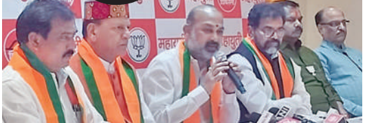
హైదరాబాద్, నవంబరు 13 ప్రభాతవార్త: తెలంగాణలో కమీషన్ పాలన కొనసాగుతోందని కేంద్ర హోంశాఖ సహాయ మంత్రి బండి సంజయ్ కుమార్ అన్నారు.

తెలంగాణ పైసలన్నీ మహారాష్ట్రలో ఖర్చు చేస్తున్నారు కులగణన పేరుతో ప్రజల ఆస్తిపాస్తులపై కన్నేశారు కేంద్ర హోంశాఖ సహాయ మంత్రి బండి సంజయ్ కుమార్ హైదరాబాద్, నవంబరు 13 ప్రభాతవార్త: తెలంగాణలో కమీషన్ పాలన కొనసాగుతోందని కేంద్ర హోంశాఖ సహాయ మంత్రి బండి సంజయ్ కుమార్ అన్నారు. ప్రతి పనిలోనూ, కాంట్రాక్టులోనూ 15 శాతం కమీషన్ తీసుకుంటూ తెలంగాణను లూటీ చేస్తున్నారని ఆరోపించారు. బుధవారం నాగపూర్ లోని ఆర్ఎస్ఎస్ ప్రధాన కార్యాలయాన్ని కేంద్ర హోంశాఖ సహాయ మంత్రి బండి సంజయ్ కుమార్ సందర్శించారు. ఆర్ఎస్ఎస్ వ్యవస్థాపకులు కేపీ బలిరాం హెడ్ క్వార్టర్స్ సౌకర్యాలను సందర్శించి ఘన సవాళి అర్పించారు. తెలంగాణ ప్రజలకిచ్చిన ఏ ఒక్క హామీని కూడా