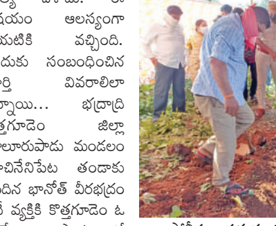
పోలీసుల సమక్షంలో మృతదేహాన్ని బయటికి తీస్తున్న దృశ్యం.

కొత్తగూడెం, నవంబరు 13, ప్రభుత్వం: అతనితోనే తనకు జీవితం... అతనితోనే తనకు సంతోషం.. సుఖం అనుకోని తనకుంటే ఎక్కడా సమ్మతి ఉన్నట్లు ప్రయోగించిన ప్రయోగం గొంతుకోశాడు ఓ దుర్మార్గుడు. తనకు కడతా తోడుంటాడని అనుకోని నమ్మిన ఆ ప్రయోగానికి కడతేర్చేశాడు. ఏం జరిగిందో ఏమా తెలియదు... అసలు కారణాలు కూడా ఇంకా తెలియలేదని కానీ ప్రయోగం ప్రయోగించి పాత్రుడై సీనియర్ పోలీసులు తనతో ఇన్ని రోజులు కలిసి తిరిగింది అనే అభిమానం కూడా లేకుండా ఆ తిరుగుబాటు