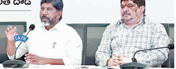
బుధవారం సచివాలయంలో మీడియాతో డి.సి.ఎం భట్టి, చిత్రంలో మంత్రి పొన్నం