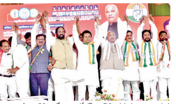
అమలులోకి 50 వేల టీ.ఎం. చెల్లించనున్నట్లు ఆయన ప్రకటించారు. మహారాష్ట్రకు చెందిన మహావీరలు ఛత్రపతి శివాజీ మహారాజ్, మహాత్మా జావహర్ లాల్ నెహ్రూ, రాజ్యాంగ నిర్మాత డాక్టర్ బాబాసాహెబ్ అంబేద్కర్ ల వారసత్వం కొనసాగిస్తామని మంత్రి ఉత్తమ్ కుమార్ రెడ్డి పేర్కొన్నారు.