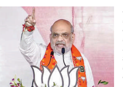
జగ్గడ ఐదు హామీలను వెంటనే తీసుకొస్తామన్నారు. భారతీయ జనతా రాజకీయాలకు తెర లేపిందని దానిని తిప్పి కొట్టేందుకు మహారాష్ట్ర ప్రజలు సన్నద్ధం కావాలని ఆయన పిలుపునిచ్చారు. రైతులకు మూడు లక్షల రుణమూఫీ చెయ్యడంతో పాటు సకాలంలో రుణాలు చెల్లించిన వారికి

పట్టణ/జలాగండ్/హాల్, నవంబరు 13: దివంగత ప్రధానమంత్రి ఇందిరాగాంధీ సర్వంనుంచి దిగి వచ్చినా కూడా జమ్మికాశీకీరు సంబంధించి 370వ అధికరణాన్ని తిరిగి పునరుద్ధరించలేరని కేంద్ర హోంమంత్రి అమిత్ షా వెల్లడించారు. బిజెపి స్టార్ క్యాంపెయిన్ గా ఉన్న అమిత్ షా ముస్లిం రిజర్వేషన్లపరంగా కాంగ్రెస్ చేస్తున్న విమర్శలకు చెకెపెట్టారు. ప్రధాన ప్రతిపక్ష పార్టీ ఏకైకతరబడి ఆయోధ్యలో రామమందిరం నిర్మాణాన్ని కావాలనే జాప్యంపేసిందని దుయ్యబట్టారు. మహారాష్ట్ర ఎన్నికలకు కొద్దిరోజులు మాత్రమే గడువు ఉండటంతో మహాయుతి తరపున ప్రచారాన్ని అమిత్ షా ఉద్బుతంచేసారు.