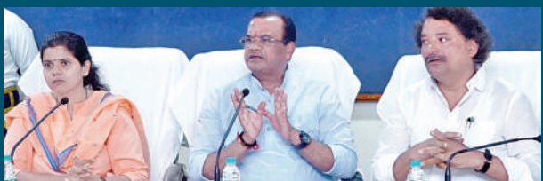
నల్గొండ ప్రతినధి ప్రభాతవార్త నవంబర్ 13: ధాన్యం సేకరణపై బుధవారం ఆయన నల్గొండ కలెక్టర్ కార్యాలయంలో రైస్ మిల్లర్లు, పౌరసరఫరాలు, వ్యవసాయ, మార్కెటింగ్ తదితర శాఖల అధికారులతో సమీక్ష నిర్వహించారు.

రైతులు తెచ్చింది తెచ్చినట్లుగా కొనుగోలు చేయాలని మిల్లర్లకు సూచించిన మంత్రి కోమటిరెడ్డి రైతులు, ప్రభుత్వానికి మిల్లర్లు సహకరించాలి జాప్యం లేకుండా చెల్లింపులు జరపాలి: మంత్రి నల్గొండ ప్రతినధి ప్రభాతవార్త నవంబర్ 13: ధాన్యం సేకరణపై బుధవారం ఆయన నల్గొండ కలెక్టర్ కార్యాలయంలో రైస్ మిల్లర్లు, పౌరసరఫరాలు, వ్యవసాయ, మార్కెటింగ్ తదితర శాఖల అధికారులతో సమీక్ష నిర్వహించారు. మిల్లర్లు ప్రతిరోజూ మిల్లలకు వచ్చిన ధాన్యాన్ని వచ్చినట్లు కొనుగోలు చేయాలని, మిల్లర్లకు ప్రభుత్వం తరఫున అవసరమైన పూర్తి సహాయం, సహకారాలు ఇస్తామని తెలిపారు. రైతులు ఇబ్బందులు పడకుండా పూర్తిగా సహాయం సహకారాలు అందించి రైతుల ధాన్యాన్ని కొనుగోలు చేయాలన్నారు. ఇతర రాష్ట్రాల్లో