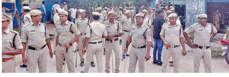
బుధవారం కొడంగల్ కోర్టు వద్ద పోలీసుల భారీ బందోబస్తు దృశ్యం

లగచర్ల దాడి కేసులో ఎ1గా కొడంగల్ మాజీ ఎమ్మెల్యే హైదరాబాద్ లో అదుపులోకి తీసుకొని, కొడంగల్ కోర్టులో హాజరుపరచిన పోలీసులు ఆయనతో పాటు మరో నలుగురుకి కూడా రిమాండ్ కొడంగల్ కోర్టు వద్ద ఉద్రిక్తత, భారీ బందోబస్తు