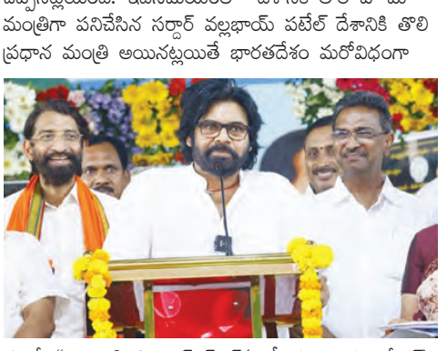
పుండ్రెంట్ అని బిజెపి, ఆర్ఎంఎస్(రాష్ట్రీయ స్వయం సేవక్) అభిమానులు తరచూ వ్యాఖ్యానిస్తుంటారు. ఇదేతరహాలో "నేను హోమ్ మంత్రినైతే రాష్ట్రంలో పరిస్థితులు ఈ విధంగా వుండేవి కావు" అని పవన్ కళ్యాణ్ వ్యాఖ్యానించడంలో తెలుగుదేశం పార్టీలో అందరిలో అర్థం అవుతోంది. రెండో కోణం విషయానికి వస్తే ముఖ్యమంత్రిని చంపుతానని బెదిరించినవారిపై చర్యకు భయమెందుకు? పార్టీ కార్యాలయాలపై దాడులు చేసినవారిపై చర్యకు మినమేషాలు లెక్కలే వుంది. అటు తెలుగుదేశం పార్టీలో చంద్రబాబు నాయుడు సామాజిక వర్గానికి చెందిన వైఎస్ఆర్ కాంగ్రెస్ పార్టీ నేతలు (మంత్రులు సైతం), ఇటు పవన్ కళ్యాణ్ కు సామాజిక వర్గానికి చెందిన వైఎస్ఆర్ కాంగ్రెస్ పార్టీ నేతలు(మంత్రులు).

ప్రత్యేకతను చాటుకోవాలని భావిస్తున్నారా? బిజెపిలోకూడీ మంత్రినవుతాను, ఉత్తరప్రదేశ్ ముఖ్యమంత్రి అదిత్యనాథ్ మాదిరిగా వ్యవహరిస్తాను' అని అనడంలో బిజెపి ప్రభావం వుందనే భావన ప్రజలలో కలుగుతోంది. ఒకే దెబ్బకురెండు పిట్టలు అన్నట్లుగా ఒకేసారి వ్యక్తిగతంగా తన పార్టీ జనసేన ప్రతిష్ఠను, బిజెపి నేత అదిత్యనాథ్ పేరు ప్రస్తావించడం ద్వారా అటు భారతీయ జనతాపార్టీ గొప్పతనాన్ని చాటి చెప్పినట్లుంది. ఇదేసమయంలో "దేశానికి తొలి హోమ్ మంత్రిగా పనిచేసిన సర్దార్ వల్లభభాయి పటేల్ దేశానికి తొలి ప్రధాన మంత్రి అయినట్లు అదిత్యనాథ్ భారతదేశం మరోవిధంగా