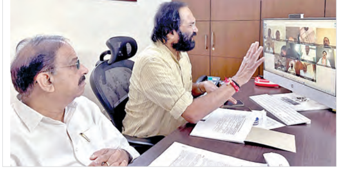
మంగళవారం హైదరాబాద్ లో విడియో కాన్ఫరెన్స్ లో మంత్రులు ఉత్తమ్, తుమ్మల

హైదరాబాద్, నవంబరు 5, ప్రభాతవార్త: రాష్ట్రంలో ధాన్యం సేకరణ విజయవంతం చేయాలని జనవరి 2025 నుంచి రేషన్ కార్డుల ద్వారా లబ్ధిదారులకు సన్నబియ్యం పంపిణీ చేస్తామని ప్రజాప్రతినిధులను పౌరసరఫరాలశాఖ మంత్రి మంత్రి ఉత్తమ్ కుమార్ రెడ్డి కోరారు. సన్నధాన్యం క్రియం టాలకు రూ.500 ఇవ్వడం వారితోపాటు కార్డులకు అని ఉత్తమ్ అన్నారు. ధాన్యం సేకరణలో సంబంధిత అధికారులు అప్రమత్తంగా ఉండాలని ఆయన అన్నారు. గండర గోళం ఉత్పన్నం కాకుండా చూడాలని ఆయన కోరారు. యావత్ భారత దేశంలోనే రికార్డ్ స్థాయిలో ధాన్యం దిగుబడి వచ్చిన సందర్భం ముందెన్నడూ లేదని ఆయన స్పష్టం చేశారు. ధాన్యం కొనుగోళ్లను రాష్ట్ర ప్రభుత్వం ప్రతిష్టాత్మకంగా తీసుకుందని ఇందుకు ప్రతి ఒక్కరు సహకరించాలని ఆయన కోరారు. మంగళవారం జలసౌధలో ఉత్తమ్ ఓపిడీయో కాన్ఫరెన్స్ నిర్వహించారు. ఈ కాన్ఫరెన్స్ లో ఉప ముఖ్యమంత్రి మల్ల భట్టి విక్రమరాజు, మంత్రులు కోమటిరెడ్డి వెంకట్ రెడ్డి, పొన్నం ప్రభాకర్, తుమ్మల నాగేశ్వరరావు రావు, ఎంపీలు, ఎమ్మెల్యేలు పాల్గొన్నారు. ఈ సందర్భంగా మంత్రి ఉత్తమ్ కుమార్ రెడ్డి మాట్లాడుతూ 150 లక్షల ధాన్యం దిగుబడి ఉండవచ్చని ప్రభుత్వం అంచనా వేస్తుందన్నారు. 60.80 లక్షల ఎకరాలలో ప్రభుత్వం అంచనా వేస్తున్న దిగుబడిలో 91 లక్షల మెట్రిక్ టన్నులు