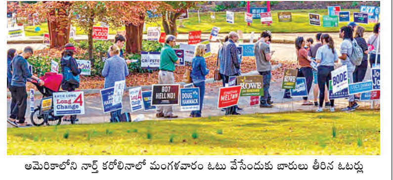
అమెరికాలోని నార్త్ కరోలినాలో మంగళవారం ఓటు వేసేందుకు భారాలు తీసిన ఓటుదారులు

వాషింగ్టన్, నవంబర్ 5: అమెరికాలో అధ్యక్ష ఎన్నికల పోలింగ్ ప్రక్రియ మొదలైంది. అధ్యక్ష పదవికి డెమోక్రటిక్ అభ్యర్థి కమలా హారిస్, రిపబ్లికన్ అభ్యర్థి డొనాల్డ్ ట్రంప్ పోటీపడుతున్నారు. నవంబర్ మంగళవారం మొదలైన కొన్ని గంటలకే అక్కడి ఓటింగ్ కేంద్రాలలో కొంతమంది ప్రజలు అధ్యక్ష ఎన్నికల అమెరికా కాలమానం ప్రకారం మంగళవారం ఉదయం ప్రారంభం కానుండగా ఆయా రాష్ట్రాల్లో పోలింగ్ సమయాలు వేర్వేరుగా ఉన్నాయి. అమెరికాలో వివిధ కాలమానాల ప్రకారం కొన్ని రాష్ట్రాల్లో ఉదయం ఆరు గంటలకు, మరికొన్ని రాష్ట్రాల్లో ఏడు, ఎనిమిది గంటలకు పోలింగ్ ప్రక్రియ మొదలవుతుంది. న్యూయార్క్ లో రాష్ట్రంలో ఉదయం ఆరు గంటలకు పోలింగ్ ప్రారంభం కాగా డిక్లెయిర్డ్ నాట్ ప్రాంతంలో మాత్రం అతి తక్కువ ఓట్లు ఉండటంతో నవంబర్ 5వ తేదీలోకి అడుగుపెట్టిన కొన్ని గంటలకే పోలింగ్ నిర్వహించి పోలింగ్ కూడా పూర్తి చేశారు. మొత్తం 16.14 కోట్ల మంది ఓటుదారులు ఉన్న అమెరికాలో పోలింగ్ చేసే ఉదయం 1:30 వరకు కొనసాగునుంది. డెక్లెయిర్డ్ అయిన రాష్ట్రాల్లో పోలింగ్ ముగిసిన వెంటనే ఓట్ల లెక్కింపు చేపడతారు. తుది ఫలితాలు వచ్చేందుకు కొన్ని >>2