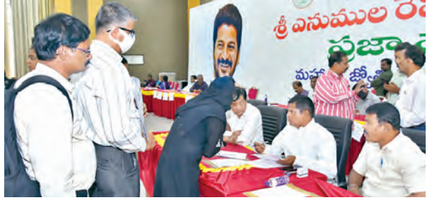
ప్రజావాణికి వచ్చిన ప్రజల నుంచి సమస్యలు తెలుసుకుంటున్న రాష్ట్ర ప్రజావాణి సంఘం వైస్ చైర్మన్ డా.విన్నారెడ్డి

హైదరాబాద్, నవంబరు 5, ప్రభాతవార్త : వ్యవసాయ మహిళా విస్తరణ అధికారులకు అండగా ఉంటామని రాష్ట్ర మహిళా కమిషన్ చైర్మన్ సేరెళ్ల శారద భరోసా ఇచ్చారు. వారి సమస్యలను ప్రభుత్వం దృష్టికి తీసుకెళ్లి, వాటిని పరిష్కరించే దిశగా వ్యవసాయ మహిళా విస్తరణ మహిళా కమిషన్ కార్యాలయంలో మంగళవారం చైర్మన్ శారదతో వ్యవసాయ మహిళా విస్తరణ అధికారులు భేటీ అయ్యారు. ప్రధానంగా డిజిటల్ ట్రాన్స్ సర్వేలో తాము ఎదుర్కొంటున్న సమస్యలను గూర్చి విస్తరణ అధికారుల కమిషన్ దృష్టికి తీసుకెళ్లారు. మహిళా విస్తరణ అధికారులకు అండగా ఉంటామంటూ వినతి పత్రం సమర్పించారు. ఈ సందర్భంగా కమిషన్ చైర్మన్ వారికి న్యాయం చేస్తామన్నారు. డిజిటల్ సర్వే తదితర విధి నిర్వహణలో విస్తరణ అధికారులు ఎదుర్కొంటున్న సమస్యలపై ప్రభుత్వంతో సంప్రదించానని చెప్పారు.