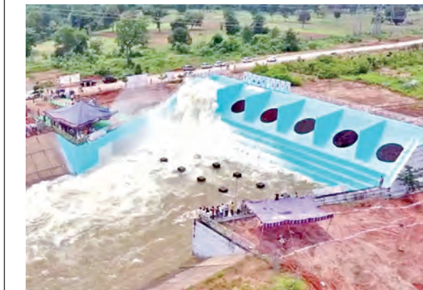
హైదరాబాద్, నవంబరు 5, ప్రభాతవార్త: శ్రీపాద ఎల్లంపల్లి ప్రాజెక్టు అనుభవాల సీతారామ ప్రాజెక్టు డిప్యూటింగ్ ఇతర పనులకు పరిపాలన అనుమతులు లేకుండా టెండర్ ప్రక్రియ నిర్వహించడానికి ఐఓసిపి అధికారులు తడబాటు పడుతున్నారు. కాళేశ్వరం లిఫ్ట్ ఐఓసిపి లో భాగమైన మేడిగడ్డ కుంగడాలుతోపాటు అన్నారం, సుందిళ్ళి టాకేట్ల వైఫల్యంపై జరుగు