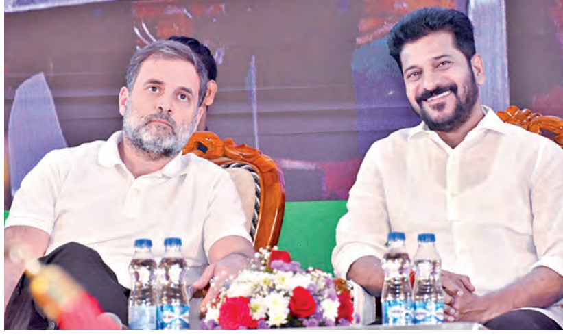
మంగళవారం హైదరాబాద్ లో కులగణన సంప్రదింపుల వేదికలో కాంగ్రెస్ అగ్రనేత రాహుల్, సిఎం రేవంత్

దేశాభివృద్ధికి అడ్డుగా ఉన్న కులవివక్ష జనాభాకు అనుగుణంగా వనరుల పంపిణీ లక్ష్యవ్యూహంపై 50% పరిమితి తొలగిస్తూ అసమానతలు తొలగించేందుకు చర్యలు గణనలో దేశానికే మార్గదర్శకంగా తెలంగాణ మేధోమథనంలో కాంగ్రెస్ అగ్రనేత రాహుల్