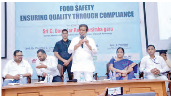
హైదరాబాద్, నవంబరు 5, ప్రభాతవార్త : ఫుడ్ సేఫ్టీ విషయంలో ప్రతి ఒక్కరూ బాధ్యతగా వ్యవహరించాలని దామోదర రాజనర్సింహ మంత్రి మాట్లాడుతూ నియమాలు అనుసరిస్తూ రిజిస్ట్రేషన్ చేసుకోవాలని ప్రభుత్వం అందగా