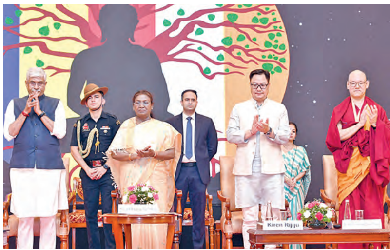
న్యూఢిల్లీలో మంగళవారం జరిగిన అంతర్జాతీయ బౌద్ధ శిబిరాన్ని సమావేశంలో రాష్ట్రపతి ముర్ము