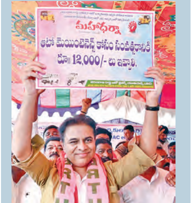
మంగళవారం హైదరాబాద్ లో ఆటో డ్రైవర్ల ధర్నాలో ప్లకార్డు ప్రదర్శిస్తున్న కెటిఆర్