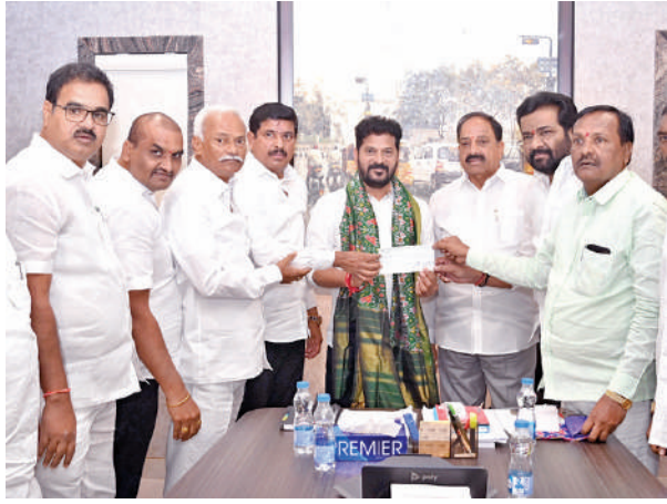
సిఎం సహాయనిధికి సహకార అపెక్స్ బ్యాంక్