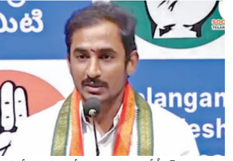
నిరుద్యులకు ఉద్యోగాలు రాకుండా కేటీఆర్ 50 లక్షలు ఖర్చు చేసి మరీ సుప్రీమ్ కోర్టులో కోట్లాడుతున్నారని ఆయన ఆరోపించారు.

చేయకుండా గట్టి వ్యవస్థ ఏర్పాటు చేశామని తెలిపారు. స్టాంప్ అండ్ రిజిస్ట్రేషన్ శాఖలో రికార్డులను పరిశీలిస్తే మీకు రిజిస్ట్రేషన్ సంఖ్య పెరిగినట్లు తెలుస్తుంది అని తెలిపారు హితవు చెప్పారు. రిజిస్ట్రేషన్లు జూలైలో 23,507, ఆగస్టులో 41,704 ఉన్న రెసిడెన్షియల్ రిజిస్ట్రేషన్ అప్లికేషన్లు, సెప్టెంబర్ నెలలో 83,090 వరకు పెరిగాయి అంటే పాత్ర కి సెప్టెంబర్ కి 273 పెరిగింది రాష్ట్రంలో రియల్ ఎస్టేట్ సమస్య అయినా నిరుద్యులను సమస్య అయినా కేవలం బి ఆర్ ఎస్ పార్టీలోనే ఉన్నాయి అని ఆయన తెలిపారు. 10 నెలల్లో 50 వేల కొలుపులు ఇచ్చిన చరిత్ర కాంగ్రెస్ కు ఉంది టీఆర్ఎస్ నేతలు నిరుద్యులను అయినందుకు వారికి సమస్యలు సృష్టించారు అని ఆయన ఎద్దేవా చేశారు.