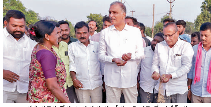
మహిళా రైతుతో మాట్లాడుతున్న మాజీ మంత్రి, ఎమ్మెల్యే హరీశ్ రావు

రకాల వడ్డీ రూ.5 బోనస్ చెల్లించాలన్నారు. మంత్రిలు, సిఎం ఎక్కువైన కొనుగోలు కేంద్రాలకు వెళ్లి రైతులకు బాండ్లు తెలుసుకున్నారని ప్రశ్నించారు. టీఆర్ఎస్ హయాంలో సిఎం కెసిఆర్ ఐపీఎస్ కొనుగోలు కేంద్రాలకు తెచ్చిన ప్రతి వరి గింజను కొనుగోలు చేసి మద్దతు ధరను అందించారని తెలిపారు. ఇప్పటికైనా కొనుగోలు కేంద్రాలకు తెచ్చిన వరి ధాన్యాన్ని వెంట మంటన కొనుగోలు చేసి రైతులకు మద్దతు ధర అందేలా