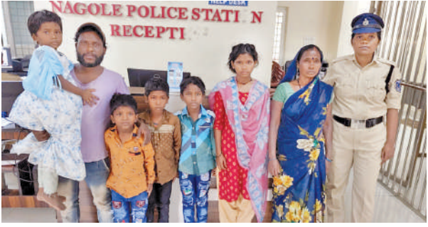
పోలీస్ స్టేషన్లో కుటుంబసభ్యులు