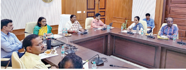
సచివాలయంలో శనివారం డిఆర్డీఓలతో సమీక్షా సమావేశం నిర్వహిస్తున్న పంచాయతీరాజ్, గ్రామీణాభివృద్ధి శాఖ మంత్రి సీతక్క

హైదరాబాద్, నవంబరు 2, ప్రభాతవార్త: రాష్ట్రంలో వడ్డీని సూచించారు. వచ్చే ఐదు నెలల్లో చేయాల్సిన గ్రామసభలు విధిగా నిర్వహించాలని మంత్రి సీతక్క ఆధికారుల దిశా నిర్దేశనం చేశారు.