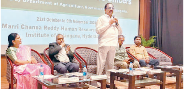
హైదరాబాద్, నవంబరు 2, ప్రభాతవార్త: రాష్ట్రంలో రైతులను సాంప్రదాయ పంటల నుండి వాణిజ్య పంటల సాగుకు ప్రోత్సహించాలని వ్యవసాయ మంత్రి తుమ్మల నాగేశ్వరరావు

హైదరాబాద్, నవంబరు 2, ప్రభాతవార్త: రాష్ట్రంలో రైతులను సాంప్రదాయ పంటల నుండి వాణిజ్య పంటల సాగుకు ప్రోత్సహించాలని వ్యవసాయ మంత్రి తుమ్మల నాగేశ్వరరావు సూచించారు. ఇదే సమయంలో పంటల మార్పిడి ఆపశ్చరణను వివరిస్తూ సాంప్రదాయ వ్యవసాయం వైపు మళ్లించేందుకు కృషి చేయాలన్నారు. హైదరాబాద్ ఎంసీపీఎల్ ఆర్డీలతో కొత్తగా నియమితులైన వ్యవసాయ ఆధికారుల శిక్షణా కార్యక్రమంలో పాల్గొని మాట్లాడుతూ తెలంగాణను వ్యవసాయంలో అగ్రగామిగా నిలబెట్టే ప్రభుత్వ లక్ష్యంలో ఆధికారులు భాగస్వామ్యం కావాలని కోరారు. రైతుల అసంభవాలకు సాంకేతిక విజ్ఞానాన్ని జోడిస్తే అద్భుత ఫలితాలు సాధించవచ్చన్నారు. రైతుల ప్రతి సమస్యకు పరిష్కారం చూపేటట్లుగా బాధ్యత అధికారులపై ఉండని చెప్పారు. మారుతున్న వాతావరణానికి అనుగుణంగా ఎప్పటికప్పుడు రైతుల నైపుణ్యాన్ని పెంచే విధంగా నిరంతరం శిక్షణ తరగతులను నిర్వహించాలని తెలిపారు.