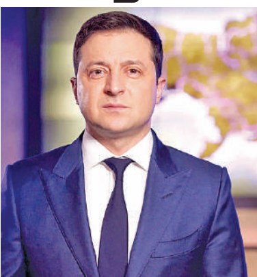
ఉందిన ఉత్తరకొరియా సైనికుల స్వాగతం అందుతూ చూసి, వాటిపై నిఘా పెడతామని

కీవ్, నవంబరు 2: రష్యా, ఉక్రెయిన్ల మధ్య కొనసాగుతున్న సుదీర్ఘ యుద్ధంలో రష్యా కీవ్ పై తీవ్రస్థాయిలో విరుచుకుపడుతోంది. రాజధాని కీవ్ నేలమట్టం చేయడమే లక్ష్యంగా గత నెలలో 20 సార్లు రష్యా డ్రోన్ దాడులకు పాల్పడినట్లు ఉక్రెయిన్ ప్రభుత్వ రష్యాకు వెల్లడించింది. ఉక్రెయిన్ యుద్ధానికి రష్యాకు మద్దతుగా ఉత్తరకొరియా వేల సంఖ్యలో సైనికులను ఆ దేశానికి పంపింది. ఈ విషయంలో ఉక్రెయిన్ అధ్యక్షుడు జెలెన్స్కీ మాట్లాడుతూ రష్యాపై క్షిపణులు ప్రయోగించడానికి తమ మిత్రదేశాలు అనుమతివ్వాలని కోరారు. రష్యాకు మద్దతుగా మోహరించిన ఉత్తర కొరియా సేనలను డిటాచ్ ఎదుర్కొంటామంటే క్షిపణులు ప్రయోగించాలన్నారు. రష్యా తన భూభాగంలో సిద్ధంగా