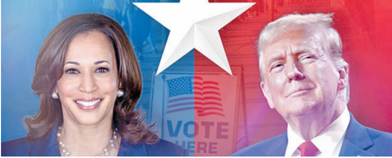
ముహూర్తం సమీపిస్తున్న వేళ..

ఇల్లందు, ప్రభాకర్, నవంబరు 3: భద్రాద్రి కొత్తగూడెం జిల్లా ఇల్లందు నియోజకవర్గంలో తెలంగాణ మంత్రిలు పాంగులేటి శ్రీనివాసరెడ్డి, తుమ్మల నాగేశ్వరరావు ఆదివారం పర్యటించారు. ఈ సందర్భంగా మార్కెట్ కమిటీ నూతన కమిటీ ప్రమాణ స్వీకారం చేశారు. ఆనంతరం తెలంగాణ మంత్రిలు పాంగులేటి శ్రీనివాసరెడ్డి, తుమ్మల నాగేశ్వరరావు మాట్లాడుతూ... గత పదిహేనేళ్లలో పాలనలో కష్టాలను పది మాసినమని, తెల్లరేపన కార్టలు ఇవ్వలేదని బీఆర్ఎస్ ప్రభుత్వం దుర్మయ్యబట్టారు. కాంగ్రెస్ ప్రభుత్వం స్టార్ట్ కార్ట్ ద్వారా పథకాల అమలు చేస్తుందని అన్నారు. రైతులకు 2 లక్షల రుణమాఫీ చేస్తున్న ప్రభుత్వం కాంగ్రెస్ ప్రభుత్వమని అన్నారు. కాంగ్రెస్ ప్రభుత్వం రైతులకు 18వేల ఇళ్లు 13వేల ఎగ్జిట్ లింక్ అన్నారు. రాబోయే రోజుల్లో 20 లక్షల ఇందిరమ్మ ఇండ్లను కీర్తిస్తామని అన్నారు. రాష్ట్రంలో ఆర్థిక ఇబ్బందులు ఉన్న పేద బడుగు బలహీన వర్గాల ప్రజలను ఆదుకుంటామని హామీ ఇచ్చారు. పది సంవత్సరాలుగా బీఆర్ఎస్ ప్రభుత్వం ప్రజలను వట్టింపలేదని అన్నారు. కేటీఆర్ ఇప్పుడు పాపయాత్ర చేస్తాడని ప్రజల కష్టాలను చూడలేదు ఎప్పుడూ గుర్తించారు ప్రజలు అని అన్నారు. లక్ష కోట్ల హామీని విడిచి ప్రతి గ్రామ పంచాయతీకి వంద ఇళ్లను డిమాండ్ చేశారు. పేదవాడి కనీసం తుడిచేది ప్రభుత్వం చేయాలని అన్నారు. మంత్రి తుమ్మల మాట్లాడుతూ... 40 ముఠాలో ఇల్లందు నియోజక