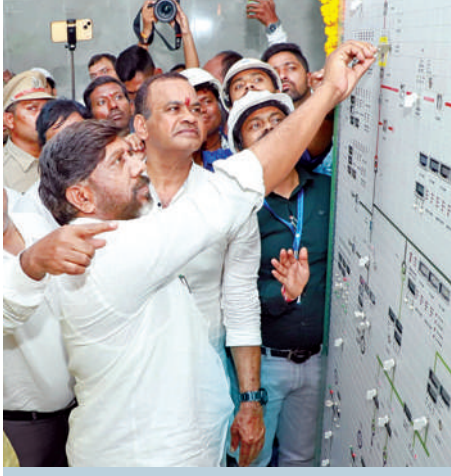
ఆదివారం పవర్ యూనిట్ ట్రయల్ రన్ ను ప్రారంభిస్తున్న డి. సిఎం భట్టి విక్రమార్యుల మంత్రి కోమటిరెడ్డి