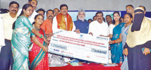
మహిళా సంఘాలకు చెక్కులను పంపిణీ చేస్తున్న స్పీకర్