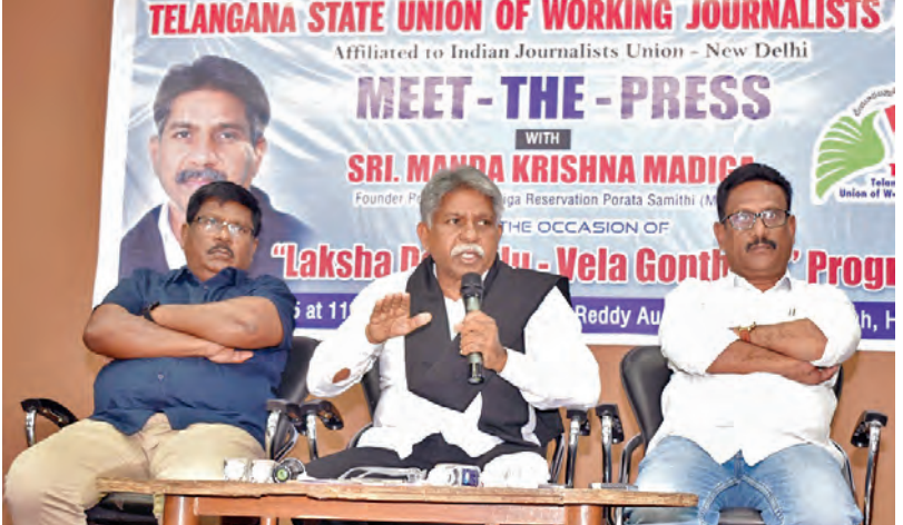
సోమవారం మీట్ డి ప్రెస్ లో మాట్లాడుతున్న మంద కృష్ణమాదిగ

30న గాంధీ విగ్రహాలకు వినతీ పత్రాలు ఇస్తాం: కెటిఆర్ ప్రభావత్య ప్రధాన ప్రతినిధి, హైదరాబాద్,జనవరి27: కాంగ్రెస్ పార్టీ అనేక అబద్ధపు హామీల్ని అధికారంలోకి వచ్చిన బీఆర్ఎస్ పర్యంగం ప్రెసిడెంట్ కేటీఆర్ ద్వజమెత్తారు. అబద్ధాలతో పాలన కొనసాగిస్తున్న రేవంత్ రెడ్డికి బుద్ధి ప్రసాదించాలని జనవరి 30వ తేదీన మహాత్మా గాంధీ విగ్రహాలకు వినతీ పత్రాలు ఇస్తామని బీఆర్ఎస్ నేతలకు, విద్యార్థులకు కేటీఆర్ పిలుపునిచ్చారు. సోమవారం తెలంగాణ భవన్లో బీఆర్ఎస్ కార్యదర్శ అమిత్ షా ఆనంతరం కేటీఆర్ మాట్లాడారు.జనవరి 30వ తేదీన మహాత్మా గాంధీ వద్దం.. బాపును తలచుకుంటూ.. కాంగ్రెస్ మోసాన్ని ఎండగడుతూ బిజినెస్ గాంధీ.. ఈ దుష్ప్రవృత్తి గాంధీకి బుద్ధి తెచ్చేలా ఒక ప్రోగ్రామ్ తీసుకువచ్చామని చెప్పారు. జనవరి 30 నాటికి కాంగ్రెస్ ప్రభుత్వం ఏర్పడి 42 రోజులు అవుతుంది కాబట్టి.. 420 హామీలపై ప్రశ్నించారు. గాంధీ విగ్రహం వద్దకు వెళ్లి వినతీపత్రం ఇస్తూ.. సోనియా, రాహుల్, ప్రయాంక గాంధీ కలలోకి వచ్చి.. రేవంత్ రెడ్డికి బుద్ధి తెప్పిస్తూ ఆకాశం ఇవ్వడంపై వినతీపత్రం ఇస్తాం అని పార్టీ శ్రేణులకు పిలుపునిచ్చారు. రాష్ట్ర వ్యాప్తంగా ఈ కార్యక్రమాన్ని విజయవంతం చేయాలని బీఆర్ఎస్ శ్రేణులకు కేటీఆర్ పిలుపునిచ్చారు. వ్యవసాయ శాఖ మాజీ మంత్రి నిరంజన్ రెడ్డి నేతృత్వంలో రైతుల అభ్యుత్థాన్ని ఏర్పాటు చేసిన అభ్యయన కమిటీ ఆదిరాజాద్, నిజామాబాద్ జిల్లాలో పర్యటించి.. ఆ రైతుల కుటుంబాల్లో భరోసా నింపడన్నారు.