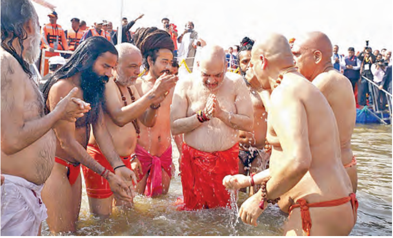
సోమవారం ప్రయాగ్ రాజ్ కాలనీ లోని శ్రీమతి సంగమం వద్ద మహానభం పుణ్యస్నానాలాచరిస్తున్న కేంద్ర హోంమంత్రి అమిత్ షా, యుపి సిఎం ఆదిత్యనాథ్ తదితరులు