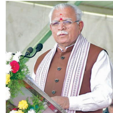
శుక్రవారం కరీంనగర్ బహిరంగ సభలో ప్రసంగిస్తున్న కేంద్ర మంత్రి ఖట్టర్

కరీంనగర్ ప్రతినిధి, ప్రభాతవార్త: దేశంలోనే సుసంపన్నమైన రాష్ట్రం తెలంగాణ అని కేంద్ర పట్టణాభివృద్ధి, విద్యుత్, గృహ నిర్మాణ శాఖ మంత్రి మనోహర్ లాల్ ఖట్టర్ తెలిపారు.. ఈ ఏడాది దేశవ్యాప్తంగా కోటి ఇండ్లను నిర్మించ బోతున్నామని అన్నారు. శుక్రవారం కరీంనగర్ జిల్లాకేంద్రంలో ఆయన పర్యటించారు. వివిధ అభివృద్ధి కార్యక్రమాల ఆయన ప్రారంభించి, అనంతరం కరీంనగర్ బహిరంగ సభలో పాల్గొని ప్రసంగించారు.. నా ప్రయత్నం కరీంనగర్ పౌరులకా నమస్తే.. అంటూ తెలుగులో కేంద్ర మంత్రి మనోహర్ లాల్ ఖట్టర్ మొదట ప్రసంగాన్ని ప్రారంభించారు. నా వేతల మీదగా ఈ కార్యక్రమాన్ని ప్రారంభించే అవకాశం కల్పించినందుకు బండి సంజయ్ కు ధన్యవాదాలు చెబుతున్నానని అన్నారు. ఎన్నో ఛోరాలూకు.. నిత్య వైతన్యాలూ.. ఎందరో త్యాగాలకు పురిటి గడ్డ ఈ కరీంనగర్ నేల అని తెలిపారు. పవిత్రమైన