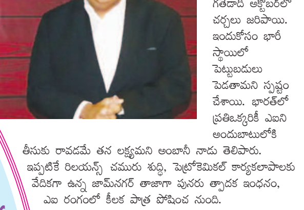
తీసుకు రావడమే తన లక్ష్యమని అంబానీ నాడు తెలిపారు. ఇప్పటికే రిలయన్స్ చమురు శుద్ధి, పెట్రోకెమికల్ కార్యకలాపాలకు వేదికగా ఉన్న జామ్ నగర్ తాజాగా పునరుద్ధారణ ఇంద్రం, ఎం రంగంలో కీలక పాత్ర పోషించ నుంది.

ప్రణాళికలను కూడా ప్రకటించాయి. ఈ పరిమాణాల నేపథ్యంలో ప్రపంచంలోనే అతిపెద్ద డేటా సెంటర్ ఏర్పాటు చేయాలని అంబానీ చూస్తుండడం ప్రధానంగా సంబంధించింది. దీని నిర్మాణ పనులు అనుకున్నట్లే ముందుకు సాగితే, ప్రస్తుతం ఈ విభాగంలో భారత్ సామర్థ్యాల పెరుగుతాయి. దేశంలో మొత్తం సామర్థ్యం గిగాబైట్ కంటే తక్కువే ఉంది. కొత్త ప్రాజెక్ట్లో ఇది మూడింతలు పెరగ వచ్చు. ఇది దేశానికి ప్రధాన మైలురాయి గా మారుతుంది. భారత్లో కృత్రిమ మేధ కంప్యూటేటింగ్ మార్కెట్ వసతులతో పాటు ఇన్నోవేషన్ సెంటర్ ఏర్పాటు చేయడం కోసం రిలయన్స్ ఇండస్ట్రీస్, ఎన్సిడియా గతేడాది ఆక్టోబర్లో వర్చువల్ జియోమెట్రిక్స్ను జరిపాయి. ఇందుకోసం భారత్ స్థాయిలో పెట్టుబడులు పెడతామని స్పష్టం చేశాయి. భారత్లో ప్రతిఒక్కరికీ ఎంబి అందుబాటులోకి