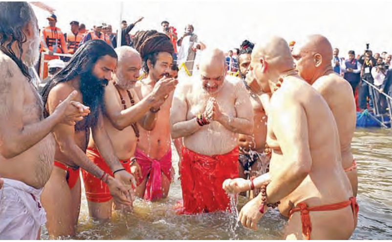
సోమవారం ప్రయాగ్ రాజ్ లోని త్రివేణి సంగమం వద్ద మహాకంభే పుణ్యస్నానాలాచరిస్తున్న కేంద్ర హోంమంత్రి ఆమితోషా, యుపి సిఎం ఆదిత్యనాథ్ తదితరులు