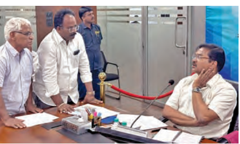
సోమవారం బుద్ధభవన్లో హైద్రా కార్యాలయంలో నిర్వహించిన ప్రజావాణిలో ఫిర్యాదిదారులతో మాట్లాడుతున్న కమిషనర్ రంగనాథ్

హైదరాబాద్, జనవరి 27.ప్రభాతవార్త: ప్రజావాణిలో అందుకున్న ఫిర్యాదులపై ఆయా ప్రాంతాలకు రెండువారాల్లో అధికారులు స్వయంగా వచ్చి విచారించిన వారు వచ్చినప్పుడు సంబంధిత పత్రాలను వారికి చూపించాలని హైద్రా కమిషనర్ రంగనాథ్ ఫిర్యాదుదారులకు సూచించారు. ఈవేరకు సోమవారం బుద్ధభవన్లో హైద్రా కార్యాలయంలో నిర్వహించిన ప్రజావాణిలో మొత్తం 78 ఫిర్యాదులను కమిషనర్ నిర్వహించారు.ముఖ్యంగా చెరువులు, నారాలు, రహదారులు, ప్రజావసరాలకు ఉద్దేశించిన స్థలాలు కట్టాలకు గురి అవుతున్నాయని ఫిర్యాదులు చేశారు. ఈనందర్పంగా ఫిర్యాదు