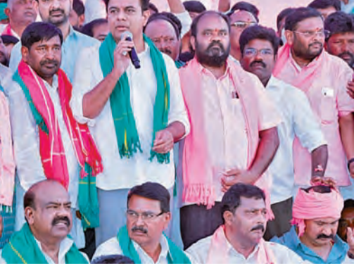
నల్గొండ రైతు మహాధర్మాలో మాట్లాడుతున్న మాజీ మంత్రి కేటీఆర్

కుట్ర వేస్తున్నారని ఆరోపించారు. రైతుబంధు విషయంలో ఒక్కో రైతుకు రేవంత్ రెడ్డి ఎకరానికి 17,500 షాక్ ఉన్నారని తెలిపారు. నల్గొండ నుంచే కాంగ్రెస్ ను చీల్చివేస్తాడే పోలీసుల మొదలైందన్నారు. మంత్రులను ఎక్కడికక్కడ నిలదీయాలని పిలుపునిచ్చారు. నల్గొండలో మంత్రి కోమటిరెడ్డి ఓవర్ యాక్సన్ చేస్తూ అసభ్యంగా మాట్లాడుతున్నారని తెలిపారు. కోమటిరెడ్డికి దమ్ముంటే మీటింగ్ పెట్టి ఏం అభివృద్ధి చేశారో చెప్పాలన్నారు. ఇక్కడ ప్రజల ఆదరణ చూస్తుంటే తాను రైతు ధర్మాకు వచ్చినట్లు లేదని విజయోత్సవ ర్యాలీకి వచ్చినట్లు ఉందని వార్తల వ్యక్తం చేశారు. నల్గొండలో అడుగుపెట్టగానే మహాత్మా గాంధీ యూనివర్సిటీ దగ్గర మూడు నాలుగు వందల మంది విద్యార్థులు రోడ్డు మీదకు వచ్చారన్నారు. కేసీఆర్ పాలనలో తమకు అన్ని పన్నులు ఉండేవని ఇప్పుడు కాంగ్రెస్ ప్రభుత్వం వచ్చిన తర్వాత గొడ్డుకారంతో అన్నం తినే దుస్థితి వచ్చిందని విద్యార్థులు ఆవేదన వ్యక్తం చేసినట్లు తెలిపారు. ధర్మాకు భారీ సంఖ్యలో తరలివచ్చిన నల్గొండ రైతు బిడ్డలకు కృతజ్ఞతలు తెలిపారు. మాజీ మంత్రి