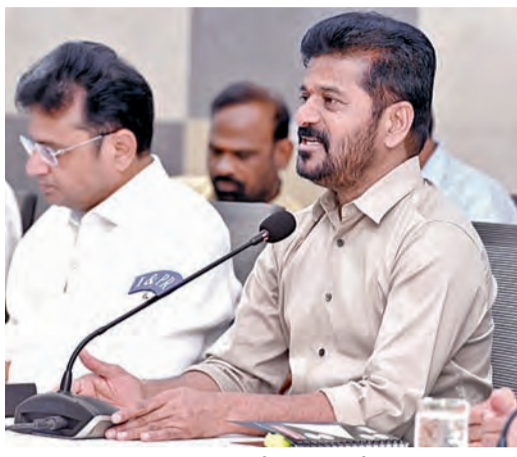
మంగళవారం సచివాలయంలో మీడియాతో మాట్లాడుతున్న సిఎం రేవంత్ రెడ్డి, మంత్రి శ్రీధర్ బాబు

రాష్ట్రానికి రూ.1.80 లక్షల కోట్ల పెట్టుబడులు ఆకర్షించాం కాంగ్రెస్ ప్రభుత్వం ఎనర్జీ పాలసీయే అందుకు కారణం: సిఎం రేవంత్ ట్రిలియన్ ఎకానమీగా తీర్చిదిద్దాం: మంత్రి శ్రీధర్ బాబు