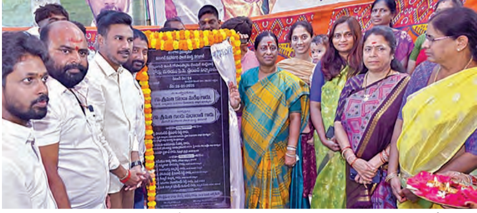
మంగళవారం హనుమకొండ డివిజన్ లో పలు అభివృద్ధి కార్యక్రమాలను ప్రారంభించిన మంత్రి కొండా సురేఖ

-మంత్రి కొండా సురేఖ వెల్లడి నియోజకవర్గంలోని పలు డివిజన్లలో రూ.1.50 కోట్ల అభివృద్ధి పనులు