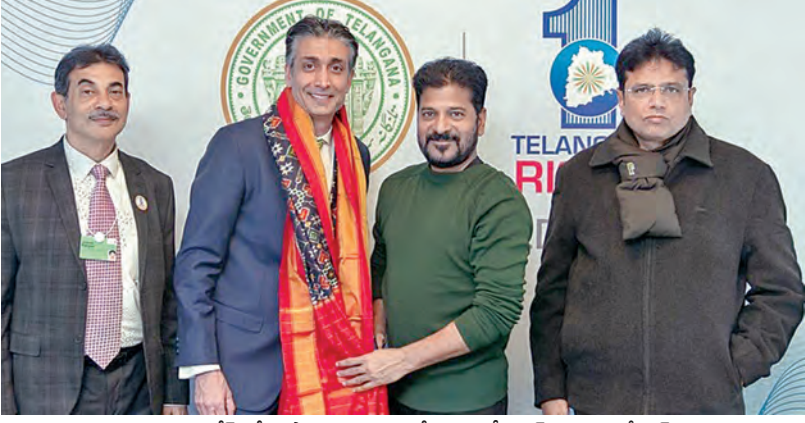
గురువారం దావోస్ లో విప్రో ప్రతినిధులతో సీఎం రేవంత్, మంత్రి శ్రీధర్ బాబు