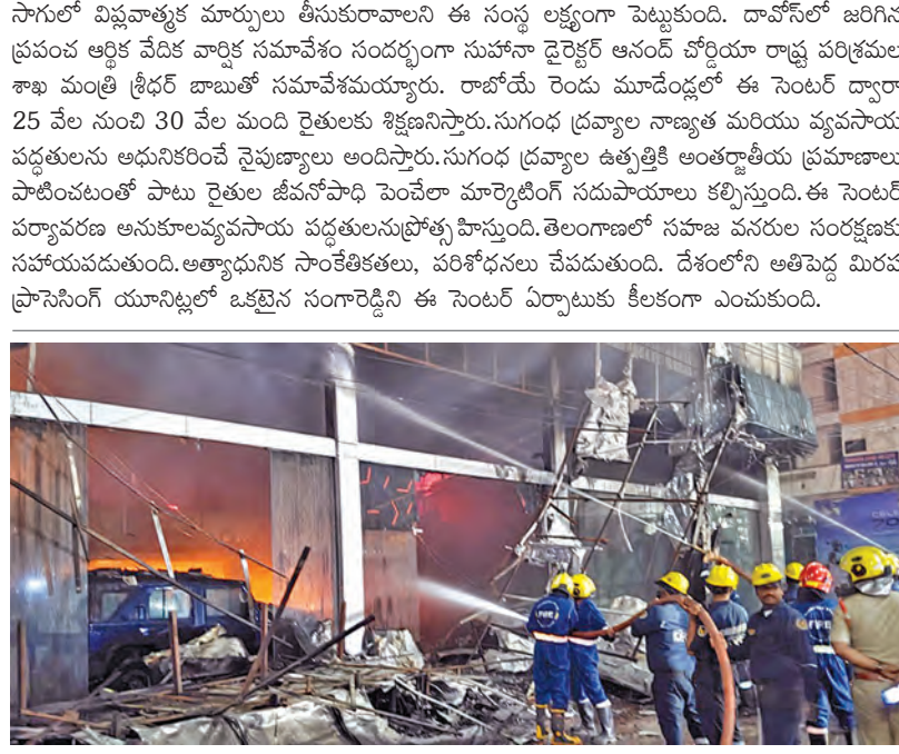
గురువారం అర్ధరాత్రి కొండపూర్ లోని మహాద్రా ధోబాలో మంటలను ఆర్పుతున్న అగ్నిమాపక సిబ్బంది