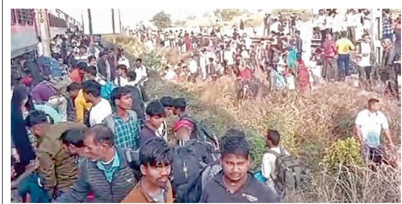
మహారాష్ట్రలోని జలోగావ్ లోని వరదా స్టేషన్ వద్ద బుధవారం జరిగిన రైలునడకపై దృశ్యం

23-1-2025 గురువారం సంపుటి: 30 సం-క: 355 పేజీలు: 10+4 వెల: 6.50