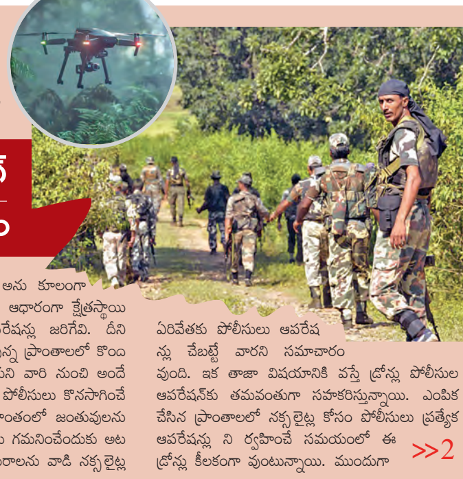
ఏరివేతకు పోలీసులు ఆపరేషన్లు చేపట్టే వారిని సమాచారం వుంది. ఇక తాళా విషయానికి వస్తే డ్రోన్లు పోలీసుల ఆపరేషన్లకు తమవంతుగా సహకరిస్తున్నాయి. ఎంపిక చేసిన ప్రాంతాలలో సక్రమంగా కోసం పోలీసులు ప్రత్యేక ఆపరేషన్లను నిర్వహించే సమయంలో ఈ డ్రోన్లు కీలకంగా పులుస్తాయి. ముందుగా >>2