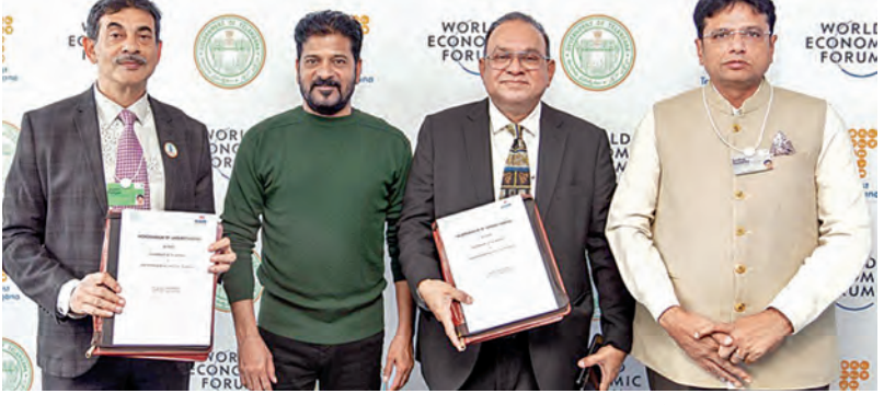
బుధవారం దావోస్ లో సన్ పెట్రో కెమికల్స్ తో కుదిరిన ఎంఓయూ. చిత్రంలో సిఎం రేవంత్, మంత్రి శ్రీధర్ బాబు