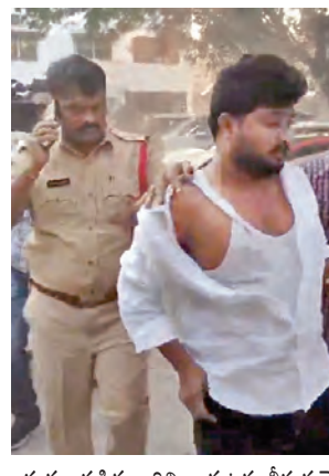
ఘర్షణ పడిన వారిని బయటకు తీసుకువెళ్తున్న దృశ్యం

హైదరాబాద్, జనవరి 22, ప్రభాతవార్: జనపనార రైతులకు కేంద్ర ప్రభుత్వం తీవ్ర కబురు చెప్పింది. 2025-26 వ్యవసాయ సీజన్కు సంబంధించి ముడి జనపనార (రా జాబ్) కనీస మద్దతు ధరను పెంచుతూ ప్రధాన మంత్రి నరేంద్ర మోడీ నేతృత్వంలోని ఆర్థిక వ్యవహారాల కేబినెట్ కమిటీ (సీసీఐఐ) బుధవారం ఆమోదం తెలిపింది. ముడి జాబ్ ఎంఎస్సీ మునుపటి మార్కెటింగ్ సీజన్ 2024-25 కంటే క్రిందగాలుకు 315 రూపాయలు పెంచింది. 2025-26 సీజన్లో ముడి జనపనార (ట్రీడి-3 గ్రేడ్) ముడి జనపనార కనీస మద్దతు ధరను క్రిందగాలుకు 5,650 రూపాయలుగా నిర్ణయించింది. ఈ నిర్ణయం రైతులకు 66.8 శాతం రాబడిని ఇస్తుందని కేంద్రం పేర్కొంది. 2014-15 నుండి 2024-25 మధ్య కాలంలో జనపనార సాగు చేసే రైతులకు చెల్లించిన ఎంఎస్సీ మొత్తం 1,300 కోట్ల రూపాయలు కాగా, 2004-05 నుంచి 2013-14 మధ్యకాలంలో చెల్లించిన మొత్తం 441 కోట్ల రూపాయలుగా ఉంది. కాగా 40 లక్షల వ్యవసాయ కుటుంబాల జీవనోపాధి ప్రత్యక్షంగా లేనాపరోక్షంగా జాబ్ పరిశ్రమపై ఆధారపడి ఉంది. దాదాపు 4 లక్షల మంది కార్మికులు జాబ్ మిల్లర్ల ప్రత్యక్ష ఉపాధిని >>2