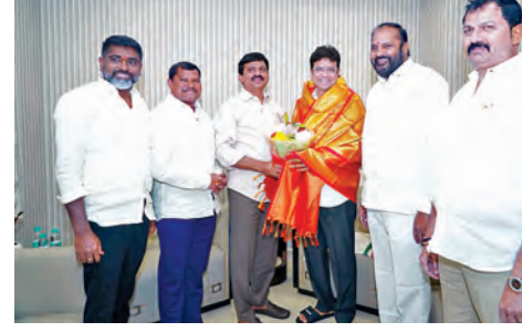
మంత్రి శ్రీధర్ బాబును సత్కరించిన మంత్రి పొంగులేటి

ప్రభాతవార్ ప్రధాన ప్రతినిధి, హైదరాబాద్, జనవరి 28: ఎపీ ముఖ్యమంత్రి చంద్రబాబు విశాల దృక్పథం కలిగిన వ్యక్తి అని తెలంగాణ ఐటీ, పరిశ్రమల శాఖ మంత్రి దుద్దిళ్ళ శ్రీధర్ బాబు అభిప్రాయించారు. ఇటీవల దావోస్ వర్షులులో చంద్రబాబును కలిశానని, ఆయనతో మాట్లాడిన తర్వాత ఆయన అలోచనా విధానం ఎంత విశాలమైనదో అర్థం చేసుకున్నానని వివరించారు. పెట్టుబడులు రాబట్టేందుకు చంద్రబాబు ప్రయత్నాలు జాగున్నాయని కీర్తించారు. ఎపీకి తీర ప్రాంతం, అపారమైన వనరులు ఉన్నాయని శ్రీధర్ బాబు వెల్లడించారు. ఆంధ్రప్రదేశ్ రాష్ట్రానికి మంచి పరిశ్రమలు వస్తాయని అన్నారు. వచ్చే మూడేళ్లలో ఎపీకి భారీగా పెట్టుబడులు వచ్చే అవకాశాలున్నాయని అభిప్రాయపడ్డారు. దావోస్