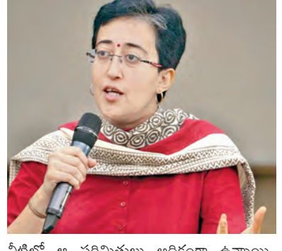
నీటిలో ఆ పరిమితులు అధికంగా ఉన్నాయి. దీని కారణంగా దేశ రాజధానిలో దాదాపు 34 లక్షల మంది ప్రజలకు నీటి సరఫరా 15.20 శాతం తగ్గిపోయింది. ఈ నీటి వల్ల మూత్ర పిండాల దెబ్బతినడంతో పాటు శ్వాసకోశ ఇబ్బం దులు వస్తాయి. ఈ విషయాన్ని హర్యానా ప్రభుత్వానికి తెలుసు. అయినా ఉద్దేశపూర్వకంగా

న్యూఢిల్లీ, జనవరి 28: హర్యానా నుంచి ఢిల్లీకి ప్రవహిస్తున్న యమునా నదిలో అమోనియం స్థాయిలు అరు రెట్లు అధికంగా ఉన్నాయని ఢిల్లీ సిఎం అతిశీ పేర్కొన్నారు. హర్యానా ప్రభుత్వం యమునానదిలోకి పారిశ్రామికవ్యర్థాలను వదులు తోందని ఆమ్ కన్వెన్షన్ కేజ్రీవాలీ ఆరోపణలు చేసిన సంగతి తెలిసింది. తాజాగా ఈ అంశంపై అతిశీ స్పందించారు. ఈ విషయాన్ని ఎన్నికల కమిషన్ దృష్టికి తీసుకెళ్లాలన్నారు. ఈ మేరకు ఎన్టీవేడికగా ఓ రెటర్నివివదలచేశారు. హర్యానా నుంచి ఢిల్లీలోకి ప్రవేశిస్తున్న యమునా నదిలోని నీటిలో అమోనియా స్థాయిలు అరు రెట్లు అధికంగా ఉంటున్నాయి. ఇవి మానవ శరీరానికి చాలా ప్రమాదం. ఈ నీటిని కుద్దపేసి ఢిల్లీ ప్రజలకు పంపిణీ చేయడం సాధ్యం కాదు. ఢిల్లీ జల్ బోర్డుకు చెందిన నీటి కుద్ద కర్మాగారాలు అమోనియా స్థాయిలు 15పిపిఎం వరకు కుద్ద చేయగలవు. కానీ హర్యానా నుంచి వస్తున్న