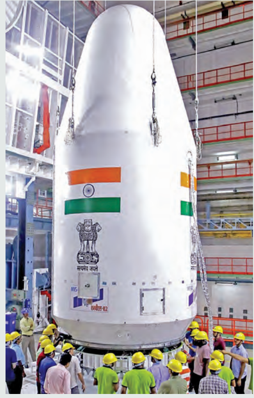
జిఎస్ఎల్వి-ఎఫ్15 మూడవ దశ ఇంజన్, ఇస్రో నావిగేషన్ ఉపకరణాల అమర్చారు