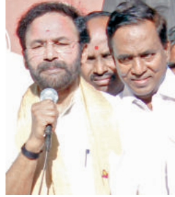
ఆదివారం బిజెపి కార్యాలయంలో మాట్లాడుతున్న కేంద్రమంత్రి కిషన్ రెడ్డి

హైదరాబాద్, జనవరి 26 ప్రభాతవార్: దేశ ప్రజలకు ఈ గణతంత్ర దినోత్సవం ప్రత్యేకమైనది కేంద్ర మంత్రి కిషన్ రెడ్డి అన్నారు. ఆదివారం బిజెపి రాష్ట్ర కార్యాయంలో గణతంత్ర దినోత్సవ సందర్భంగా జాతీయ పతాకాన్ని కేంద్రమంత్రి కిషన్ రెడ్డి అవిష్కరించారు. ఈ సందర్భంగా తెలుగు ప్రజలకు, తెలంగాణ ప్రజలకు హృదయపూర్వక శుభాకాంక్షలు తెలిపారు. రాజ్యాంగ నిర్మాత డాక్టర్ బాబాసాహెబ్ అంబేద్కర్ కిషన్ రెడ్డి నివాళులర్పించాల్సిన బాధ్యత అందరిపై ఉందన్నారు. నరేంద్ర మోడీ నాయకత్వంలో గత వది సంవత్సరాలుగా అంబేద్కర్ స్మారక పోలన అందిస్తూ దేశ ప్రజలకు సేవలందిస్తున్నారు. కాంగ్రెస్ పార్టీ నాయకుడు రాహుల్ గాంధీ చేతిలో రాజ్యాంగ పుస్తకాన్ని పట్టుకుని తిరుగుతారు. కనీసం రాజ్యాంగాన్ని చదివిన పాపానపోలేదు. రాజ్యాంగాన్ని అవహేళన చేస్తూ ఉంటారు. కాంగ్రెస్ పార్టీ నెహ్రూ హయాం నుంచి రాజ్యాంగాన్ని అవహేళన చేసి, పౌరహక్కులను అణచివేశారో రాహుల్ గాంధీకి అర్థం కావచ్చు. ఇందిరాగాంధీ ప్రధానమంత్రిగా ఉన్నప్పుడు అలహాబాద్ హైకోర్టు ఆమె ఎన్నికను చెల్లనిదిగా ప్రకటించి, పార్లమెంటు సభ్యత్వాన్ని రద్దు చేసింది. దీంతో రాజ్యాంగాన్ని కాలరాసి, అధికార దుర్వినియోగం చేసి ఇందిరాగాంధీ ఎమర్జెన్సీ పెట్టారన్నారు. మీసా చట్టం కింద అనేక మంది రాజకీయ నేతలను అన్యాయంగా అరెస్టు చేశారన్నారు. అలాగే బీహార్ వాళ్ల పేయి, లాల్ కృష్ణ అద్వానీ, వెంకయ్యనాయుడు, అచార్య కృపలాసి లాంటి అనేక మంది నాయకులను జైలులో పెట్టారన్నారు. మీసా చట్టం కింద దేశ్యాంగ జైలుగా మార్చి పౌర హక్కులను కాలరాసి, పత్రికాస్వేచ్ఛను హరించి రాష్ట్రీయ స్వయంసేవకీ లాంటి సంస్థలను >>2