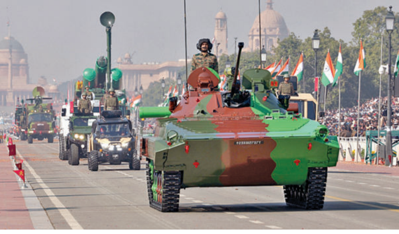
ఆదివారం న్యూఢిల్లీలోని కర్ణాటకలో గణతంత్ర దినోత్సవాల సందర్భంగా సైనిక పాటవ శకటాలను పరిశీలిస్తున్న ముఖ్య అతిథి ఇండోనేసియా అధ్యక్షుడైన ప్రబోవో సుబియాంటో, రాష్ట్రపతి ముర్ము, ప్రధాని మోడీ తదితరులు