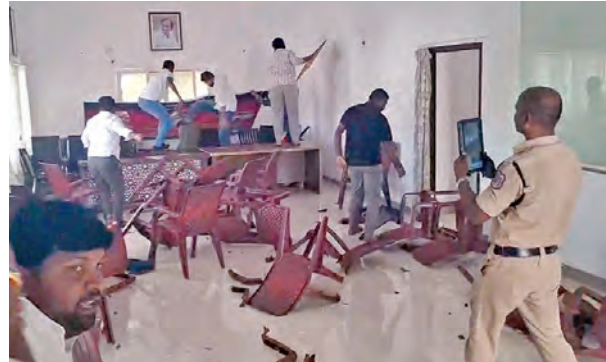
నినాదాలు చేస్తూ ధర్మా చేశారు. కార్యాలయంపై దాడి చేసిన వారిని వెంటనే శిక్షించాలని పట్టు షోలీన్ స్టేషన్ లో ఫిర్యాదు చేశారు. తీవ్ర ఉద్రిక్తమైన సంఘటనలు చోటుచేసుకోవడంతో పోలీసులు గట్టి బంధంబిస్తు ఏర్పాటు చేశారు.

భువనగిరి రూరల్, జనవరి 11, ప్రభాతవార్త: బిఆర్ఎస్ కార్యాలయంపై కాంగ్రెస్ శ్రేణులు దాడి చేసినట్లు భువనగిరిలో ఉద్రిక్త పరిస్థితులు చోటుచేసుకున్నాయి. ముఖ్యమంత్రి రేవంత్ రెడ్డిపై బిఆర్ఎస్ నాయకులు అనుచిత వ్యాఖ్యలు చేశారని ఆగ్రహించిన కాంగ్రెస్ శ్రేణులు జిల్లా బిఆర్ఎస్ కార్యాలయంపై దాడిచేసి తెసిఆర్, కేటీఆర్ ఫోటోలు అమలు కార్యాలయంలోని ఫర్మిచర్ ధ్వంసం చేశారు. కెసిఆర్ డౌన్ డౌన్ అంటూ నినాదాలు చేస్తూ కార్యాలయం ముందు బైరాయింపారు. విషయం తెలుసుకున్న పోలీసులు హతాభుటలనీ ఘటన స్థలానికి చేరుకోని నిరసనకారులను అరిస్తూచేసి పోలీస్ స్టేషన్ కు తరలింపారు. దాడికి నిరసనగా బిఆర్ఎస్ నాయకులు పట్టు కేంద్రంలోని రైతు బజార్ ముందు ముఖ్యమంత్రి డౌన్ డౌన్ అంటూ