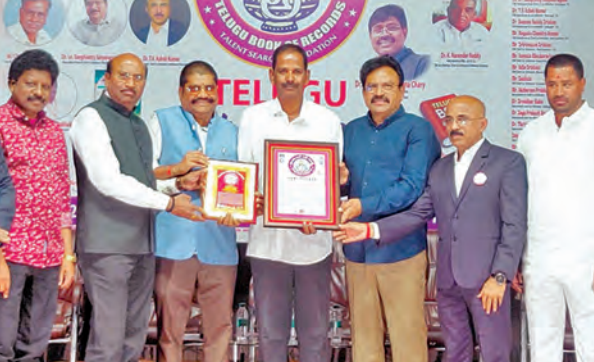
తెలుగు బుక్ ఆఫ్ రికార్డులను అందించిన దృశ్యం

హైదరాబాద్, జనవరి 11, ప్రభాతవార్త: యువీలోని ప్రయోగశాలలో జరగనున్న మహా కుంభమేళా పునర్నిరవంతు ప్రజలను మోసం చేసేందుకు సైబర్ నేరగాళ్లు కొత్త ఎత్తుగడలను ఎంచుకున్నట్లు తెలంగాణ సైబర్ సెక్యూరిటీ బ్యూరో (బిజిసిఎస్) గుర్తించింది. వెబ్ సైట్ల ద్వారా ఆన్ లైన్ లో హాట్ డేట్లు బుకింగ్ చేసేటని ప్రజలను నమ్మించే కొన్ని గోల్డోనాల్ సంస్థలను సైబర్ నేరగాళ్లు ఏర్పాటు చేసినట్లు గుర్తించిన బిజిసిఎస్ బి ఈ విషయంలో కుంభమేళా వెబ్ సైట్ల అందరం అప్రమత్తంగా వెంటాడాలని హెచ్చరించింది. ఇందులో ఏమాత్రం అజాగ్రత్తగా ఉన్నా ఖజానా వ్యవధిలో బ్యాంకు లోని నగదు షాటి అవడం భాయమని బిజిసిఎస్ బి అధికారులు హెచ్చరించారు. కుంభ మేళకు వెబ్ సైటు ముందుగానే అన్ని ఏర్పాట్లు చేసుకోవాలని, అధికారిక వెబ్ సైట్లపై నాడుతున్న, సోపల్ ఆకర్షణం వచ్చే వెబ్ సైట్లను వల్లించుకోవద్దని, ఆకర్షణంమైన ప్రకటనలతో కనపించే వాటిని నమ్మవద్దని అధికారులు కోరారు. సైబర్ నేరగాళ్లు బాంసపట్ట వారు వెంటనే 1930కు పుష్కరాలు చేసే చాలారావు మేలు జరుగుతుందని వారు తెలిపారు. సైబర్ నేరగాళ్ల మోసాచారిన పడకుండా ఉండాలంటే సెలంతం అప్రమత్తంగా ఉండడమే మేలని బిజిసిఎస్ బి అధికారులు తెలిపారు.