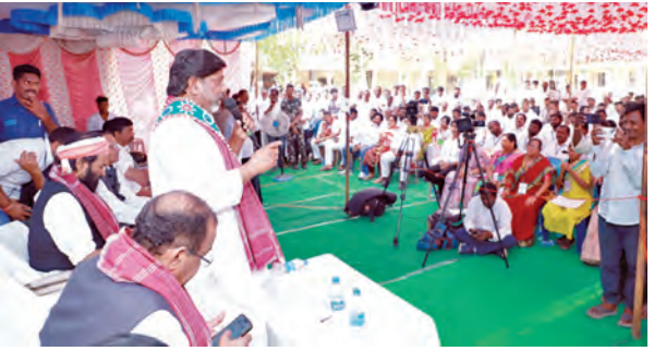
ఆదివాని, గిరిజన ప్రజాప్రతినిధుల శిక్షణా శిబిరం ముగింపు సమావేశంలో మాట్లాడుతున్న డిప్యూటీ సీఎం భట్టి విక్రమార్కు