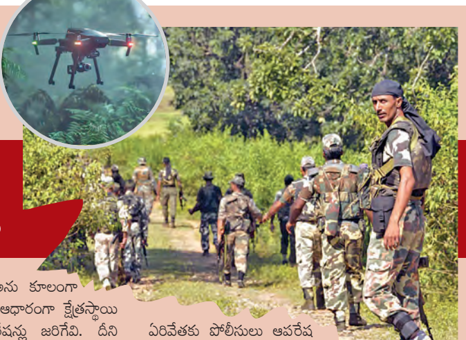
ఏరివేతకు పోలీసులు ఆపరేషన్లు చేపట్టే వారిని సమాచారం వుంది.

విన 21 రోజుల్లో 45 మంది మావోయిస్టులు పత్తీస్ మిల్ అటవీ ప్రాంతంలో పోలీసుల ఎదురు కాల్పుల్లో మరణించారు. మరణించిన వారిలో మావోయిస్టు అగ్రనేత ల్లో ఒకరైన చలపతి కూడా వున్నారు. వచ్చే ఏడాది అంటే 2026 ఏప్రిల్ నాటికి దేశంలో నక్కలైట్ల లేకుండా చేస్తామని ప్రకటించిన కేంద్రం అందుకు అనుగుణంగా మావోయిస్టుల ఏరివేతకు అందుబాటులో వున్న అన్ని అస్త్ర, శస్త్రాలను వాడుతోంది. నిన్నుమొన్నటి వరకు ఇన్ ఫార్మర్ల వ్యవస్థతో పాటు లొంగిపోయిన నక్కలైట్లలో కొందరిని తమకు అనుకూలంగా శ్రేణిస్తాయి లో పోలీసుల కూంటింగ్ ఆపరేషన్ జరిగింది. దీని తరువాత నక్కలైట్లకు పట్టుగా వున్న ప్రాంతాలలో కొందరు యువకులను ఎంపిక చేసుకుని వారి నుంచి అదే సమాచారంతో నక్కలైట్ల వేటను పోలీసులు కొనసాగించే వారు. దీంతో పాటు అటవీ ప్రాంతంలో జంతువులను తెక్కించేందుకు, వాటి కదలికలను గమనించేందుకు అటవీ శాఖ ఏర్పాటు చేసిన సిసి కెమెరాలను వాడి నక్కలైట్ల ఏరివేతకు పోలీసులు ఆపరేషన్లు చేపట్టారు. వీటి డ్రోన్లు పోలీసులు ఆపరేషన్లు చేపట్టే వారిని సమాచారం వుంది. ఇక తాళా విషయానికి వస్తే డ్రోన్లు పోలీసులు ఆపరేషన్లకు తమవంతుగా సహకరిస్తున్నాయి. ఎంపిక చేసిన ప్రాంతాలలో నక్కలైట్ కోసం పోలీసులు ప్రత్యేక ఆపరేషన్లను నిర్వహించే సమయంలో ఈ డ్రోన్స్ కీలకంగా పులుస్తాయి. ముందుగా >>2