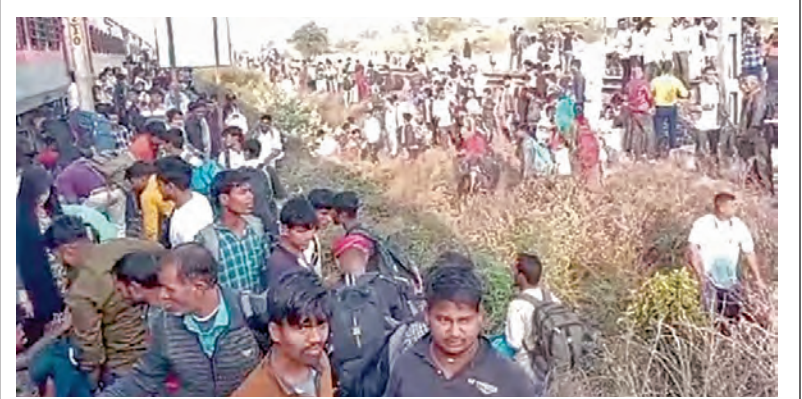
మహారాష్ట్రలోని జలోగావ్ లోని వరదల వల్ల బుధవారం జరిగిన రైలునష్టపూరిత దృశ్యం

పట్టాలపై ఘోరం పుష్కత్ ఎక్స్ ప్రెస్ లో మంటలు వ్యాపించినట్లు వదంతులు.. దూకేసిన ప్రయాణికులపై నుంచి దూసుకెళ్లిన కర్ణాటక ఎక్స్ ప్రెస్ 12 మంది దుర్మరణం.. పలువురికి తీవ్ర గాయాలు జలోగావ్, (మహారాష్ట్ర), జనవరి 22: మహారాష్ట్రలోని జలోగావ్ జిల్లాలో ఘోరమైన రైలు ప్రమాదం జరిగింది. పుష్కత్ ఎక్స్ ప్రెస్ రైలు ప్రయాణికులపైనుంచి మరో రైలు దూసుకెళ్లడంతో ఇప్పటివరకూ 12 మంది పరమార్థమయ్యినట్లు రైల్వే శాఖ ప్రకటించింది. మరో 40 మందికి తీవ్ర గాయాలయ్యాయి. కాగా మృతుల సంఖ్య మరింత పెరిగితే అవకాశం ఉంది క్షణకాలములో చికిత్స నిమిత్తం >>2