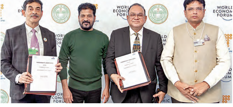
బుధవారం దావోస్ లో సన్ పెట్రో కెమికల్స్ తో కుదిరిన ఎంఓయూ. చిత్రంలో సిఎం రేవంత్, మంత్రి శ్రీధర్ బాబు