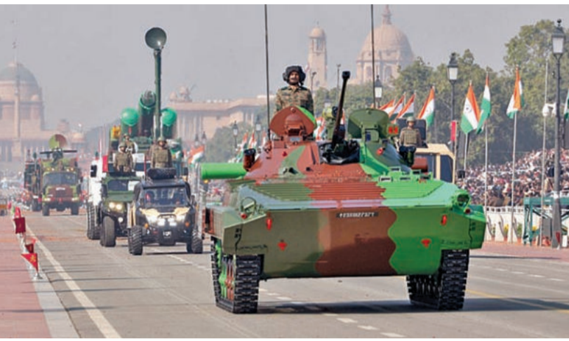
ఆదివారం న్యూఢిల్లీలోని కర్వెట్ పార్క్ లో గణతంత్ర దినోత్సవాల సందర్భంగా సైనిక పాటవ శకటాలను పరిశీలిస్తున్న ముఖ్య అతిథి ఇండోనేసియా అధ్యక్షుడైన ప్రబోవో సుబియాంటో, రాష్ట్రపతి ముర్ము, ప్రధాని మోడీ తదితరులు