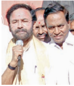
ఆదివారం బిజెపి కార్యాలయంలో మాట్లాడుతున్న కేంద్రమంత్రి కిషన్ రెడ్డి

హైదరాబాద్, జనవరి 26 ప్రభాతవార్త: దేశ ప్రజలకు ఈ గణతంత్ర దినోత్సవం ప్రత్యేకమైనది కేంద్ర మంత్రి కిషన్ రెడ్డి అన్నారు. ఆదివారం బిజెపి రాష్ట్ర కార్యాలయంలో గణతంత్ర దినోత్సవం సందర్భంగా జాతీయ పథకాన్ని కేంద్రమంత్రి కిషన్ రెడ్డి ఆవిష్కరించారు. ఈ సందర్భంగా తెలుగు ప్రజలకు, తెలంగాణ ప్రజలకు హృదయపూర్వక శుభాకాంక్షలు తెలిపారు. రాజ్యాంగ నిర్మాత డాక్టర్ బాబాసాహెబ్ అంబేద్కర్ కి నివాళులర్పించాల్సిన బాధ్యత అందరిపై ఉందన్నారు. నరేంద్ర మోడీ నాయకత్వంలో గత పది సంవత్సరాలుగా అంబేద్కర్ స్ఫూర్తితో పాలన అందిస్తూ దేశ ప్రజలకు సేవలందిస్తున్నారు. కాంగ్రెస్ పార్టీ నాయకుడు రాహుల్ గాంధీ చేతిలో రాజ్యాంగ పుస్తకాన్ని పట్టుకుని తిరుగుతారు. కనీసం రాజ్యాంగాన్ని చదివిన పాపానపోలేదు. రాజ్యాంగాన్ని అవహేళన చేస్తూ ఉంటారు. కాంగ్రెస్ పార్టీ నెహ్రూ హయాం నుంచి రాజ్యాంగాన్ని అవహేళన చేసి, పౌరహక్కులను అణచివేశారో రాహుల్ గాంధీకి అర్థం కాదన్నారు. ఇందిరాగాంధీ ప్రధానమంత్రిగా ఉన్నప్పుడు అలహాబాద్ హైకోర్టు ఆమె ఎన్నికను చెల్లనిదిగా ప్రకటించి, పార్లమెంటు సభ్యత్వాన్ని రద్దు చేసింది. దీంతో రాజ్యాంగాన్ని కాలరాసి, అధికార దుర్వినియోగం చేసి ఇందిరాగాంధీ ఎమ్మర్సన్స్ పెట్టారన్నారు. మీసా చట్టం కింద అనేక మంది రాజకీయ నేతలను అన్యాయంగా అరెస్టు చేశారన్నారు. అటల్ బిహారీ వాజ్ పేయి, లాల్ కృష్ణ అద్వానీ, వెంకయ్యనాయుడు, ఆచార్య కృపలాసి లాంటి అనేక మంది నాయకులను జైలులో పెట్టారన్నారు. మీసా చట్టం కింద దేశాన్ని జైలుగా మార్చి పౌర హక్కులను కాలరాసి, పత్రికాస్వేచ్ఛను హరించి రాష్ట్రీయ స్వయంసేవకీ లాంటి సంస్థలను