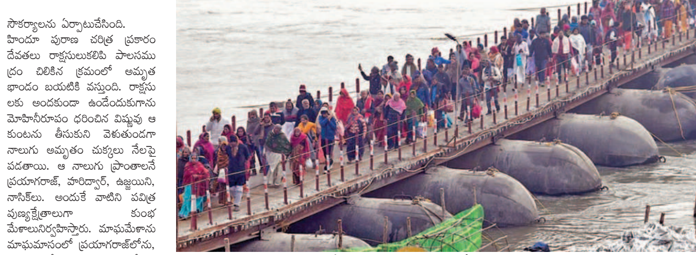
ఆదివారం తండ్ పవతంబులా ప్రయాగ్ రాజ్ కు చేరుకుంటున్న మహాకుంభ భక్తులు

ఆరంభించడం ద్వారా ఆత్మశుద్ధి అవుతుందని, పాపాలనుంచి విముక్తిపొందాలని సమూహం. కీలకమైన స్నానాల్లో 13వ పుష్యపౌర్ణమి సానానం, 15వ మకరసంక్రాంతిసానం, 29వ వాసం అమావాస్యసానం, ఫిబ్రవరి 3న వసంతపంచమి సానానం, ఫిబ్రవరి 12న పుష్యపౌర్ణమిసానం, 26వ తేదీ మహాశివరాత్రి సానానం చివర స్నానంగాచేస్తారు. భద్రత్రాపరమైన ఏర్పాట్లలో లోపాలు రాకుండా మొత్తం 2750 సినిమావీకెటర్లు ఏర్పాటుచేసింది. సమస్తాత్మక ప్రాంతంలో ఎం ఆధారిత కెమెరాలున్నాయి. 80కోట్ల విలువైన టీవీకెమెరాలు ఏర్పాటుచేసింది. 1920 నలభారు ఛానెల్స్ తోపాటు 50 మందితో ప్రత్యేక కాలనీలలో ఏర్పాటుచేసింది. సుమారు 12వేలమందికిపైగా బండ్లబస్సుకు నియమితులవుతున్నారు. వీరుకూడా కొన్ని కేంద్ర బలగాలు కూడా పున్నాయి. నిఘాకోసం డ్రోన్లు, ఎం సాయంతో కెమెరాలను వినియోగిస్తుంది. స్నానాల్లో ఎలాంటి అవకాశం లేకుండా నిఘా కోసం కూడా అందుబాటులో ఉంది. సైబర్ మోసాకులకు తావులేకుండా 56మంది సైబర్ సెక్యూరిటీ నిపుణులు రంగంలో ఉన్నారు. మొత్తం 12 కిలోమీటర్లు తాత్కాలిక ఘాట్లు ఏర్పాటుచేస్తారు. కుంభమేళాకు 40 కోట్లమంది వస్తారని అంచనా. ఒక్కప్రయాగ్ రాజ్ లోనే వసతులకోసం రెండులక్షలకుపైగా బెండ్లు నిర్మించారు. పారిశుధ్యనిర్మాణం 15వేలమందివరకు ఉన్నారు. 50వేల మందికి కనెక్టర్లు పుష్కలమైవేస్తారు. కార్యవర్గకేంద్రాలయిన రష్యా, ఉక్రెయిన్లనుంచి కూడా ప్రయాగ్ రాజ్ కు యాత్రీకులు వచ్చారు. యునెస్కో వారసత్వ ఆధ్యాత్మిక పండుగగా పేరొందిన మహాకుంభలో ప్రతిరోజూ ఒక పవిత్ర ఘట్టమేనని చెప్పుకోవచ్చు.