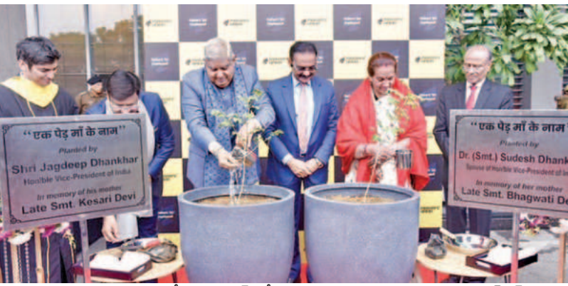
ఆదివారం హర్యానాలోని గురుగ్రామ్ లో మొక్కలు నాటుతున్న ఉపరాష్ట్రపతి ధన్వంజ్