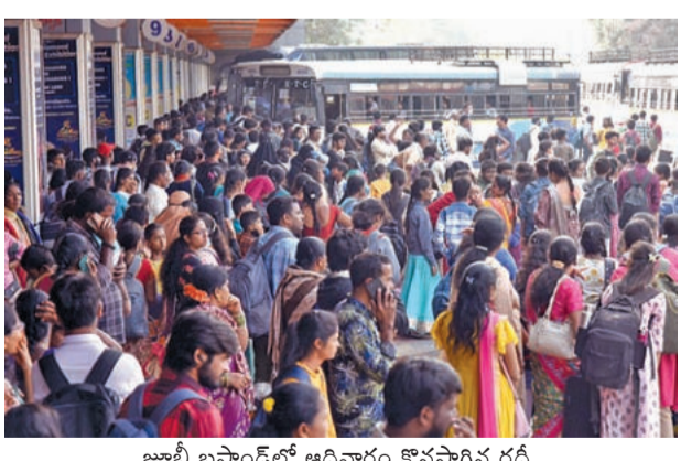
జూబ్లీ హిల్స్ లో ఆదివారం కొనసాగిన రద్దీ