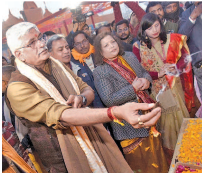
ఆదివారం ప్రయాగ్ రాజ్ లో మహాకుంభ కళ్యాణమను పూజచేసి ప్రారంభిస్తున్న కేంద్రమంత్రి గణేంద్రసింగ్

ప్రభావవర్ధి ప్రధాన ప్రతినిధి, హైదరాబాద్, జనవరి 12: తెలుగు ప్రజలందరికీ ముఖ్యమంత్రి ఎ. రేవంత్ రెడ్డి సంక్రాంతి శుభాకాంక్షలు తెలిపారు. భోగ భాగాలను అందించే భోగి.. కొత్త కాంతులు తెచ్చే సంక్రాంతి.. కనుమ పండుగల అందంగా ఆనందంగా జరుపుకోవాలని ఆశంక్షించారు. రాష్ట్రంలోని దాదాపు కోటి మంది రైతులు, నిరుపేదలు, వ్యవసాయ కూలీ కుటుంబాల్లో ఈ పండుగ కొత్త వెలుగులు తెచ్చిందని అన్నారు. రైతు భరోసాను రూ.12 వేలకు పెంచుతూ పాటు వ్యవసాయ కూలీ కుటుంబాలకు ఇందిరమ్మ ఆర్థిక భరోసా సగటు సాయం, ఆహార భద్రతను అందించే కొత్త రేషన్ కార్డులు, గృహుల తేనె పేదలకు ఇందిరమ్మ ఇళ్లను మంజూరు చేసే నాలుగు సంక్షేమ పథకాల అమలు సంక్రాంతి పండుగ నాది పలుకుతోంది అన్నారు. ప్రతి సంక్షేమ పథకం ఆర్జున వారందరికీ చేరాలనేది తన సంకల్పమని ముఖ్యమంత్రి అన్నారు. వ్యవసాయంలో పాటు ఉపాధి కల్పన, పారిశుధ్య రంగాలన్నింటా తెలంగాణ రాష్ట్రం తిరుగులేని పురోగమనం సాధిస్తుందని ధీమా వ్యక్తం చేశారు. స్వేచ్ఛా సాభాగాలలో ప్రజలందరూ సంతోషంగా తెలుగు సంప్రదాయం ఉట్టిపడేలా సంక్రాంతి పండుగ సంబరాలు జరుపుకోవాలని అన్నారు. పతంగులు ఎగరవేసేటప్పుడు తగిన జాగ్రత్తలు తీసుకోవాలని సూచించారు.