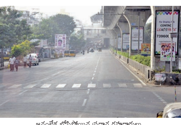
జననలేక బోసిపోయిన ప్రధాన రహదారులు

ఇటు జోరు.. అటు బేజారు బస్ స్టాండ్లు, రైల్వే సేషన్లలో తగ్గని రద్దీ ప్రజలు పల్లెదాట పట్టడంతో బోసిపోయిన రాజధాని రహదారులు ఎవితో పాటు తెలంగాణలోని గ్రామీణ ప్రాంతాలకు చెందిన వారు సైతం హైదరాబాద్ ను వీడి తమ వల్లెలకు పయనమవడంతో గ్రామీణ ప్రాంతాలలో వాహనాల రద్దీ పెరగగా వరుసగా రెండవ రోజు కూడా విజయవాడ జాతీయ రహదారిపై వాహనాల రద్దీ కొనసాగింది. ఈ రద్దీ సోమవారం కూడా కొనసాగి వీలంది. ఈ పరిస్థితులను చక్కదిద్దేందుకు ఆయా ప్రాంతాల పోలీసులు రంగంలో దిగి వాహనదారులకు ప్రత్యామ్నాయ మార్గాలను చూపసాగారు. సంత్రాలి పండ్లగవేళ హైదరాబాద్ లో వుంటున్న ప్రజలు ఎవితో పాటు తెలంగాణలోని తమ సొంత ఊళ్లకు >>2