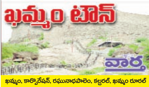
ఖమ్మం, కార్పొరేషన్, రఘునాథపాలెం, కల్లూర్, ఖమ్మం రూరల్