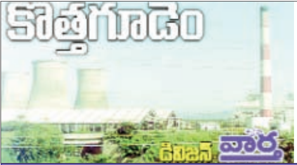
చుంచుపల్లి, జూలూరుపాడు, సుజాతనగర్