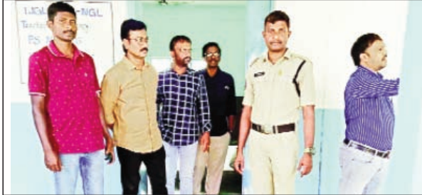
కామేపల్లి, ఫిబ్రవరి 26 ప్రభాతవార్త:

ఓటు హక్కును వినియోగించుకోనున్న 85 మంది ఉపాధ్యాయులు