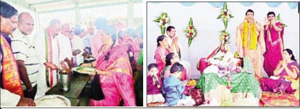
మునగాల ఫిబ్రవరి 26 ప్రభాతవార్త