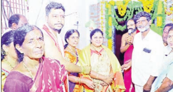
తల్లాడ, ఫిబ్రవరి 26, ప్రభాతవార్త

మండల పరిధిలోని నూతనకల్లోని శ్రీ నాగ మల్లేశ్వరస్వామి వారి ఆలయంలో మహాశివరాత్రి సందర్భంగా స్థానిక శాసనసభ్యులు మట్టా రాగమయి దయానంద్ ప్రత్యేక పూజలు నిర్వహించారు. కాంగ్రెస్