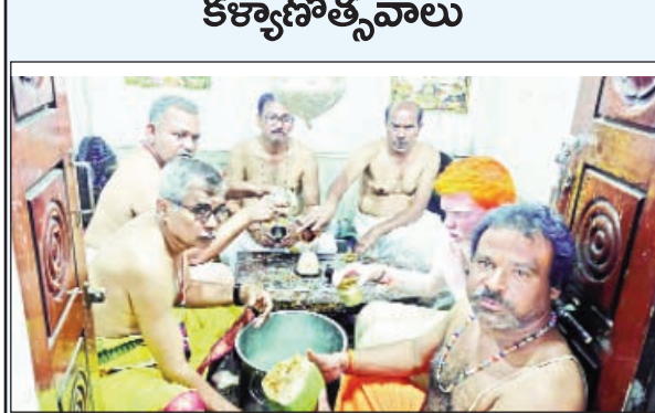
కామేపల్లి, ఫిబ్రవరి 26 ప్రభాతవార్త: