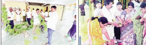
తల్లాడ, ఫిబ్రవరి 26, ప్రభాతవార్త

మండల పరిధిలోని అన్నారగూడెం శ్రీ షిరిడి సాయిబాబా మందిర 17వ వార్షికోత్సవం సందర్భంగా బుద్ధవారం ఆలయంలో మామిడి తోరణాలను అలంకరించి, అభిషేకం, ప్రత్యేక పూజా కార్యక్రమాలు నిర్వహించారు. ఈ సందర్భంగా గ్రామస్థులు పెద్ద సంఖ్యలో పూజా కార్యక్రమాల్లో పాల్గొన్నారు. గత 17 సంవత్సరాల నుండి సాయిబాబా వార్షికోత్సవ కార్యక్రమం కన్నుల పండుగగా జరగనుండగా బుద్ధవారం నుండి శుక్రవారం వరకు కార్యక్రమాలు జరగనున్నాయి. ఈ సందర్భంగా ఆలయంలో సాయనాథునికి పాలాభిషేకం నిర్వహించారు.