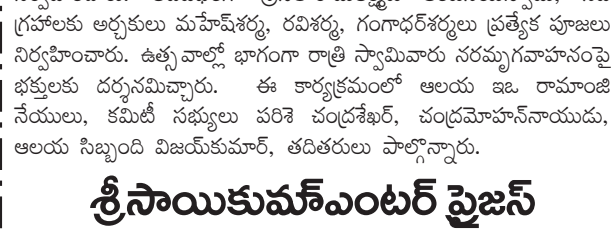
శ్రీ సాయికుమార్ ఎంటర్ ప్రైజ్స్ యజమానులపై చర్యకు డిమాండ్