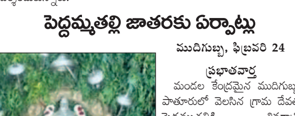
జాతరకు మున్నెన పెద్దమ్మతల్లి