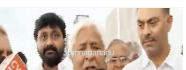
పత్రికాసభలో మాట్లాడుతున్న రాష్ట్ర న్యాయశాఖ మంత్రి హెచ్.కె.పాటిల్

రాష్ట్రంలో ఎటువంటి కారణానికి గ్యాంగుల యోజనలు నిలిపే ప్రయత్నం, నిరంతరంగా కొనసాగుతున్నాయి. త్వరలోనే గృహశాస్త్ర, గృహశాస్త్ర అధికారులకు వారి ఖాతాల్లో డబ్బు జమ చేసేమని రాష్ట్ర న్యాయశాఖ, పర్యావరణ శాఖ మంత్రి హెచ్.కె.పాటిల్ తెలిపారు.