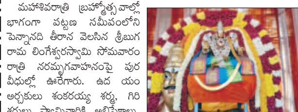
నరమృగవాహనంపై ఊరేగిన పరమేశ్వరుడు