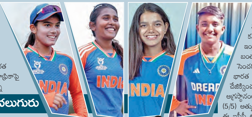
ఐసీసీ టీమ్ ఆఫ్ ది టోర్నీలో నలుగురు

న్యూఢిల్లీ: ఆండర్-19 మహిళల టీ20 ప్రపంచ కప్ను వరుసగా రెండోసారి సాధించిన భారత జట్టులోని పలువురు స్టేయర్లకు అంతర్జాతీయ క్రికెట్ మండలి (ఐసీసీ) టీమ్లో చోటు దక్కింది. ఈ నెల 2వ తేదీన మలేసియాలో జరిగిన ఆండర్ టీ20 వరల్డ్ కప్ టైటిల్ పోరులో నీకే ప్రసాద్ నేతృత్వంలోని భారత అమ్మాయిల జట్టు తొమ్మిది వికెట్ల తేడాతో దక్షిణాఫ్రికాపై జయభేరివేసింది సంగతి తెలిసింది. ఈ టోర్నీ