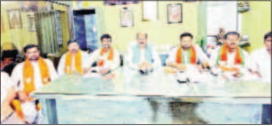
ఉమ్మడి కరీంనగర్ ఆదిలాబాద్ మెడక్ నిజామాబాద్ బిజెపి పట్టణద్రుల ఎమ్మెల్సీ బిజెపి