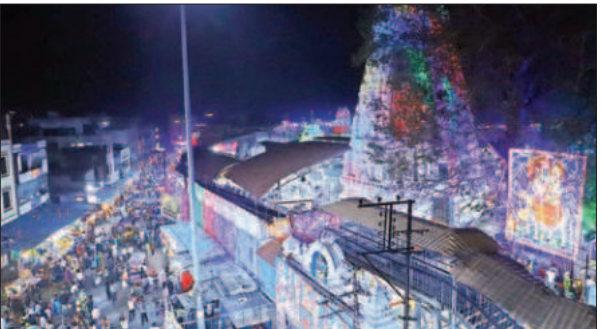
మొదటి పేజీ తరువాయి..

ఇప్పటికే ఆలయంలో జాతర ఏర్పాట్లు చక్కచక్క కొనసాగుతున్నాయి. వేములవాడకు చేరుకునే ఐదు ప్రధాన రహదారుల్లో భక్తులకు స్వాగతం పలికేందుకు భారీ స్వాగత తోరణాలు ఏర్పాటు చేశారు.