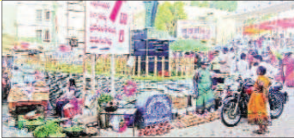
కోరుతున్నారు ఈ షాపులు ఎవరి పర్మిషన్ తో వెలిశాయో ఇంతవరకు అర్థం కావడం లేదు ఇప్పటికైనా మున్సిపల్ అధికారులు స్పందించి ఈ షాపులను తొలగించాలని పలువురు ఆవేదన వ్యక్తం చేస్తున్నారు

వేములవాడలోని దక్షిణ కాశీగా పేరు పొందిన శ్రీ రాజరాజేశ్వర స్వామి ఆలయ ముందు భాగంలో ఏర్పాటు చేసిన అంబేద్కర్ విగ్రహం చుట్టూ షాపులు వెలిసాయి అసలే ఆలయం ముందు ట్రాఫిక్ ఇబ్బందులు రాజన్న భక్తులు ఎదుర్కొంటున్నారు దీనికి తోడుగా ఇప్పుడు షాపులు వెలవడం ద్వారా యాత్రికులకు ఇంకా ఇబ్బంది గురయ్యే అవకాశం ఉంది ఈ షాపులు ఎవరి పర్మిషన్ తో పెట్టారో ఇంతవరకు తెలవదు ఇప్పటికైనా ఈ షాప్ లో తొలగించి రాజన్న భక్తులకు ఇబ్బంది కలగకుండా చూడాలని ప్రజలు