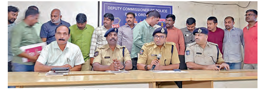
అధికారం మీడియా సమావేశంలో మాట్లాడుతున్న మాదాపూర్ డిసిపి ఐ.సి.కె. క్రెం డిసిపి సరసింపా హైదరాబాద్ శివార్లలో కాల్పుల ఘటన

ధీల్లీ ఎన్నికల ప్రచారంలో ప్రధాని మోడీ స్వాగతి, ఫిబ్రవరి 2: దేశవారితో అత్యంత ఫ్రెండ్లీ బడ్జెట్ కు బడ్జెట్ అని ప్రధాని మోడీ అన్నారు. ధీల్లీ ఎన్నికల ప్రచారంలో ఆయన మాట్లాడుతూ రూ.12 లక్షల ఆదాయం ఉన్నవారికి ఇంత భారీ ఉపకమనం ఎప్పుడూ లేదని చెప్పతూ ధీల్లీకి అతిపెద్ద ఆపద 'ఆమ్ బి' అని ప్రభుత్వం 11 ఏళ్ల వుభావేసింది అన్నారు. నెహ్రూకాలంలో ఎవరి కైనా రూ.12 లక్షల ఊతం ఉంటే అందులో పావు వంతు వస్తుకోపోతున్నదని, ఒకవేళ నేడు ఇందిరా గాంధీ పాలన ఉంటే అదే జీతానికి రూ.10 లక్షలు వస్తు చెల్లింపాల్సి వచ్చేదని ఎద్దేవాచేశారు. 12 ఏళ్లక్రితం కాంగ్రెస్ హయాంలో కూడా ఆ మొత్తానికి రూ.2.60 లక్షలు వస్తుగా పోయేదని ఇప్పుడు ఆ పరిస్థితి లేదని ప్రధాని అన్నారు. పెదలు రైతులు యువత మహిళల సాధికారతకు మోడీ ఇచ్చిన గౌరవాలను ఈ బడ్జెట్ నెరవేరుస్తున్నదని భరోసా ఇచ్చారు. ఈసారి దేశరాజధానిలో డబ్బులంజినే సర్కారు ఏర్పరుతుందని ధీమా వ్యక్తంచేశారు. బిజెపిపై కేబ్రెవాలిపోతే తప్పుడు ప్రచారంచేస్తోందని తాము మురికివాడలను కూల్చేయబోమని పథకాలను నిలిపివేయబోమని తెలిపారు.