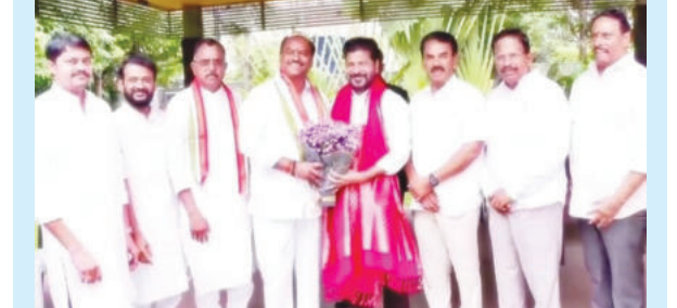
సీఎం రేవంత్ రెడ్డి ని కలిసిన బీఆర్ఎస్ ఎమ్మెల్యే కృష్ణమోహన్ రెడ్డి