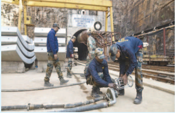
సహాయ చర్యల్లో ఎన్సీఆర్ఎఫ్ బృందాలు

కింద నలిగిపోయినట్లుగా అనుమానాలు వ్యక్తం చేస్తున్నారు. ప్రభుత్వం అధికారికంగా ఇంకా ఎలాంటి ప్రకటన చేయలేదు. ప్రమాద స్థలంలో 140మీటర్ల మేర శిథిలాలు పేరుకుపోయినట్లు రెస్క్యూ బృందాలు చెబుతున్నాయి. నేడు ఏడో ప్రయత్నంగా వెళ్లి బండరాళ్లు, తుక్కు తోలగించాలని నిర్ణయించినట్లు అధికారులు తెలిపారు. ఎన్సీఆర్ఎఫ్, ర్యాట్ల హోల్ మైనర్ల బృందాలతోనే తవ్వకాలు జరపుతున్నారు. ర్యాట్ల హోల్ మైనర్స్ 14మంది టీం ఇన్చార్జ్ ఫెలోజ్ మాట్లాడుతూ ఆపరేషన్ అతి క్లిష్టంగా ఉందని వెల్లడించారు. ఎన్సీఆర్ఎఫ్ నిపుణులు, మరో టీఎస్ఎస్ బృందం రంగంలో దిగనున్నట్లు మంత్రులు చెప్పారు. సారంగం కాలిన ఘటనపై ఎన్సీఆర్ఎఫ్ దక్షిణాది విభాగం నివేదిక కోరింది. ఇదిలా ఉండగా సారంగం ప్రమాదం జరిగి ఐదు రోజులు గడిచినా అధికారులు ఏమీ చెప్పక, ఎలా ఉన్నారో.. తెలియక తమవారి క్షేమ సమాచారం కోసం కుటుంబసభ్యుల తల్లడితున్నారు. బురద మొత్తం ఒక్కసారిగా తీసి ప్రయత్నం చేసినా తిరిగి ఒక్కసారిగా కూలే ప్రమాదం ఉంటుందని అలాంటి చర్యలకు పూనుకోవడం లేదని నిపుణులు చెబుతున్నారు. గురువారం ప్రభుత్వం అధికారికంగా ప్రకటన చేసే అవకాశం ఉన్నట్లు సమాచారం.