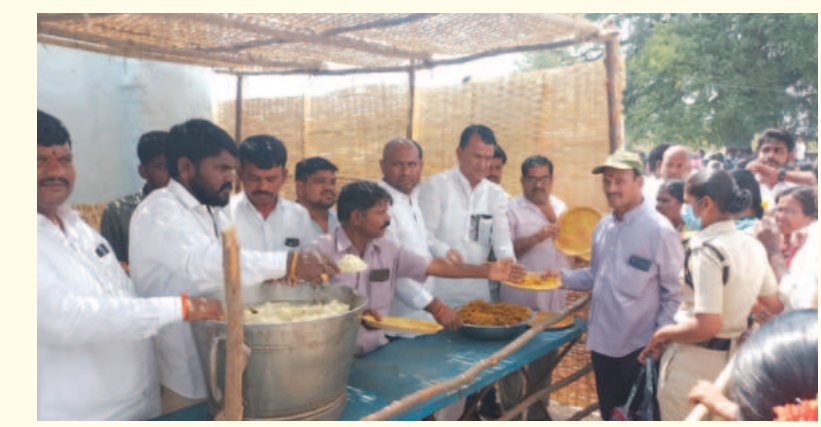
భక్తులకు అన్నదానం కార్యక్రమం ప్రారంభమైన పలువురు నాయకులు

లో ఎలాంటి అవాంఛనీయ సంఘటనలు చోటు చేసుకోకుండా 50 మంది పోలీసులతో భద్రత ఏర్పాటు చేశారు. అన్నదానం ఏర్పాటు.. బ్రహ్మాత్మ వాల సందర్భంగా ప్రతి సంవత్సరం మార్చిలో ఈ భక్తులు పెద్ద ఎత్తున పాల్గొని ప్రత్యేక అభిషేకాలు, యాజ్ఞాలలో పాల్గొన్నారు. బ్రహ్మాత్మ వాలు