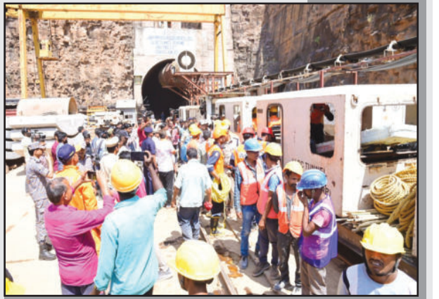
సమావేశంలో ఎన్ఎల్టీసీ టన్నెల్