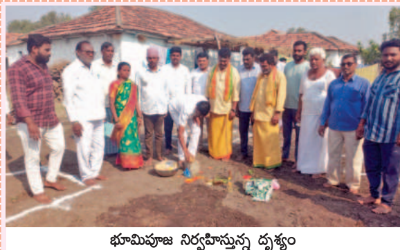
భూమిపూజ నిర్వహిస్తున్న దృశ్యం