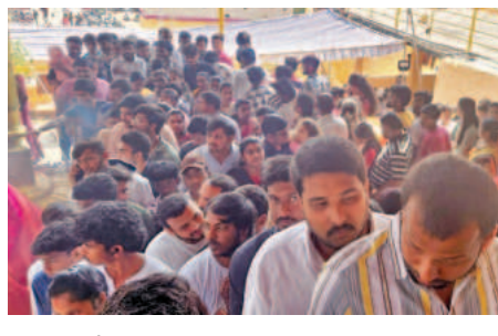
రామలింగేశ్వర స్వామి ఆలయానికి విచ్చేసిన భక్తులు

తలకొండపల్లిలో... తలకొండపల్లి, కొడంగల్, ఫిబ్రవరి 26 ప్రభాతవార్త : గ్రామపంచాయతీ లోని మల్లన్నగుట్ట బ్రహ్మాత్మ వాల సందర్భంగా అంగరంగ వైభవంగా ప్రసాదించిన మల్లికార్జున స్వామి కళ్యాణోత్సవమును వేద పండితులు మంత్రోచ్ఛారణల