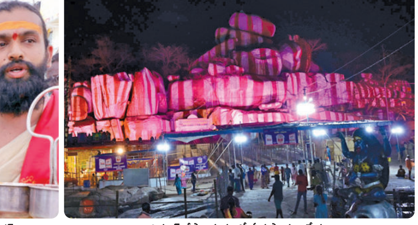
విద్యుత్ దీపాలకరణలో ఏడుపాఠాలు క్షేత్రం