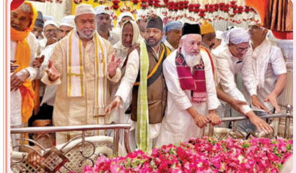
దర్గాల్ గంధం సమర్పిస్తున్న మంత్రి