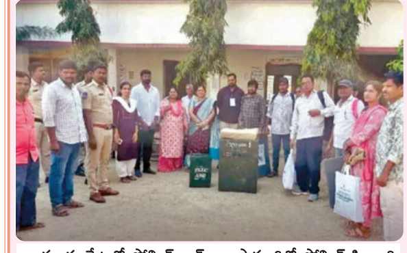
రామాయంపేటలో పోలీస్ బాక్సులు, సామాగ్రితో పోలీస్ సిబ్బంది

మెడక్, నిజామాబాద్, ఆదిలాబాద్, కరీంనగర్ జిల్లాల పట్టణాలకు, ఉపాధ్యాయ ఎమ్మెల్యే ఎన్నికలకు ఏర్పాటు సర్దుం సిద్దుయ్యాయి. గురువారం నాడు ఉదయం 8 గంటలకు ప్రారంభం పొందాన్ని పోలీస్ గాను పోలీస్ కేంద్రాలకు పోలీస్ సామాగ్రి చేరుకున్నాయి. రామాయంపేట మండల కేంద్రంలోని ప్రభుత్వ జూనియర్ కళాశాలలో ఏర్పాటు చేసిన పోలీస్ కేంద్రానికి బుధవారం నాడు పోలీస్ బాక్సులు, సామాగ్రిని పోలీస్ సిబ్బంది తీసుకువచ్చారు. ఇందుకు పోలీసులు భారీ భద్రత ఏర్పాటు చేశారు. అందుకు అధికారులు అన్ని ఏర్పాట్లు పూర్తి చేశారు. సజావుగా పోలీస్ కేంద్రాలకు పోలీస్ సామాగ్రి చేరుకున్నాయి. గరులను ఏర్పాటు చేశారు. కాగా మండలంలో 950 మంది పట్టణాలకు ఓటర్లు, 81 మంది ఉపాధ్యాయ ఓటర్లు గురువారం నాడు తమ ఓటు హక్కును వినియోగించుకోనున్నట్లు గురువారం నాడు తమ ఓటు హక్కు తెలిపారు. పోలీస్ కేంద్రం వద్ద భద్రత దృష్ట్యా 100 మీటర్ల దూరం వరకు అడ్డవు నిలిపినట్లు పోలీసులు తెలిపారు.