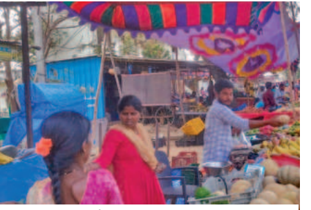
కొండుపల్లి మండల కేంద్రంలో పట్టణ కొనుగోలు చేస్తున్న భక్తులు