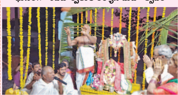
నాచగిరిలో శివపార్వతుల కళ్యాణం జరిపిస్తున్న అర్చకులు