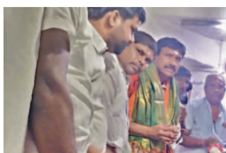
పూజాల్లో పాల్గొన్న మాజీ ఎమ్మెల్యే నరేందరెడ్డి