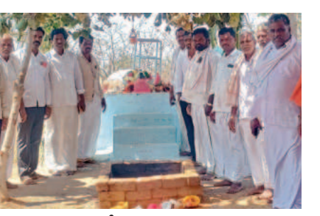
ప్రతిష్ఠాపన కార్యక్రమంలో పాల్గొన్న నాయకులు, గ్రామస్థులు