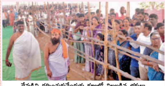
దేవుడిని దర్శించుకునేందుకు క్యూలో నిలబడిన భక్తులు

నందిగూడ బ్యారో ఫిబ్రవరి 26 ప్రభాతవార్త : మహాశివరాత్రిని పురస్కరించుకొని బుధవారం నందిగూడలోని దేవాలయాలు భక్తులతో కిటికీలూడినాయి. భక్తులు ఉదయం నుంచే దర్శించుకోవడానికి దేవాలయాలకు చేరుకున్నారు. నంగారెడ్డి మండలం పసలూడి గ్రామ పరిధిలోని జ్యోతిర్ వాస్తు విద్యాపీఠంలో ఏర్పాటుచేసిన ఒక కోటి 8 లక్షల రుద్రాక్షలతో తయారుచేసిన శివలింగానికి అభిషేకం, ప్రత్యేక పూజలు నిర్వహించారు. శివలింగానికి భక్తులు అభిషేకం చేసే సౌకర్యాన్ని నిర్వాహకులు కల్పించారు. అనంతరం రుద్రాక్షలను భక్తులు వితరణ చేశారు. విద్యాపీఠానికి వచ్చే భక్తులకు ఎలాంటి ఇబ్బందులు కలగకుండా సౌకర్యాలను ఏర్పాటుచేశారు. నంగారెడ్డి ప్రకాంత్ నగర్ లోని ఉపనాథేశ్వర దేవాలయంలో కూడా భక్తులు ఉదయం నుంచి దేవాలయానికి చేరుకొని అభిషేకాలు ప్రత్యేక పూజలు నిర్వహించారు. మహాశివరాత్రి జాగరణ సందర్భంగా నంగారెడ్డిలోని అంబేద్కర్ స్టేడియంలో సంస్కృత కార్యక్రమాలు నిర్వహించేందుకు భారీ ఏర్పాట్లు చేశారు.