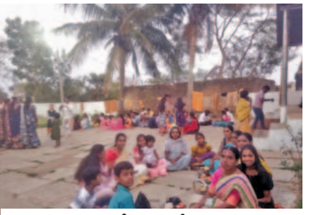
కడవూరు శివాలయంలో ఉపనాథ దీక్షలు విరమిస్తున్న భక్తులు