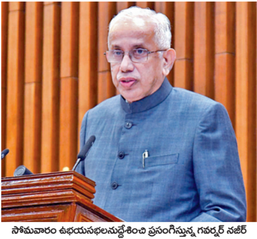
సోమవారం ఉభయసభల సందేశంపై ప్రసంగిస్తున్న గవర్నర్ నజీర్

జీవన ప్రమాణాలు పెంచే పలు సంక్షేమ పథకాలు గత ప్రభుత్వం నిలిపిన 93 కేంద్ర పథకాల్లో 74 పునరుద్ధరించాం రూ.2.68 లక్షలకు పెరిగిన తలసరి ఆదాయం ఉభయసభల ప్రసంగంలో గవర్నర్ నజీర్ అసెంబ్లీలో 11వ బ్లాక్ కు పరిమితమైన వైఎస్సార్ల సభ్యులు విజయవాడ, ఫిబ్రవరి 24 ప్రభాతవార్త ప్రతినిధి: ప్రజల జీవన ప్రమాణాలు పెంచే పథకాలు ప్రవేశపెట్టామని, ఆర్థిక అందరికీ సొంతిష్ట ఉండాలనేది మా ఆశాకాంక్ష అని గవర్నర్ జస్టిస్ నయ్యర్ అబ్దుల్ నజీర్ అన్నారు. ప్రజలకోరిక మేరకు కూటమి ప్రభుత్వం ఏర్పాటుచేసి సోమవారం ఆంధ్రప్రదేశ్ బడ్జెట్ సమావేశాలు ప్రారంభమయ్యాయి. ఉభయ సభలను ఉద్దేశించి గవర్నర్ ప్రసంగించారు. గత ఐదేళ్లలో రాష్ట్రం అనేక ఇబ్బందులకు గురైందని, గత ప్రభుత్వ పాలనలో రాష్ట్రం ఎంతో నష్టపోయిందని గవర్నర్ వ్యాఖ్యానించారు. సూపర్ సిక్స్ పథకాల ద్వారా ప్రజలకు >>2