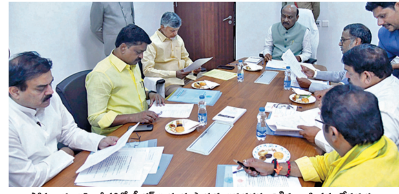
సోమవారం అసెంబ్లీ హాల్లో స్పీకర్ లయ్యన్న పాత్రుడు అధ్యక్షతన జరిగిన బిఎస్ సమావేశ దృశ్యం

ఆ ఊరికి అంబులెన్సొచ్చింది.. హార్షం వ్యక్తం చేసిన ప్రజలు హిరమండలం(శ్రీకాకుళం జిల్లా), ఫిబ్రవరి 24 ప్రభాతవార్త: శ్రీకాకుళం జిల్లా గిరిజన గ్రామాల్లో డోలీ బాధల నుంచి ఉపశమనం లభించింది. మూలముల గ్రామంలో ప్రజలకు రోగం వస్తే డోలీయే వారికి దిక్కు. అటువంటి డోలీ కష్టాలు తీరనూర్చాయి. ఇటీవల కూటమి ప్రభుత్వం ఆధికారంలోకి వచ్చాక మహాత్మాగాంధీ జాతీయ గ్రామీణ ఉపాధిచేయి పథకం మెడీరియల్ కాంపోసెంట్ నియంత్రం వెండర్ వ్యవస్థ ద్వారా రహదారి నిర్మాణాలు చేపట్టారు. ఇదే తరహాలో ఇటీవలే పరిధిలో నిర్మాణం చేపట్టారు. ముఖ్యమంత్రి చంద్రబాబు నాయుడు, >>2