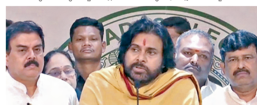
సోమవారం మీడియా పాయింట్ వద్ద మాట్లాడుతున్న డిప్యూటీ సీఎం పవన్ కల్యాణ్

విజయవాడ ఫిబ్రవరి 24 ప్రభాతవార్త ప్రతినిధి: ప్రతిపక్ష హోదా అడిగితే ఇప్పటికే కాదని ప్రజలు ఇప్పటి వరకు ఏమీ డిమాండ్ చేసినా పవన్ కల్యాణ్ అన్నారు. అత్యధిక మెజారిటీలో రెండో స్థానంలో ఉన్న పార్టీకి ప్రతిపక్ష హోదా ఇస్తారన్నారు. ఈ విషయంలో వైకాంగ్రెస్ పార్టీ సభ్యులు హుందాగా ప్రవర్తించాలని హితవు పలికారు. ఆసెంబ్లీ సమావేశాల సందర్భంగా మీడియా పాయింట్ వద్ద పవన్ మాట్లాడారు. వైకాపా సభ్యులు ప్రతిపక్ష హోదా కోరుతున్నారని, సభలో రెండో అతిపెద్ద పార్టీ జనసేన మాత్రం ఒక్కో సీటు ఎక్కువ వచ్చినా వాళ్లకి ఆ హోదా దక్కేది. ప్రతిపక్ష హోదా ఇవ్వకపోతే సభను >>2