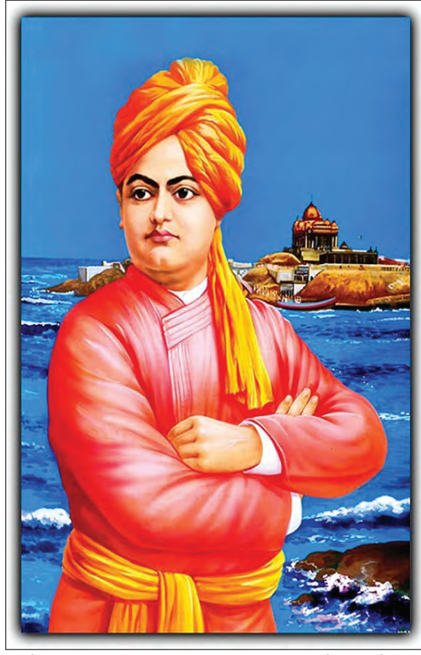
उनके आदर्श वाक्य का भाव बालक स्वामी विवेकानंद से शिक्षा पर बाते कर रहे थे उनसे उन्होंने कहा क्या तुम में से कोई बता सकता है कि शिक्षा क्या होती है ?

स्वामी विवेकानंद ने कहा कि शिक्षा का अर्थ लोगों को खुद पर भरोसा रखने और अपनी पूरी क्षमता तक पहुंचने के लिये प्रोत्साहन देना है। जीवन का उद्देश्य समाज और दूसरों की निस्वार्थ सेवा है। लोगों को अपनी ताकत पर ध्यान केंद्रित करने और चुनौतिपूर्ण परिस्थितियों में भी पाजिटिव नजरिया रखने के लिये प्रोत्साहित करना है। शिक्षा को सुलभ होना चाहिये जिससे परसनालिटी का विकास हो इसके लिये कड़ी मेहनत और अनुशासित रहने की सीख दी। ज़िंदगी में लक्ष्य निर्धारित कर उनको अथक प्रयास करने के लिये इंकरेज किया, निडर और दयालु बनने की शिक्षा दी जिससे कि व्यक्तित्व में सेवा, संस्कार, सहृदयता और सहिष्णुता का भाव बड़े। स्वामी विवेकानंद के अनुसार करुणा खुशी और आध्यात्मिक विकास की कुंजी है। उनकी शिक्षाओं का प्रमुख पहलू आत्म साक्षात्कार और व्यक्ति में बसी क्षमताओं की खोज करना है उनका आदर्श वाक्य "उठो, जागो और तब तक मत रुको जब तक लक्ष्य प्राप्त न हो जाए" आज भी असंख्य लोगों को प्रेरित करता है। आत्मविश्वास, आत्मनुरागण और आत्मनुरागण पर बल दिया