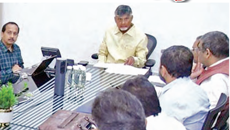
గురువారం పి 4 అధికారులతో సమీక్ష సమావేశంలో ముఖ్యమంత్రి చంద్రబాబు సీఎమ్ నాయుడు గురువారం ఉండవల్లిలోని తన నివాసంలో శాశ్వతమైన సమావేశాన్ని నిర్వహించారు. ఈ సందర్భంగా రాష్ట్ర ప్రభుత్వం నిరం తరం పేదరికం నిర్మూలనే కీలకంగా వ్యవహరిస్తోందన్నారు. 1995లోనే స్వయం సహాయక బృందాలను రాష్ట్ర ఆర్థిక కార్యకలాపాల్లో కీలక భాగంగా చేసి జాతీయ పోలీసులతో కలసి కీలకంగా వ్యవహరిస్తోందన్నారు.

ఉగాదినంచిన నాలుగు గ్రామాల్లో పైలట్ ప్రాజెక్ట్గా పి-4 అమలు అట్టడుగు ప్రజలకు సంపన్నత తోడ్పాటు రూ. 16 లక్షల కోట్లకు విస్తరించిన రాష్ట్ర ఆర్థిక వ్యవస్థ: సమీక్షలో సిఎం చంద్రబాబు విజయవాడ, ఫిబ్రవరి 27 ప్రభాతవార్తా ప్రతినిధి: విధానాన్ని ప్రవేశ పెడుతున్నట్లు తెలిపారు. రాష్ట్ర ఆర్థికవ్యవస్థను కన్న పేదల సాధికారత కోసం రాష్ట్ర ప్రభుత్వం ప్రతిపాదిస్తున్న పీ4 కార్యక్రమానికి ఊపిడుగు సుబ్బారాంజన్ ప్రతినిధిగా సీఎం చంద్రబాబునాయుడు పునరుద్ధరించారు. పేదలను ఆర్థికంగా బలోపేతం చేసేందుకు పీ4