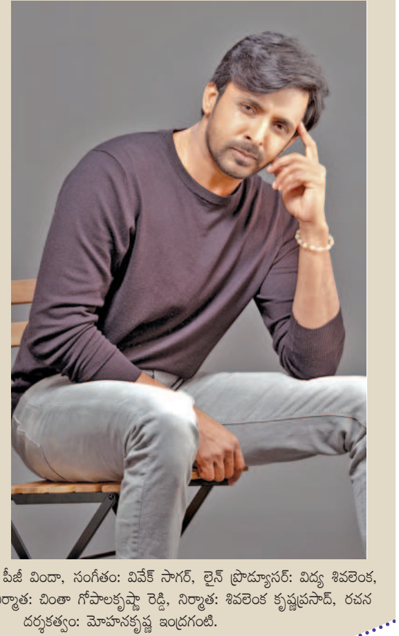
అఫ్ షోటోగ్రఫీ: పీజీ విద్యా, సంగీతం: వివేక్ సాగర్, లైన్ ప్రొడ్యూసర్: విద్య శివరెంక, సహా నిర్మాత: వింకా గోపాలకృష్ణ రెడ్డి, నిర్మాత: శివరెంక కృష్ణప్రసాద్, రచన దర్శకత్వం: మోహనకృష్ణ ఇండ్రగంటి.