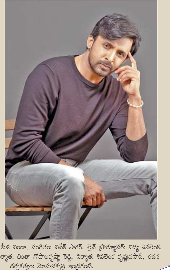
అఫ్ షోటోగ్రఫీ: పీజీ విద్యా, సంగీతం: వివేక్ సాగర్, లైన్ ప్రొడ్యూసర్: విద్య శివరాత్రి, సహ నిర్మాత: వింకా గోపాలకృష్ణ రెడ్డి, నిర్మాత: శివరాత్రి కృష్ణప్రసాద్, రచన దర్శకత్వం: మోహనకృష్ణ ఇండ్రగంటి.

మాట్లాడుతూ, 'వేసవి సెలవుల్లో కుటుంబమంతా కలిసి వెళ్లి చూసే చరిత్ర హాస్య చిత్రం మా 'సారంగపాణి జాతకం'. మా దర్శకులు మోహనకృష్ణ ఇండ్రగంటి అద్భుతంగా తీశారు. సినిమా చిత్రీకరణ, డబ్బింగ్ కార్యక్రమాలు సైతం పూర్తయ్యి షూట్ ప్రొడక్షన్ పనులు తుది దశకు చేరుకున్నాయి. మనవి భవిష్యత్తు చేతి రేఖల్లో ఉంటుందా? లేదా చేసే చేతల్లో ఉంటుందా? అనే ప్రశ్నకు జవాబు ఇస్తూనే ఇంటిల్లిపాడిని కడుపుబ్బా నవ్వించే వివేదాత్మక చిత్రమిది. అద్భుతం కట్టిపడేస్తూనే, వచ్చే ఎండలకి స్వాంతనాల అందరినీ అలరిస్తుంది సినిమా' అని అన్నారు. ప్రియదర్శి ఫులికొండ, రూప కొంచావారూ బంటగా నటించిన ఈ సినిమాలో 'నరేష్ విజయకృష్ణ, తనికెళ్ళ భరణి, శ్రీనివాస్ అవసరాల, 'వెన్నెల' శ్రీకాంత్, 'వైవా' హర్ష శివనారాయణ, అశోక్ కుమార్, రాజా వెంకటే, వడ్లమాని శ్రీనివాస్, ప్రదీప్ రుద్ర, రమేష్ రెడ్డి, కల్పలత, రూపకృష్ణ, హర్షిణి, కె.ఎల్.కె. మణి, 'ఐమ్ డ్యాన్స్' వెంకట్ ఇతర ప్రధాన తారాగణం. ఈ చిత్రానికి మేకప్ బీఫ్: ఆర్.కె వ్యామజాల, కాస్ట్యూమ్ బీఫ్: ఎన్. మనోజ్ కుమార్, కాస్ట్యూమ్ డిజైనింగ్: రాజేష్ కామర్లు, అశ్వినీ, మార్కెటింగ్: టాక్ నూస్, టీఆర్.ఎస్. పులగం చిన్నారాయణ, ప్రొడక్షన్ ఎగ్జిక్యూటివ్స్: కె. రామాజనీయులు (అంజ బాబు) పి రషీద్ అహ్మద్ ఖాన్, కో డైరెక్టర్: కోట సురేష్ కుమార్, పాటలు: రామజోగయ్య శాస్త్రి, స్టంట్స్: వెంకట్, వెంకటేశ్, ప్రొడక్షన్ డిజైనింగ్: రవీందర్, ఎడిటింగ్: మల్లాండ్ కె. వెంకటేశ్, డైరెక్టర్