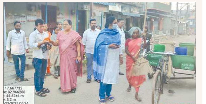
కసింకోట, ఫిబ్రవరి 23, ప్రభాతవార్త