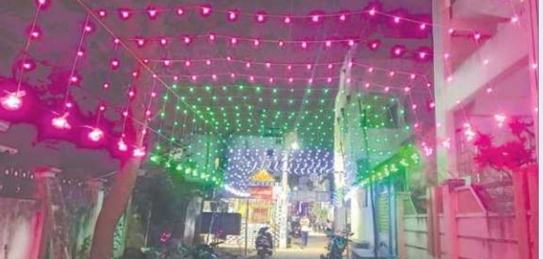
తరలివెలపల్లి భక్తులు (నకృపల్లి, ప్రభాతవార్త)