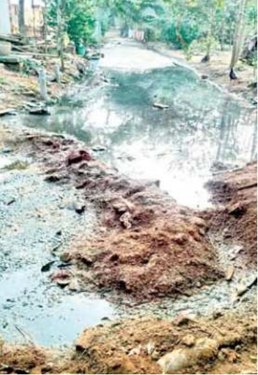
అభివృద్ధికి ఆమడ దూరంలో బాడాం

కొండలావేరు పంచాయతీ మధుర గ్రామమైన బాడాంలో గత కొన్నేళ్లగా కాలువలు లేక అపారితవ్య గ్రం రాజ్యమేలుతుంది. మురికి నీరు సిసి రోడ్లపై వదలడంతో పేరుకు పోయి నామపట్టి దుర్వాసన వెదజల్లుతుంది. ఈ రోడ్లపై వృద్ధులు, విద్యార్థులు సిసి రోడ్లపై వచ్చిన నామ మూలంగా జారి ప్రమాదం జారిన పడుతున్నారు. అయితే కొత్త ప్రభుత్వం వచ్చిన తరువాత గ్రామీణ ప్రాంతాల్లో పట్టె వండుగ వసల్లో భాగంగా వీధి కాలువలు, సిరి రోడ్లు నిర్మిస్తామని హామీ ఇవ్వడం జరిగింది. అయితే అక్కర నిధులు మంజూరవ్వడంతో వీరి ఆశలు అడియూగానే మిగిలాయి. పట్టె వండుగ వసల్లో భాగంగా బాడాం గ్రామానికి 15 లక్షల మాత్రమే మంజూరైంది. అయితే ఈ 15లక్షలతో ప్రధాన రహదారికి ఇరువైపులా కాలువలు నిర్మించారు. ప్రత వీధిలో సిసి రోడ్లకు ఇరువైపులా కాలువలు లేకపోవడంతో మురికి నీరుతో దుర్భందాన్ని వెదజల్లుతున్నాయి. ప్రజలు వ్యాధులు బారిన పడుతున్నారు. ఎన్నికల కోడే ముగిసిన తరువాత అయినా తమ గ్రామాలకు మోక్షం కలుగుతుందో లేదో వేచి చూడాలి.