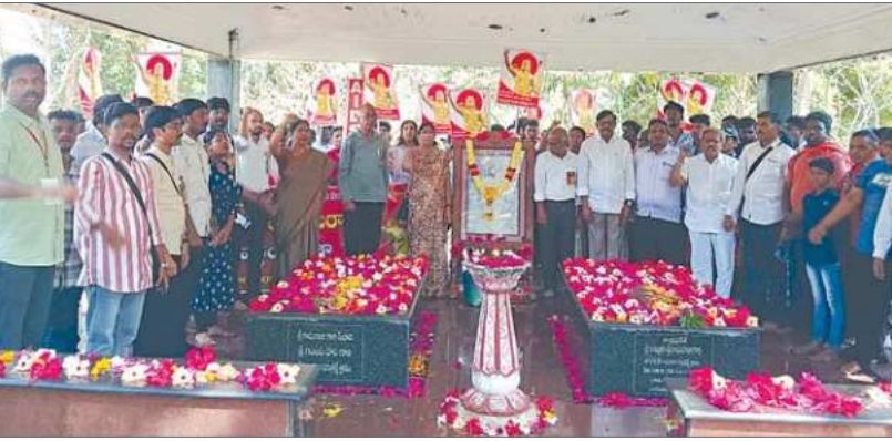
గొలుగొండ ఫిబ్రవరి 23, ప్రభాతవార్త