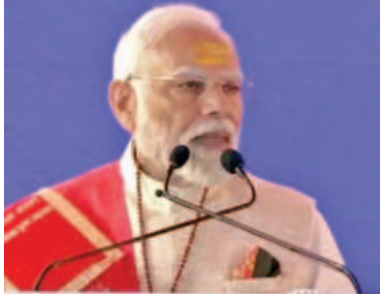
మతం సంస్కృతి, సూత్రాలపై దాడి కొనసాగిస్తున్నారన్నారు. వీరు మన పంచులు సాం