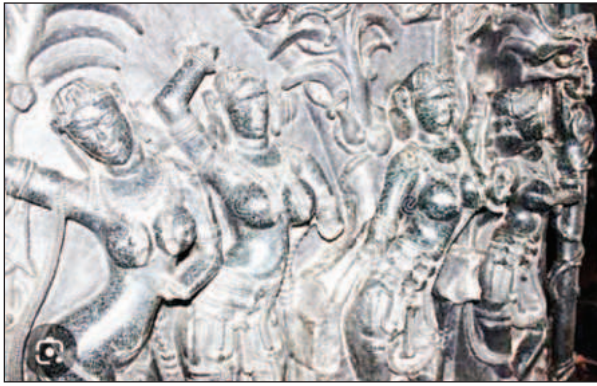
కల్పించేందుకు ప్రభుత్వం ఆధ్వర్యంలో అధికారులు చర్యలు తీసుకుంటున్నారు.