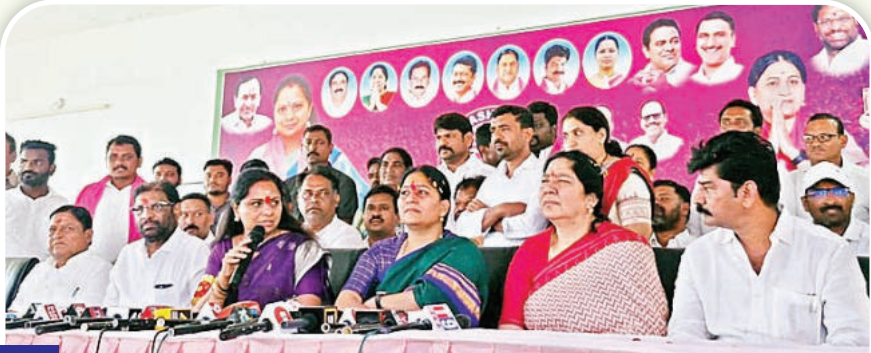
16లో.. ఎమ్మెల్యే కల్యాణకుంట్ల కవిత