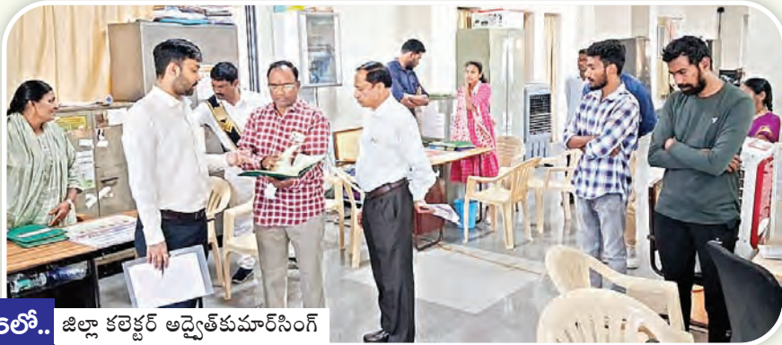
16లో.. జిల్లా కలెక్టర్ ఆధ్వర్యంలో కార్యక్రమం