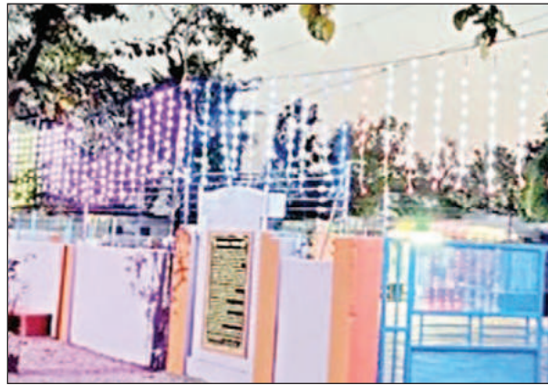
అదేవిధంగా మూడు రోజుల పాటు నిర్వహిస్తున్న ఈ ఉత్సవాలలో భక్తులు పెద్దెత్తున పాల్గొని విజయవంతం చేవాలని కోరుతున్నారు.

నిర్వహించనున్నారు. ఈ వేడుక తర్వాత ఆలయ కాపరి వీరభద్రహెచ్చరిక, లింగోద్భవ వేడుక, రుద్రాభిషేకాలు అర్చనారాత్రి వరకు కొనసాగుతాయి. ఆ తర్వాత ఆలయ ప్రాంగణంలో భక్తులు జాగరణ చేస్తారు. ఉత్సవాల నిర్వహణకు సహకరిస్తున్నవారికి కృతజ్ఞతలు తెలుపుతున్న కమిటీ ప్రతినిధులు ఇంకా భాగస్వాములు కావడానికి ముందుకు రావాలని,