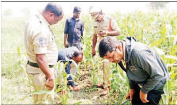
దుగ్గొండి, ఫిబ్రవరి 27, ప్రభాతవార్త