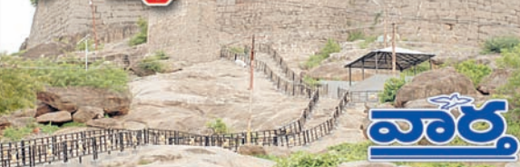
ఖమ్మం, కార్పొరేషన్, రఘునాథపాలెం, కల్లరల్, ఖమ్మం రూరల్