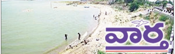
నేలకొండపల్లి, ఖమ్మం రూరల్, కూసుమంచి, తిరుమలాయపాలెం