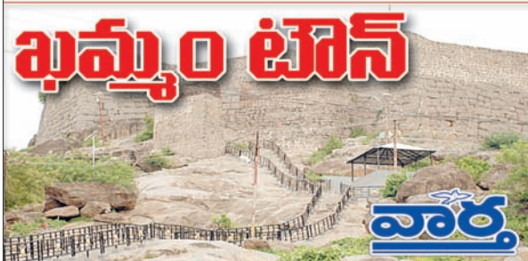
ఖమ్మం, కార్పొరేషన్, రఘునాథపాలెం, కల్లరల్, ఖమ్మం రూరల్

భయభ్రాంతులకు గురిచేసి అధికార దుర్వినియోగానికి పాల్పడితే కటకటాల పాలైన సంగతి నగర ప్రజలకు ఎలా మరచి పొతారని హెళన చేశారు. బి ఆర్ ఎస్ హాయం లో నగర అధ్యక్షులు చేసిన అక్రమాల చిట్టా తో బహిరంగ చర్చకు ఆధారాలతో సిద్ధంగా ఉన్నారని సవాల్ చేశారు. కాంగ్రెస్ పార్టీ పై తప్పక తప్పక ప్రచారం చేస్తూ అభియోగాలు మోపితే రానున్న రోజులలో వారికి ప్రజలు తగిన బుద్ధి చెప్పతారని హితవు పలికారు.